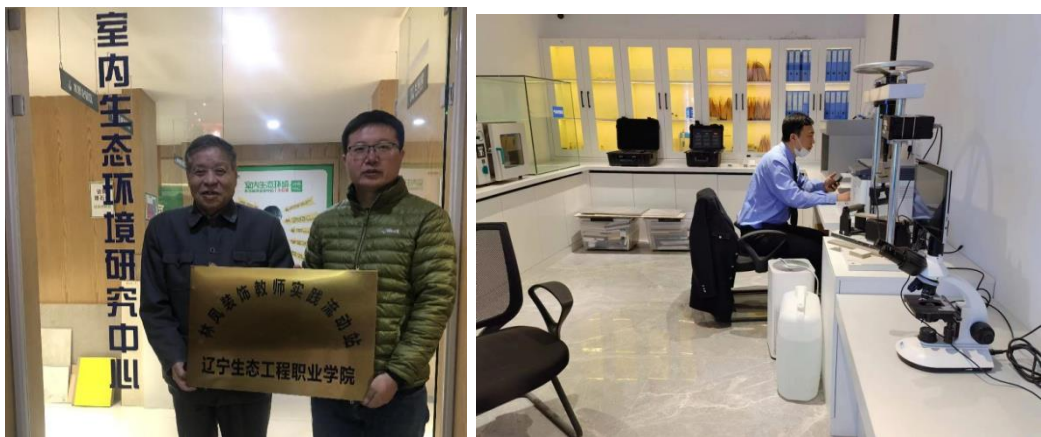
图 2 室内生态环境检测实验室

社会的绿色家居理念。为教师提升实践教学能力提供平台，检测项目所形成的典型案例可用于室内艺术设计专业教学使用，检测结果可为客户制定室内空间环境改善方案提供依据，为辽宁家居行业环保转型升级提供支持，实现多方共赢。每年可供专业教师 10 人以上、学生 100 人以上使用。