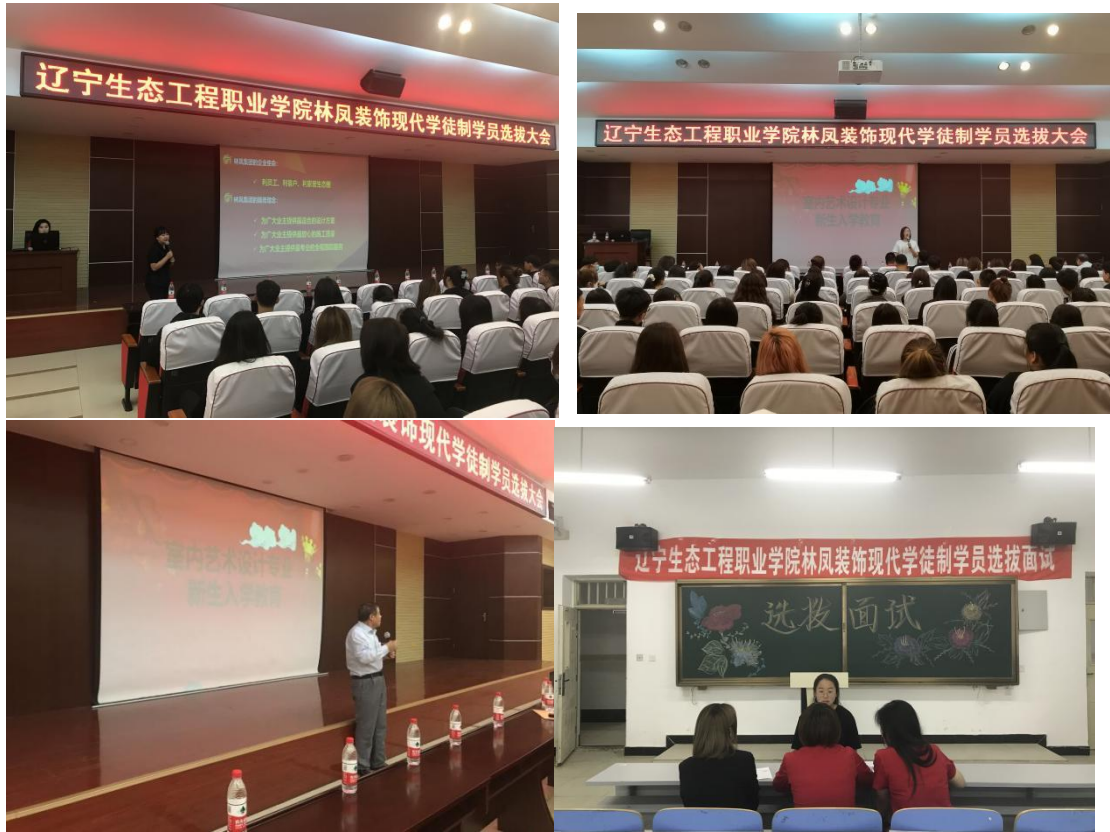
图3 成立室内艺术设计专业林凤装饰学徒制班