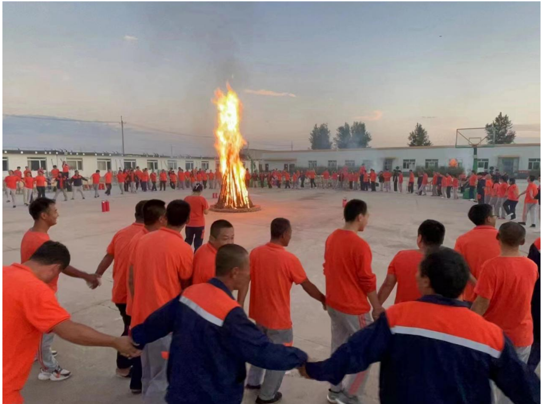
图7 产业学院师生员工多彩活动