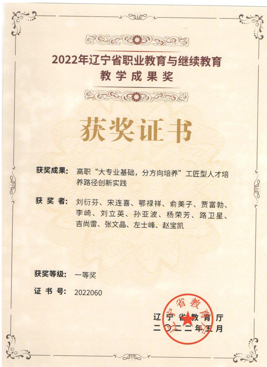
图3 创新人才培养模式获得省教育教学成果一等奖