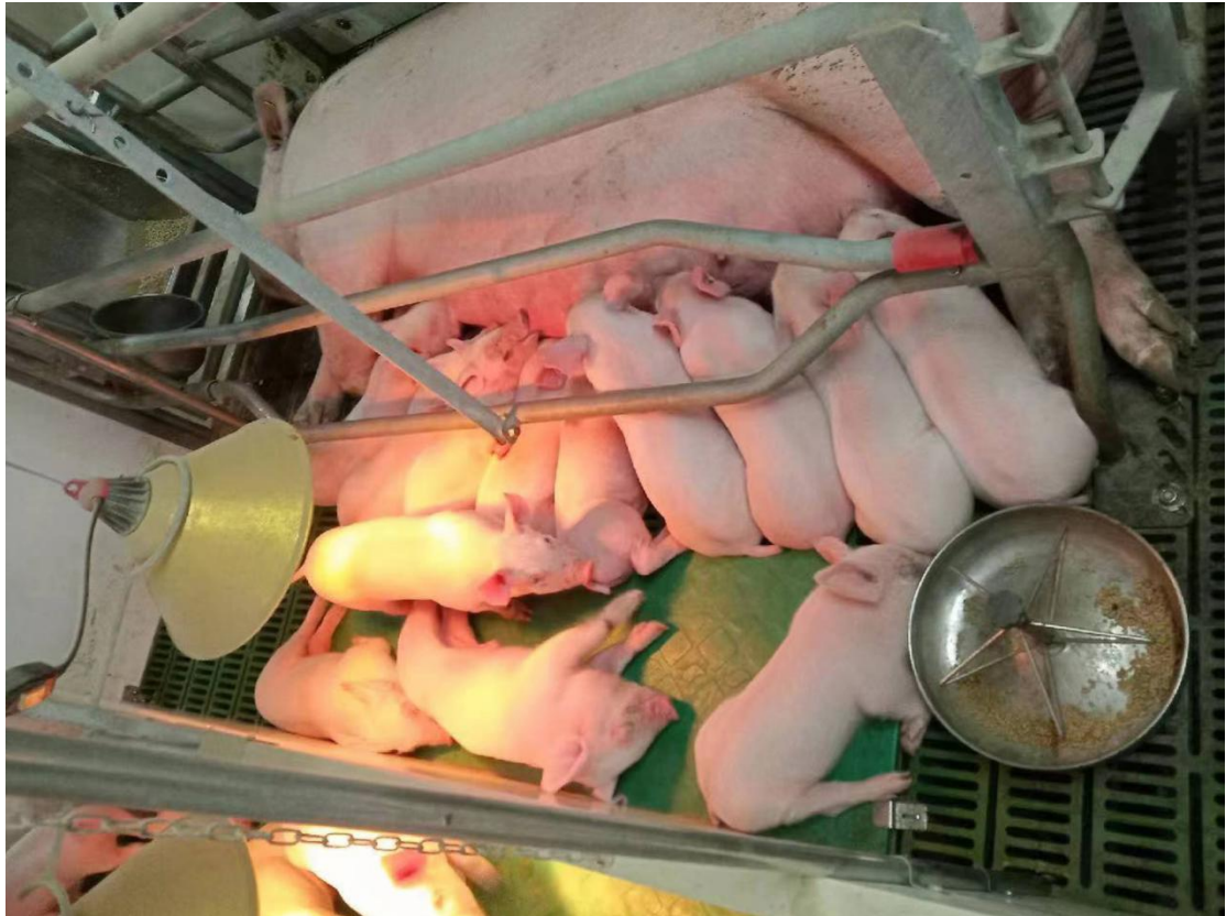
图5 真实生产场景向师生开放

建设开展虚拟仿真教学资源开发与推广，2022年获批辽宁省职业教育虚拟仿真实训项目2项。