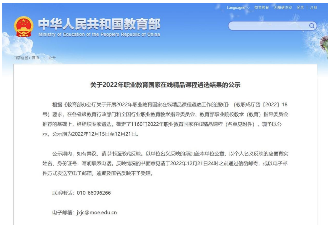
图4 国家在线精品课程遴选结果公示