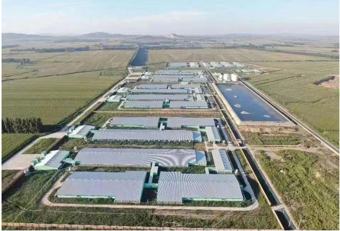
图1 产业学院生产场区