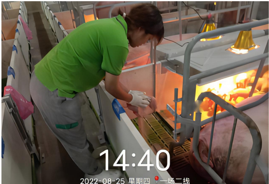
图6 专业学生在真实岗位开展学习