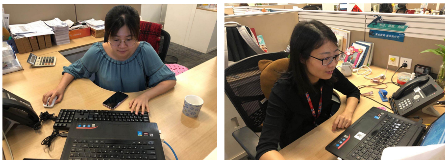
图 12 怡亚通顶岗实习

目，转化为良好的项目化教学案例；六是提高教师本人的实际操作能力，更好地将书本知识与实践相结合，以便于提高技能型人才培养质量。