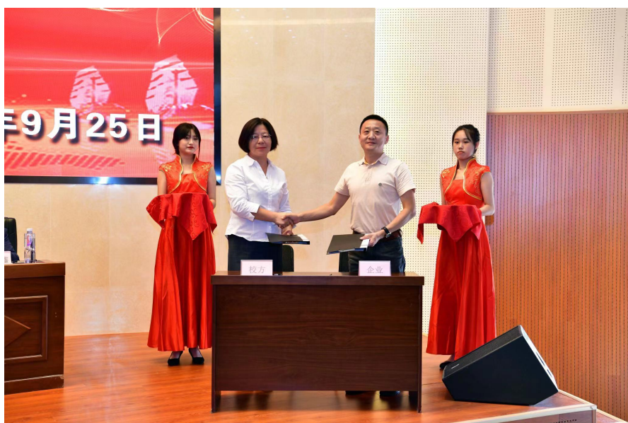
图5 怡亚通数字供应链产业学院成立大会及签约仪式