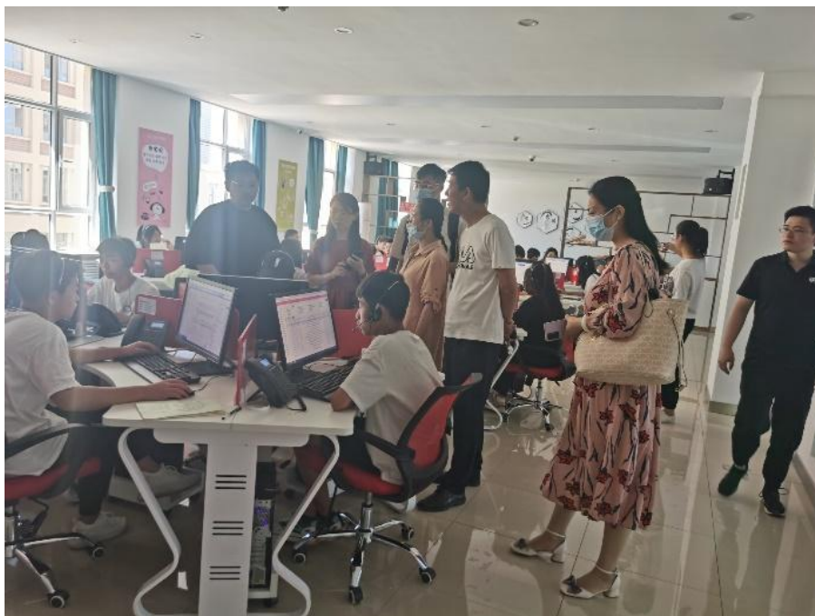
图 13 怡亚通生产性实训课程

搭建产教融合技术技能服务平台为企业和学校双向在课程研发、岗位解读等助力企业研发创新能力。怡亚通以供应链服务为基础、互联网技术为手段，集客户资源、商品资源，完善采购执行及销售执行服务、物流仓储服务、供应链金融服务、增值服务（营销、品牌孵化、资本等）等资源及能力，帮助地方打造供应链强势产业、行业、企业，不仅增加产业附加价值、创造更多就业机会。