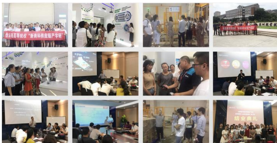
图 11 怡亚通高等院校“新商科供应链产学研”

怡亚通作为供应链龙头企业，在供应链服务已经管理方面形成了完整的体系，教师通过入企顶岗实习，一是了解企业的经营组织方式、产业发展趋势等基本情况；二是熟悉企业相关岗位的职责、工作流程、操作规范、用人标准和管理制度等具体内容；三是学习所教专业在应用中的新知识、新技能、新方法；四是结合企业的生产实际和用人标准，不断完善专业教训教学方案，改进教学方法，切实加强职业学校实践教学环节；五是抓取真实项