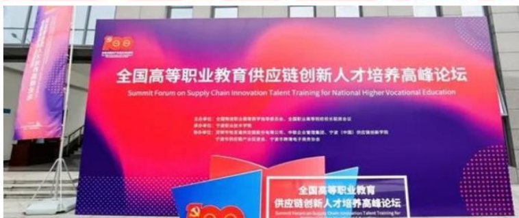
图 10 全国高等职业教育供应链创新人才培养高峰论坛