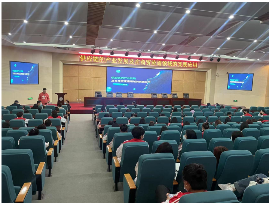
图6 怡亚通供应链产业发展报告