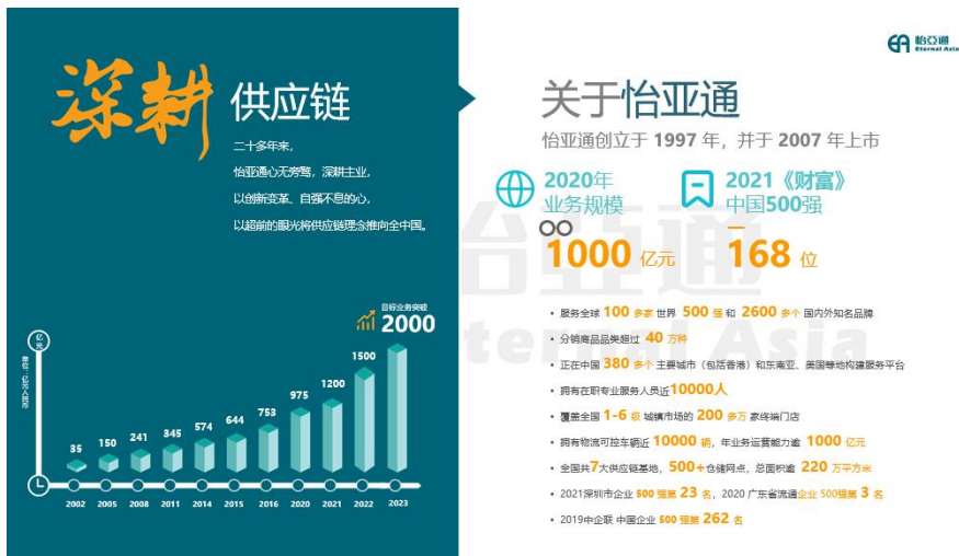
图1 深圳市怡亚通供应链股份有限公司简介

深圳市怡亚通供应链股份有限公司是以物流为基础，供应链服务平台为载体，以产业运营和品牌运营为核心的整合型运营服务商，成立于1997年，是世界500强——深圳市投资控股有限公司旗下企业，中国首家上市供应链企业，在职员工近万人，2020年业务量近1000亿元，2021《财富》中国500强排名168位。