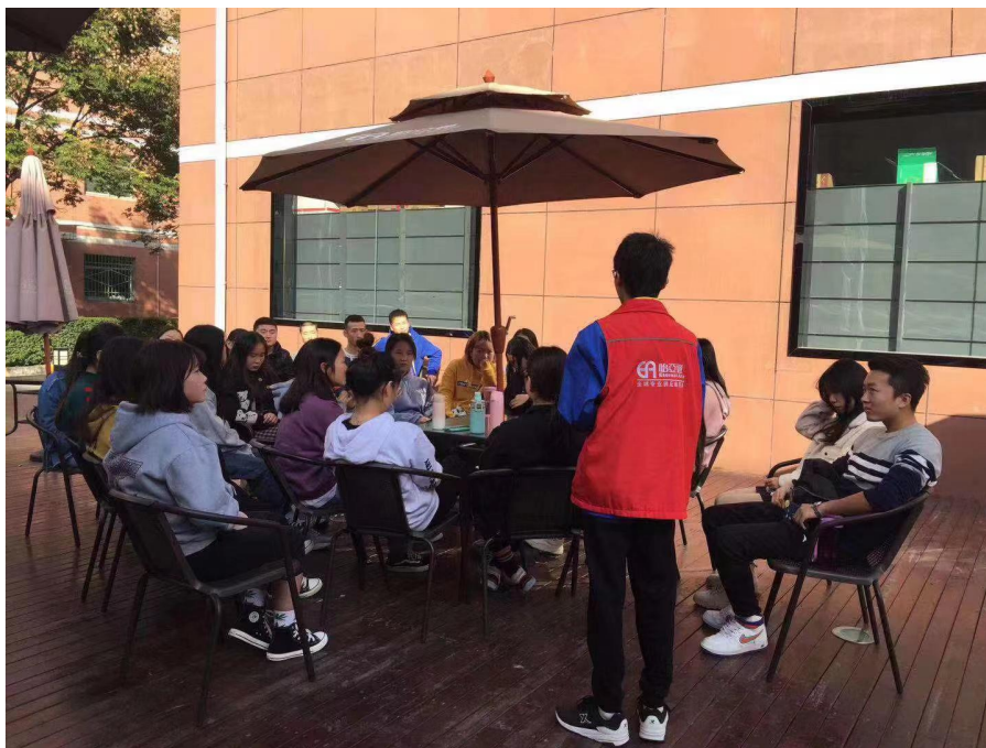
图8 怡亚通企业导师开展项目化教学

面向供应链管理师新职业、新媒体技术能力培养，根据每个专业的特色与差异化，都做了项目式的技能训练与培养。为专业群的生产性运营，学生的创新创业进行流量上的赋能。其目的就是让学生在在工作中成长，也让学生用专业视角通过数字经济为专业群建设代言。指派2名企业导师，带领学院学生度更新知识，更能适应未来工作，同时让学生达到毕业即就业。教学过程中有完善的实训薪酬与奖惩机制。