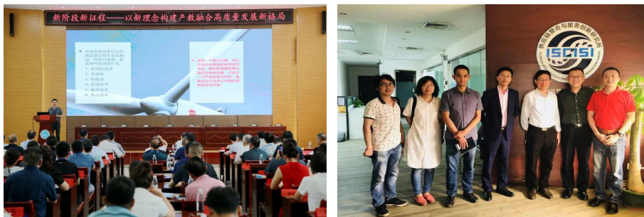
图9 学院客座教授、怡亚通公司副总裁做专题报告