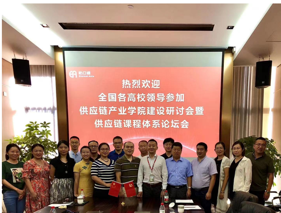
图 7 怡亚通供应链产业学院建设研讨会暨供应链课程体系论坛会