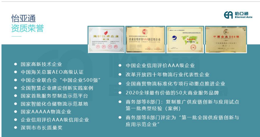
图2 深圳市怡亚通供应链股份有限公司资质荣誉