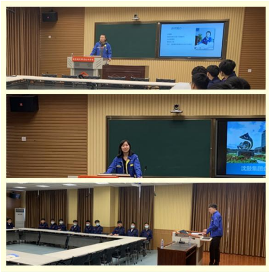
图 2 企业教师入校培训

自 2017 年始，沈鼓集团依托集团大师工作室对辽宁机电职业技术学院实习学生开展各个工种的岗位技能提升培训。内容包括机械类通用基础课程、各工种专业理论课程及实际操作课程。理论授课教师来自于培训中心内部的专职讲师，技能授课教师为企业内部有着丰富的实际操作经验的技能大师，培训过程中授课教师使用了大量的教学教具，脱产式的教学使学员系统的掌握机械制图的原理、过程，更好的掌握了机械制图的方法，熟练的掌握了本工种的实际操作技能，使学员在工作岗位更加得心应手，大大的缩短了员工的岗位实习期，受到基层用人部门的一致好评。