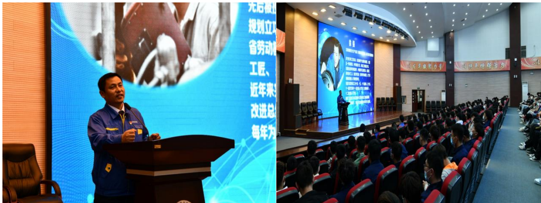
图 6 全国劳模、大国工匠讲座

组建企业兼职教师队伍，选派全国劳模、大国工匠、工程技术人员入校开展职业技能和职业素养教育；