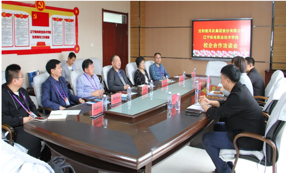
图 1 沈鼓集团在辽宁机电职业技术学院洽谈校企合作

沈鼓集团与辽宁机电职业技术学院的合作历史悠久，双方共建产教融合型实训基地，开展现代学徒制人才培养，探索校企双主体育人的人才培养模式。