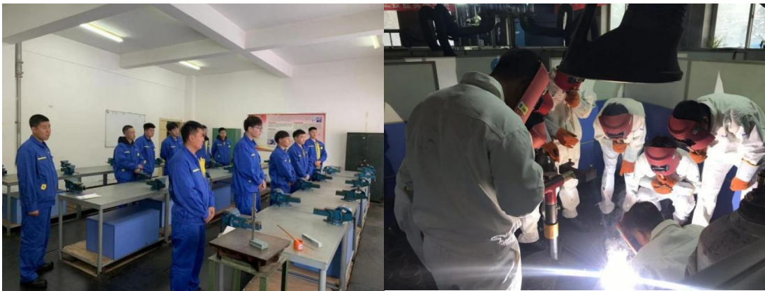
图 5 沈鼓集团进行学员岗位能力培训

在产教融合型实训基地建设过程中，沈鼓集团先后培养装配钳工、电焊工、车工等订单班和学徒制班学生 100 余人次，培训投入近 100 万元。给实习学生提供了完善的保险保障，提供宿舍或租房补贴、餐补、服装及劳保用品、交通补贴、实习生活补贴，人均成本约 50000 元/年，近三年累计近 450 万元。