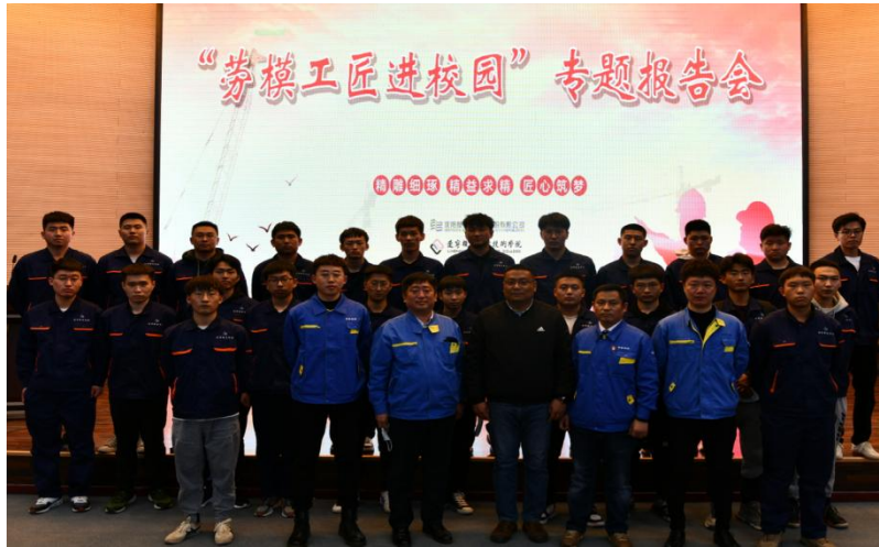
图 3 劳模工匠入校开展订单培养