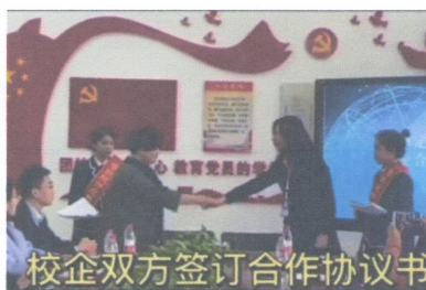
校企双方签订合作协议书