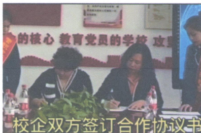
校企双方签订合作协议书