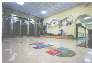
清原县青鸟融合幼儿园参与营口职业技术学院高职人才培养年度报告（2023）