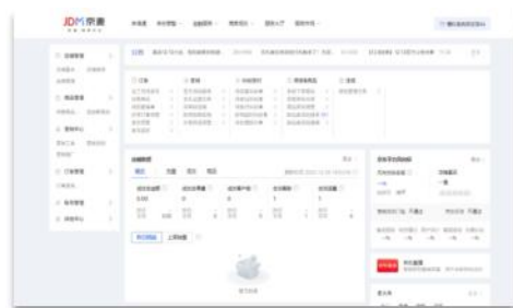
京东电商实训平台店铺后台界面

市面上开通真实京东平台店铺账号需 8 万元(费用包含一年以上营业执照+店铺保证金+店铺服务费)。在校期间学生每人拥有一个实名制京东电商实训平台模拟账号，拥有一个属于自己的店铺模拟后台进行实训，京东讲师通过理论加实践知识相结合的授课方式，让学生更快的理解京东店铺运营技巧和后台端口操作端口。