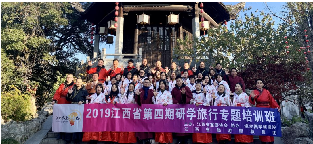
图 2-3 2019 年江西省第四期研学旅行专题培训班

2017年至今，集团先后组织了“旅游管理双师型教师研修培训班”“旅游电子商务教师研修培训班”“乡村旅游·江西样板”等培训共计8场，共有来自32家集团单位的500余位成员代表参与学习。培训班分别邀请集团内企业高管、行业专家、名师名导对当下“一带一路与旅游发展”“旅游大数据的分析与应用”“全域旅游”“非遗文化保护与利用”等热门话题开展教学培训。集团以宣传旅游前沿知识、打造培训学习平台为目标，致力于提升集团成员单位教学水平与业务能力，提升集团凝聚力。