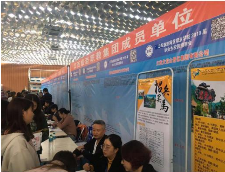
图 2-5 2019 届毕业生校园招聘会