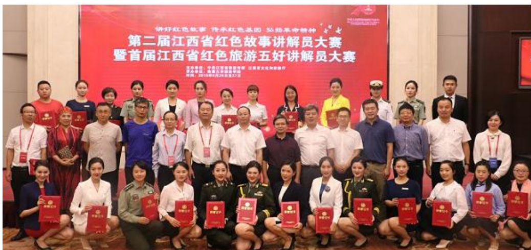
图 2-4 首届江西省红色旅游五好讲解员大赛