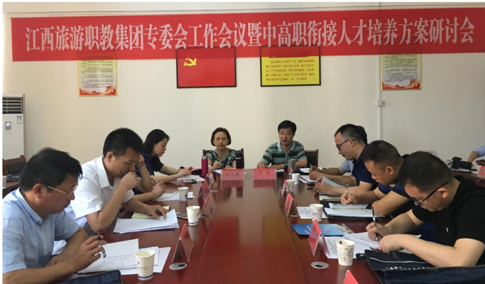
图 2-1 江西旅游职教集团中高职衔接人才培养方案研讨会

集团成员单位赣州旅游职业学校、靖安县职业中等专业学校、南丰职业中等专业学校、彭泽县职业教育中心、玉山职业中等专业学校、资溪县职业中学等六所中职院校与江西旅游商贸职业学院先后签订中高职教育对接培养合作协议，开展中职、高职衔接“3+2”分段培养教学模式。双方共同研究制定人才培养方案，在学科建设、人才培养、课程设置等方面开展合作，推动产教对接，发挥集团优势。2018年6月，在彭泽县职业教育中心成功召开“江西旅游职教集团专委会工作会议暨中高职衔接人才培养方案研讨会”。此次会议对集团秘书处拟定的新版中高职人才培养方案进行了商讨，初步确定了旅游管理专业中高职人才培养修改方案，力求避免中职高职课程重复开设导致教学资源浪费。