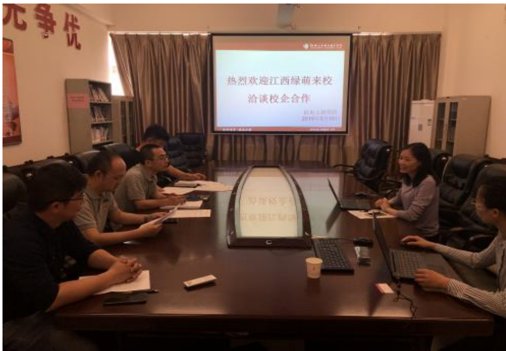
图 8 企业进校进行合作洽谈

合作期间，学校与企业不断加深沟通和联系，探索建立和深化校企合作运行制度、校企合作考核制度、专业建设委员会联席会议制度，学校二级学院负责同志与教师与企业人员建立起了长期稳定的互通机制，确保了协同育人机制顺利实施。