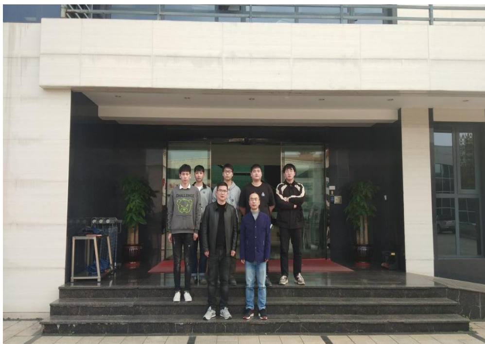
图 9 学院教师与学生在企业