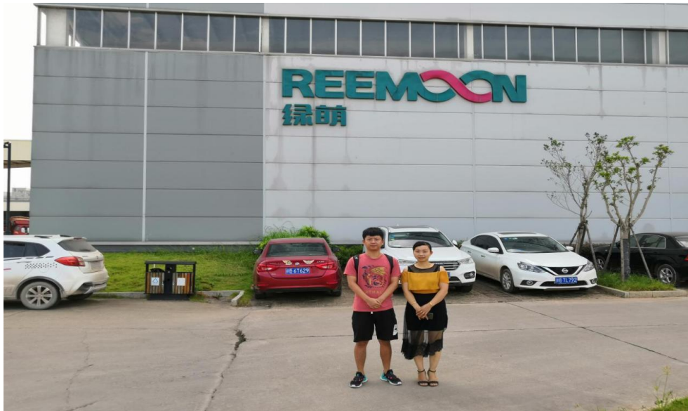
图 6 学校教师前往企业考察学习

江西绿萌科技控股有限公司和学院共同建设教师流动中心，建立灵活的人才流动机制，建立双师型队伍，双方共同制定双向挂职锻炼，联合技术研发、专业建设的管理制度等，给老师提供下企业实践的平台，对接产业，有效提升了老师的专业实践能力和专业的适用性；同时帮助教师深入了解企业用人需求，提升学院人才培养的匹配度。