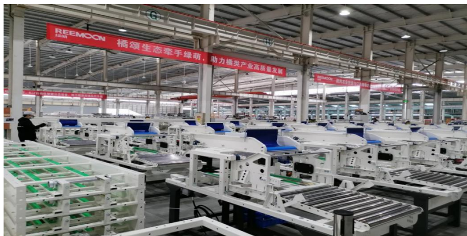
图 5 项目教学和生产案例现场教学

在学生培育方面企业和学院共同探索采用项目教学和生产案例现场教学，然后分组在企业车间进行训练。使学院和产业一体化，生产和实训一体化，技能训练和素养培养一体化，实现“教学、生产合二为一”。在项目训练过程中，公司委派专业技术过硬、细心耐心的师傅与实习指导老师对学生进行管理和考核。