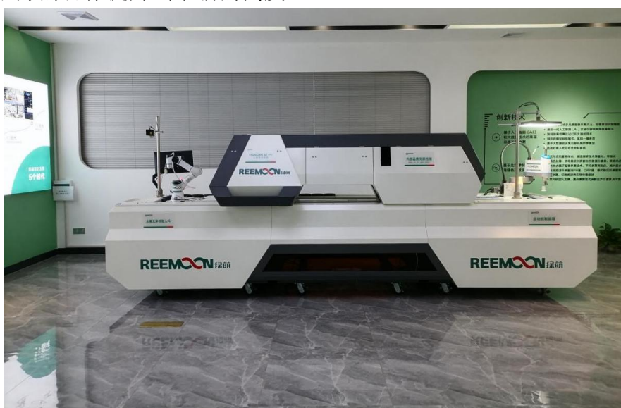
图3 公司借用设备样机

2022年，在双方领导的大力支持下，本着资源共享、优势互补、相互协作、共同发展的原则，江西绿萌科技控股有限公司与学院合作成立了江西绿萌订单班，同时绿萌公司还将部分生产设备免费借用给学院，用以辅助绿萌班教学，校企双方的合作提升到了新的高度。