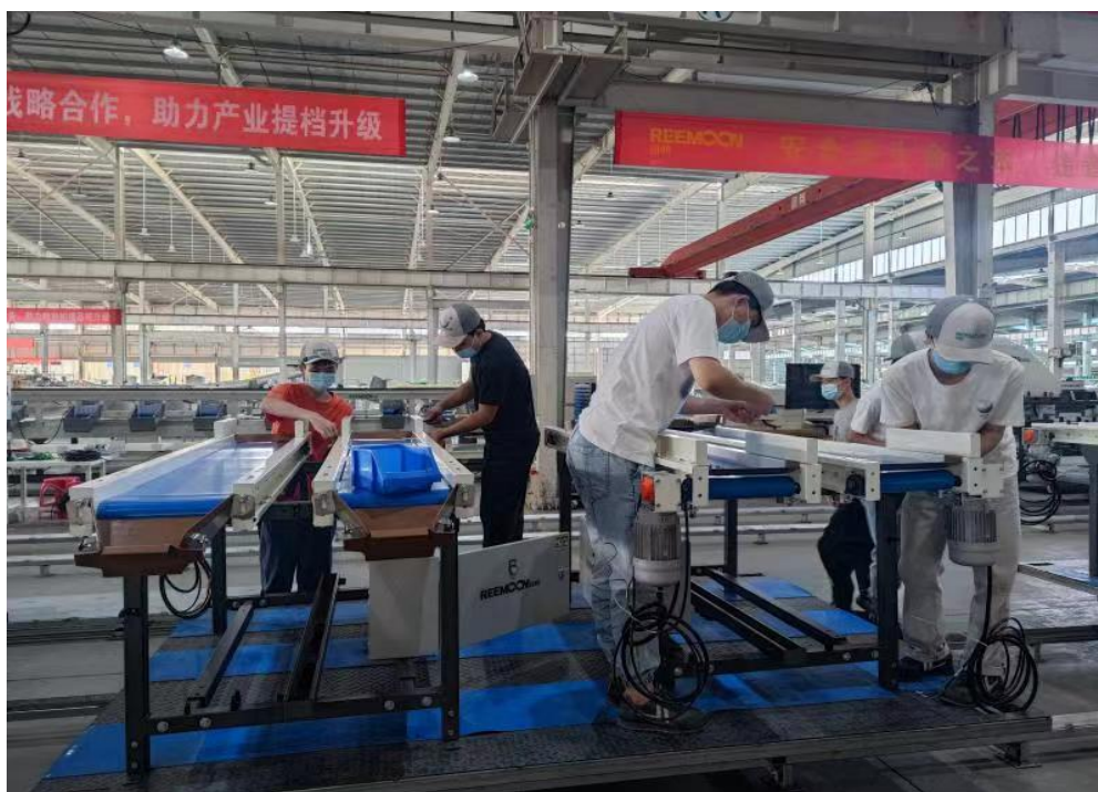
图 10 学生在绿萌公司顶岗实习

通过校企双方的合作，对表现优秀的学生积极录用到公司，对公司发展起到了关键作用，在人才队伍建设方面也形成了很好的梯队建设，2022 年对表现优秀的学生（3 人）优先录用，安排到公司技术岗位，着力进行培养。