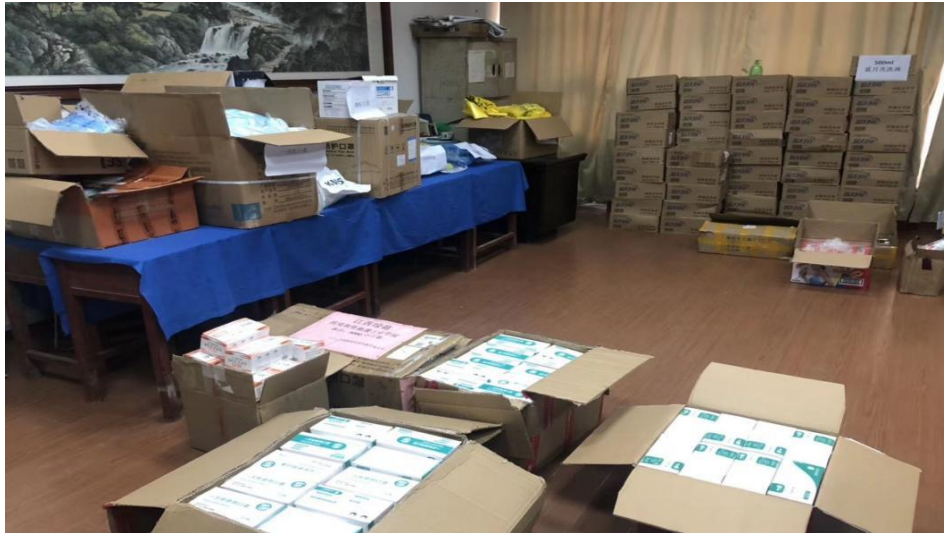
图 4 疫情期间公司捐赠物资