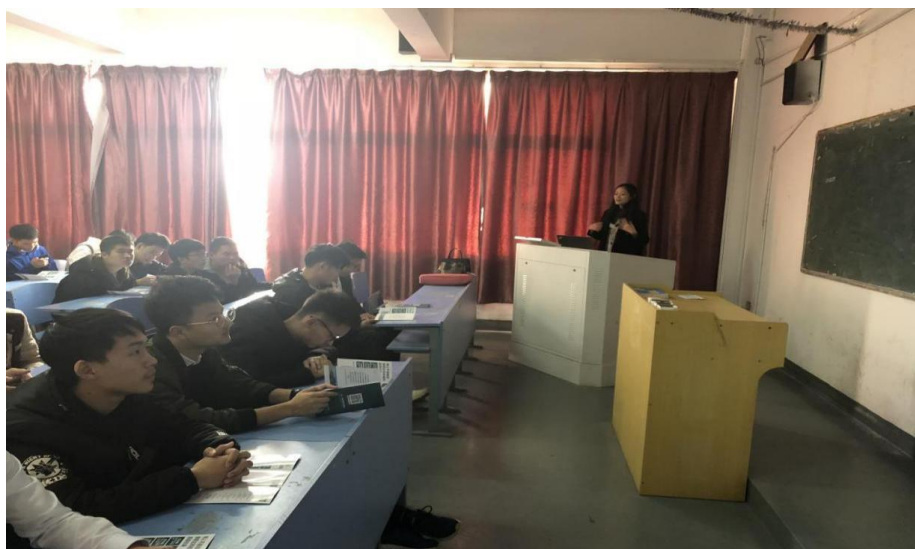
图 1 企业与学生见面会

江西绿萌公司与江西工业职业技术学院已合作多年。绿萌公司每年都会为学校顶岗实习学生提供岗位，学校学生也会积极前往绿萌公司进行顶岗实习工作。绿萌公司积极参与学院校园招聘，学院大量优秀毕业生进入企业工作，现有 60 余人在绿萌公司各个岗位发光发热。此外，公司还积极组织到学院举行讲座，宣扬企业文化，推进校企合作深入开展。