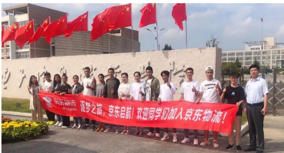
图 2-2 我司安排专车专人来贵校接应专业实习学生