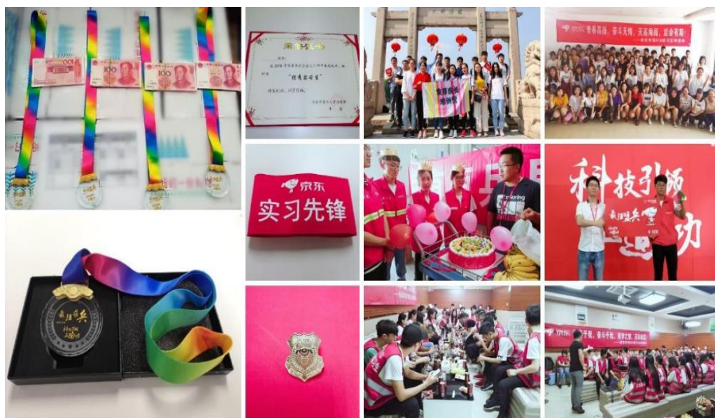
图 4-9 京东物流人才激励活动