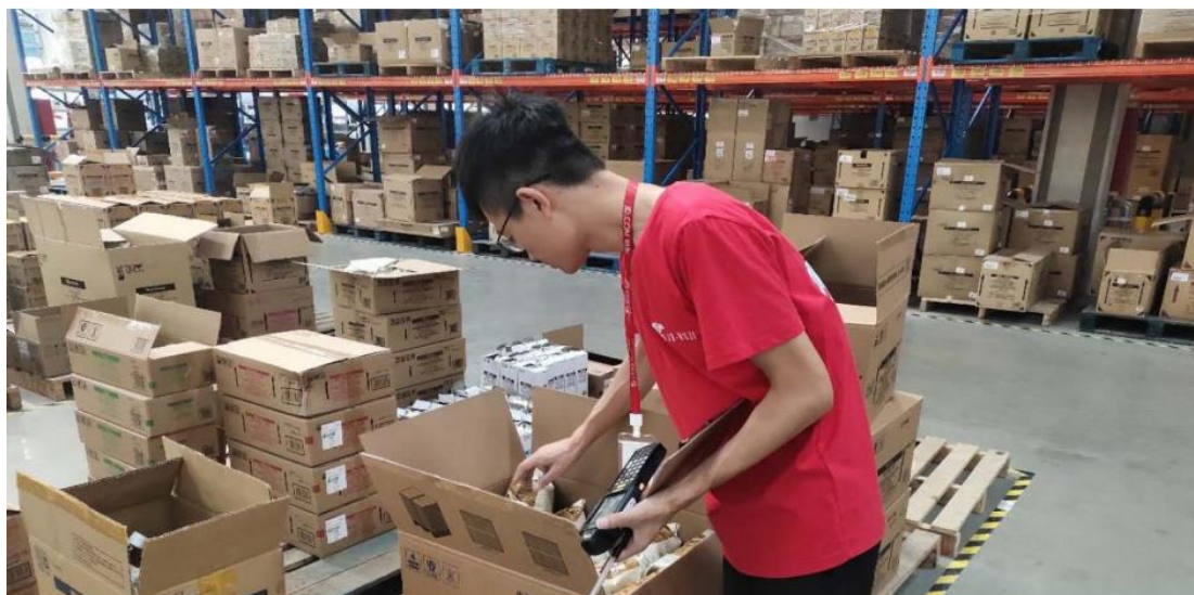
图 4-3 企业实践基地收货员岗：负责商品的清点入库、信息统计工作