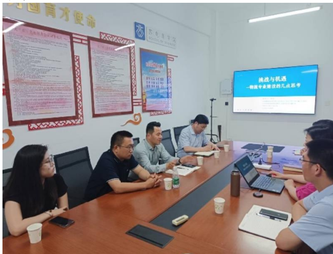
图 4-1 京东物流参与专业发展研讨

电子商务专业群主要面向现代服务业，能适应“互联网+”需求，能胜任电话客服、在线客服、电商运营、拣货、打包、物流大数据分析等工作需要，具有良好思想品质、职业道德、敬业精神、责任意识和熟练操作各类电子商务平台的综合能力，具有市场经济适应能力和竞争能力，具有创新创业意识、精深专业技能和良好职业素养，可持续发展的“善推广、能运营、可创业”高素质技术技能型人才。