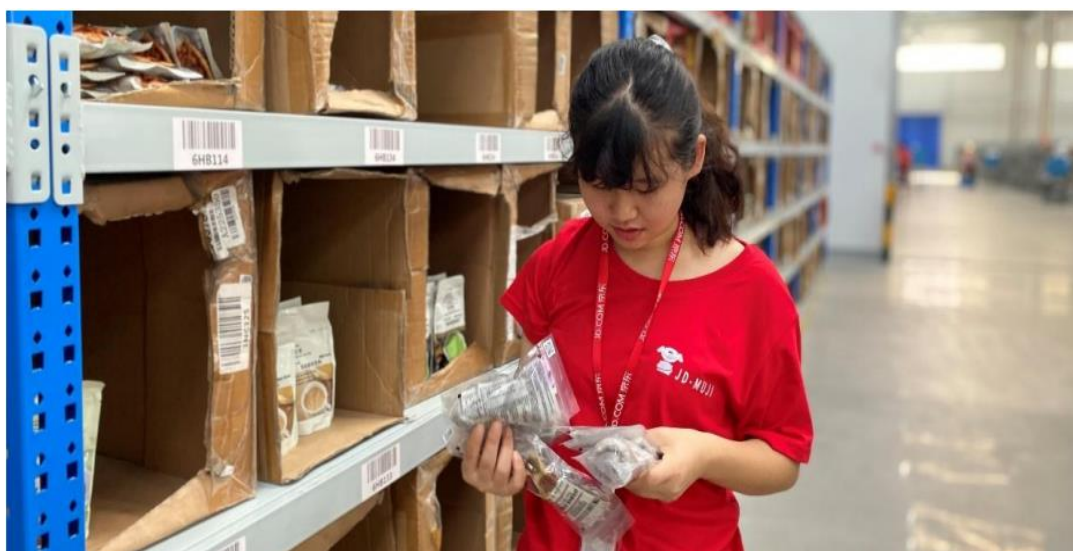
图 4-4 企业实践基地盘点员岗：库内异常货物处理，货物的盘点整理工作