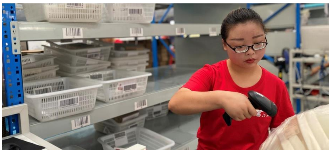
图 4-7 企业实践基地打包员岗：根据相应的订单编码分类打包商品出库