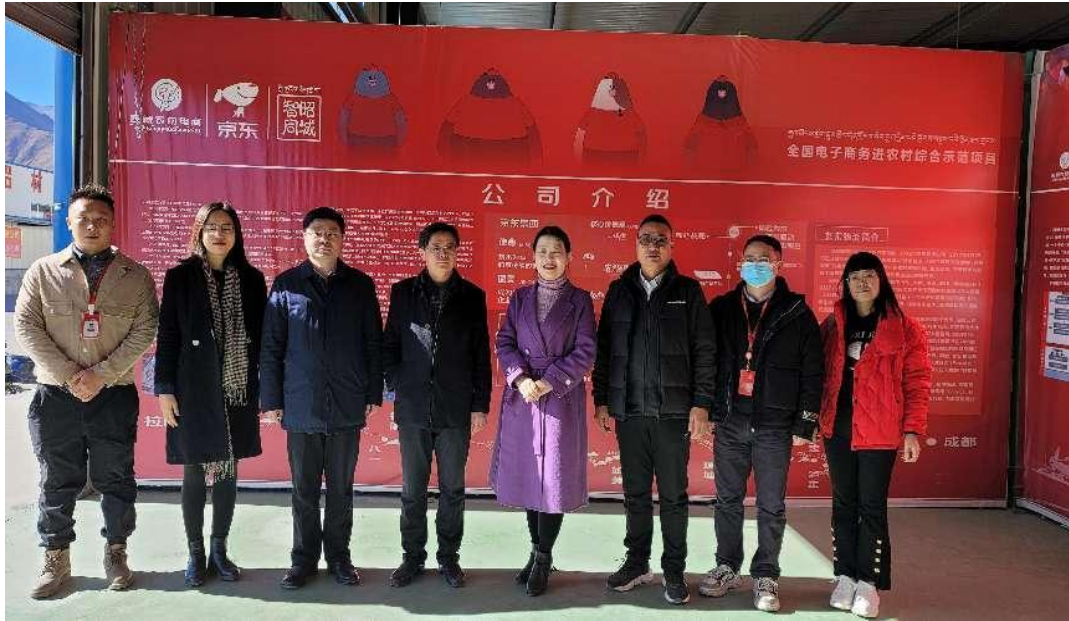
图 4-10 我司与贵校共赴西藏参加“2+1+就业”校外实践调研