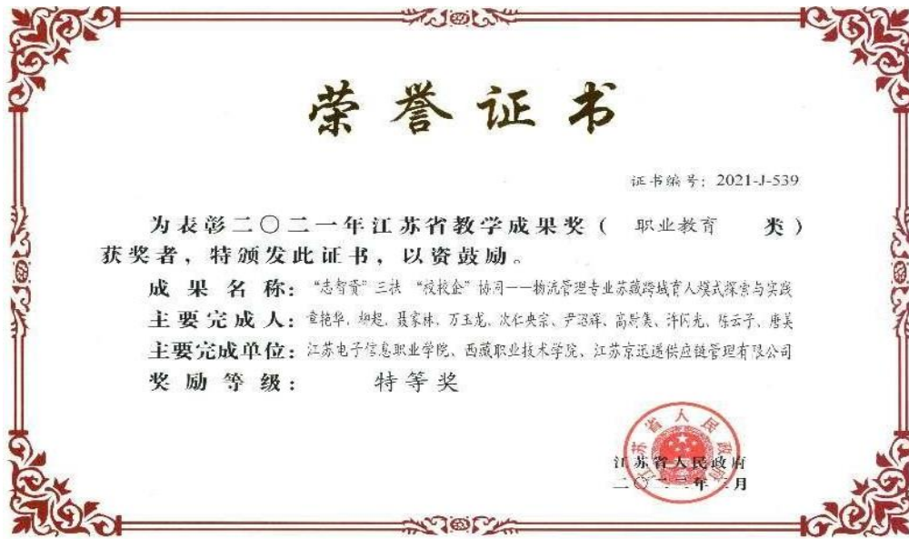
图 2-5 我司协助贵校获 2021 年江苏省教学成果奖（职业教育类）特等奖