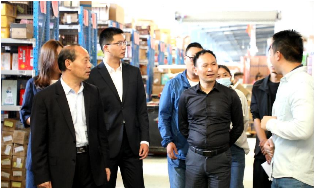
图 4-11 我司与贵校共赴西藏参加“2+1+就业”校外实践调研