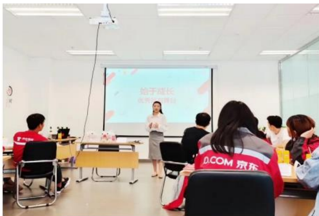
图 4-2 企业教师在生产现场授课