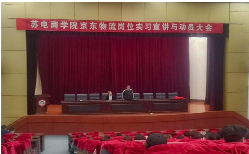
图 2-1 我司在贵校开展物流岗位实习宣讲与动员

提供笔试、面试、实习机会。除了解决学生的实习实践工作外，京东还为专业建设所需的校内实践室建设出谋划策。一方面为学校专业实践室建设提供参考范本，一方面充分利用校内实践室为专业学生做专业介绍，解答学生有关专业发展的问题，利用校内实践室活动密切机构与学校的关系，帮助同学们更好的走进社会，夯实商贸技能，深入电商、物流、会计、财务管理等岗位一线，了解行业发展，为将来的学习和就业工作打下良好基础，在企业里，用所学技能修身，放飞自己的青春梦想。