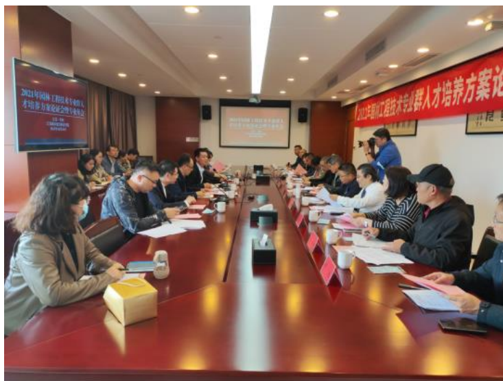
图 8 人才培养方案讨论会

江苏城乡建设职业学院邀请家博园艺参与修订了 2020、2021 版人才培养方案。方案参考了家博园艺对于美丽中国建设新时期园林景观设计、园林工程技术等方向人才培养的需求，让园林工程技术学生了解最新的岗位需求，学习园林景观设计、园林工程施工、工程管理等岗位的知识与技能要求，学生可以选择自己喜欢的方向进一步深入学习。使学生所学的知识与技能可以满足不同岗位的需要。这样既避免了学生学习的盲目性，也使学校在安排顶岗实习时有了明确的方向。