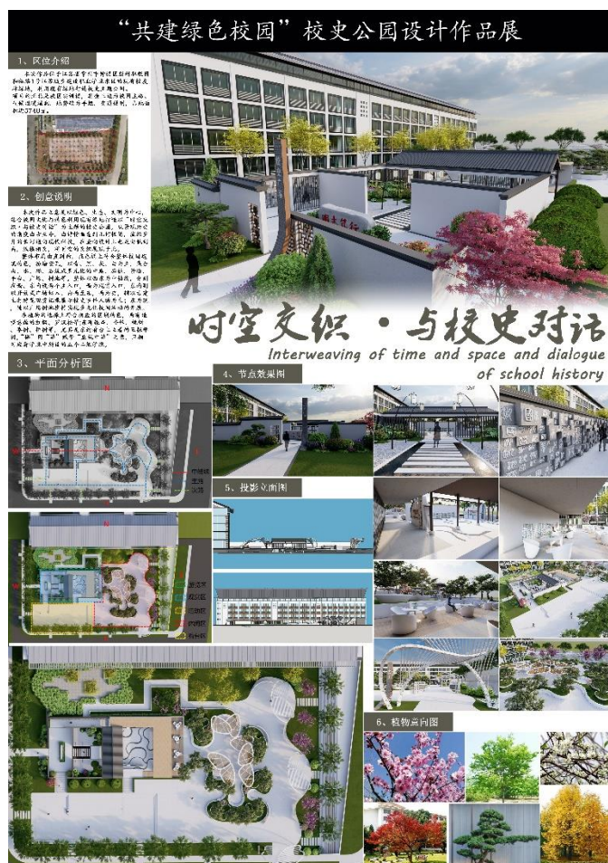
图 5 家博园艺公司校史公园设计竞赛作品