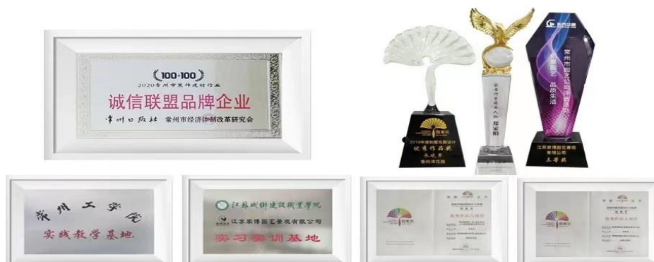
图 1 公司部分荣誉及资质