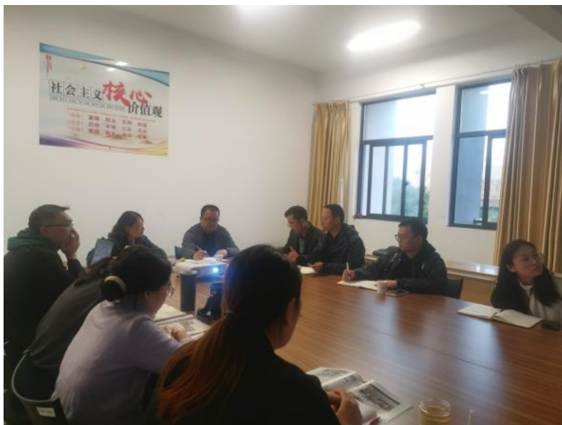
图 6 校史公园方案探讨