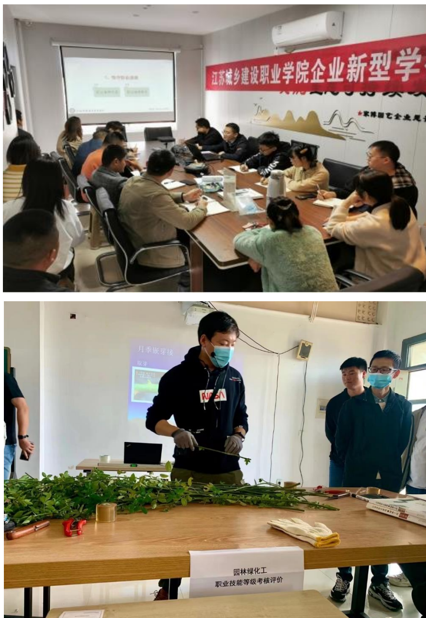
图 11 企业新型学徒制培训开课

（2）针对中高层管理，开设中短期培训和交流课程，通过参观考察、工程实践、专家讲座引领、企业家沙龙等活动，了解产业发展新趋势、行业发展新动态、技术发展新动向，达到有效提升企业管理层科学决策水平和跨界碰撞新思维。