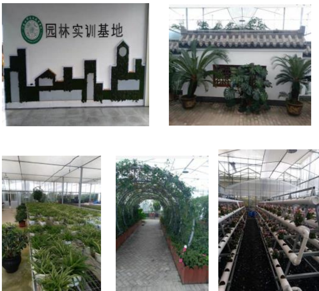
图7 园林工程技术中心