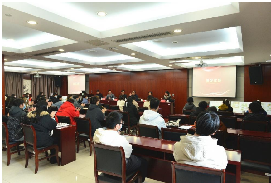
图 2 合作办学

自 2020 年起江苏家博园艺景观有限公司与江苏城乡建设职业学院在人才培养方案、课程设置、课程标准等重要教学文件编制、企业师资安排、青年教师挂职、专业实训教学、顶岗实习、员工培训、技术研发等多个方面开展了富有成效的合作。家博园艺每年都会从园林专业在企业顶岗实习的学生中留用优秀毕业生充实企业的专业力量，江苏城乡建设职业学院园林专业教师也作为企业兼职技术专家为企业的生产提供技术指导。家博园艺连续两年在江苏城乡建设职业学院举办景观设计大赛，结合校园大课堂项目，选取获奖选手，对于校园进行绿地景观改造，提高了学生的创新思维能力。