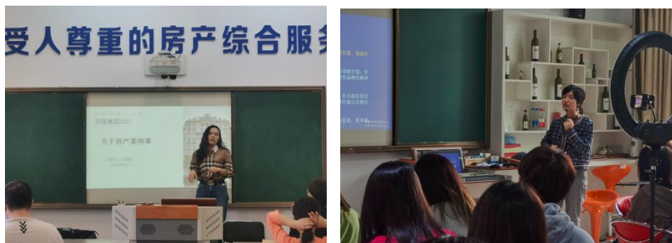
图4 企业专家进课堂上课、开展讲座