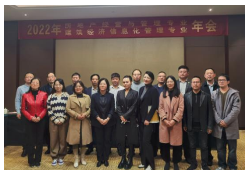
图 2 2022 年企业专家参与专业年会