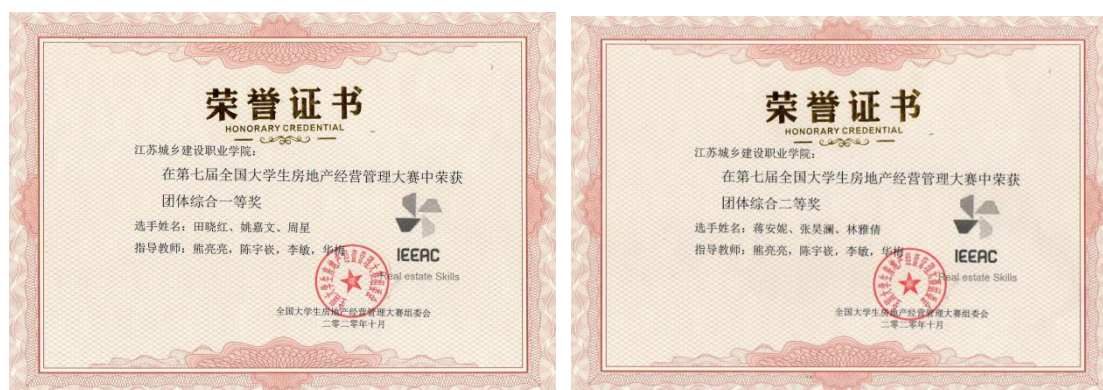
图5 协助指导学生参加第七届全国大学生经营管理大赛

我公司指派资深营销经理为江苏城乡建设职业学院房地产经营与管理专业学生参加技能竞赛提供专业支持，帮助学生提升专业技能的同时，提升学生获奖的机会。在校企合作共同指导下，参赛学生在第七届全国大学生经营管理大赛中分别荣获了团体综合一等奖和二等奖的优异成绩，在“易居杯”第13、14届全国大学生房地产策划大赛中获得全国三等奖。