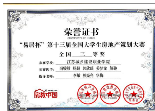
图6 “易居杯”第13届全国大学生房地产策划大赛全国三等奖