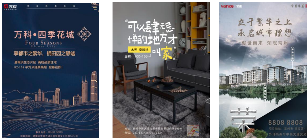
图3 《房地产项目策划》课程中学生以企业提供项目为背景设计的广告画面

通过我公司提供的实际案例项目融入教学的模式，丰富课堂教学形式的同时，也让学生提前了解企业发展方向和工作内容，为学生到企业企业实习打好基础。