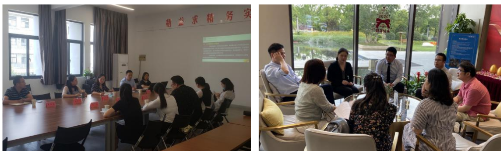
图 1 校区双方多次共同研讨现代学徒制合作培养

人才培养方案和课程体系，建立校企双主体考评制度，课程考评价以学校为主，实习考评以企业为主。多次对房地产经营与管理专业核心课程的课程标准的制定与修改提出意见与建议，协助江苏城乡建设职业学院房管教研室完成了主要课程标准的编制，并每年指派企业专家参与专业年会，对人才培养方案的滚动修订提出了指导性的意见。