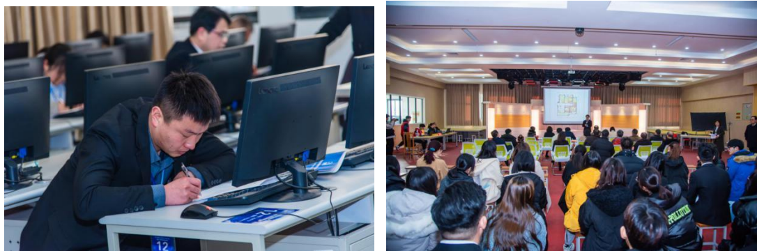
图 8 2020 年江苏省房地产经纪行业从业人员职业技能竞赛现场

我公司结合房地产经纪行业一线的工作经验，协助江苏省城乡建设职业学院承办 2020 年江苏省房地产经纪行业从业人员、2022 年全省百万建设职工职业技能竞赛“链家杯”房地产经纪人职业技能竞赛提供支持，如为大赛策划出谋划策，为专业老师出题提供建议等，协助为江苏省城乡建设职业学院成功举办了大赛。来自全省 13 个设区市的 129 位房产经纪人员参赛，过岗位比武，提升了我省房地产经纪行业从业人员的专业技能和服务品质，展现了房地产经纪行业的专业形象和精神风貌，增强了行业从业人员的使命感、成就感、荣誉感，不断提供规范化、诚信化、精细化的服务，为促进房地产经纪行业向专业化、职业化发展作出了贡献。