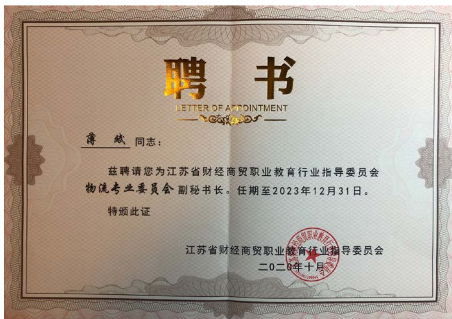
图 12：江苏省财经商贸职业教育指导委员会聘书