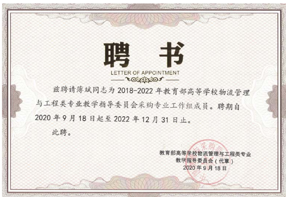
图 11: 物流管理与工程类专业教学指导委员会聘书 2