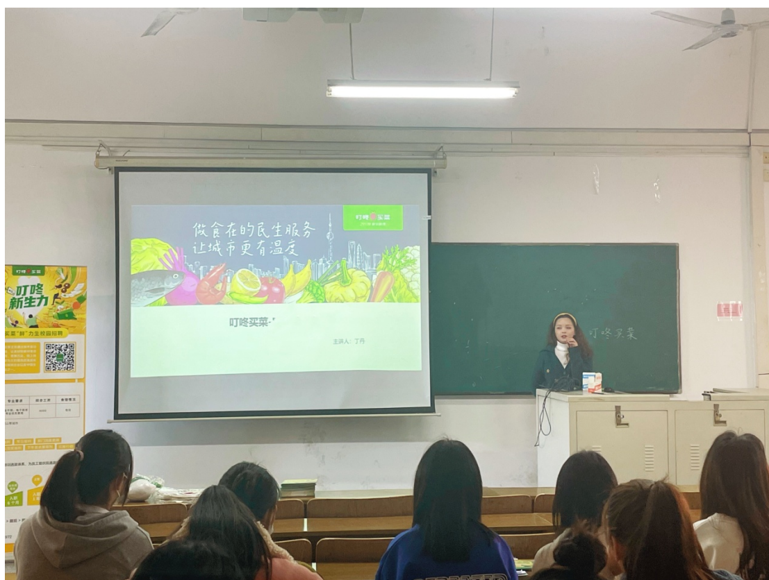
图 14：叮咚买菜招聘会现场

为引导 22 届毕业生早日顺利就业，商学院从企业宣讲、校企合作、个别辅导等多方面拓宽毕业生就业渠道，搭建广阔的就业平台。