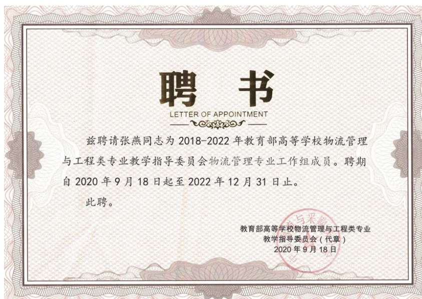
图 10: 物流管理与工程类专业教学指导委员会聘书 1