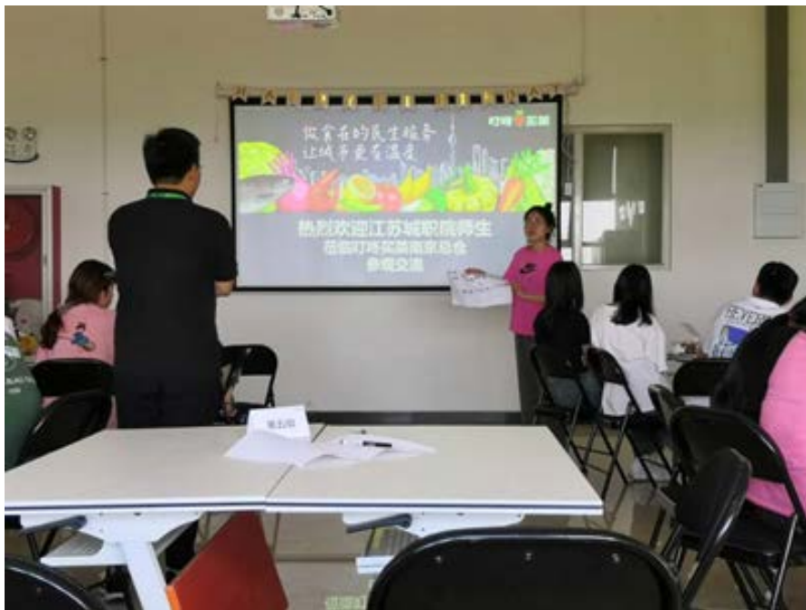
图 8：“叮咚买菜”鲜力生订单班第二课（学生演讲）