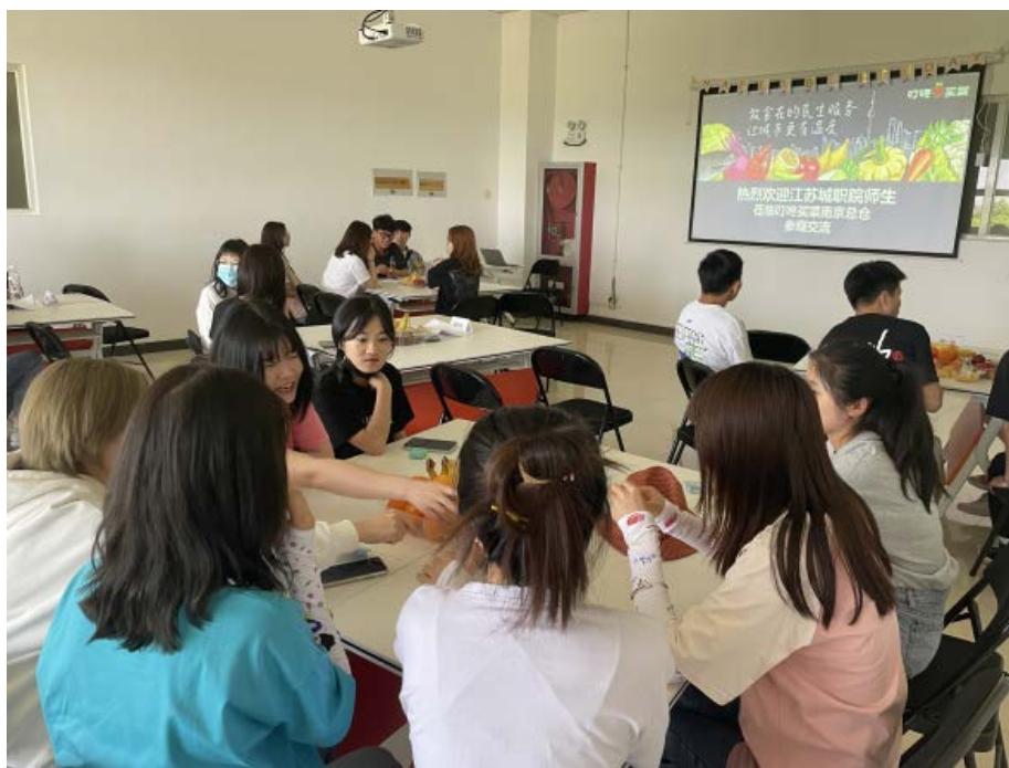
图 9：“叮咚买菜”鲜力生订单班第二课（团队游戏）