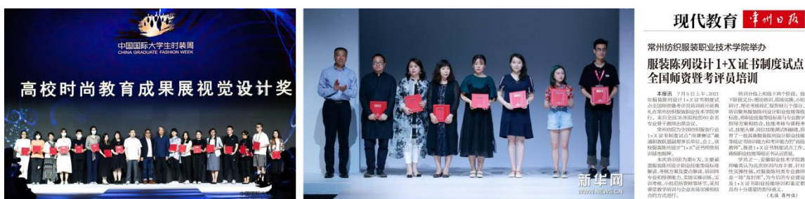
图 5 人才培养成果受到媒体的广泛宣传、报道

2020 年江苏省教育频道专题报道了本专业 1+X 证书制度试点成果《紫金奖·第二届中国(南京)大学生设计展》、《首届全国职业院校学生服装商品展示技术技能大赛》，2021 年《常州日报》专题刊登了我校服装陈列设计 1+X 证书培训报道。