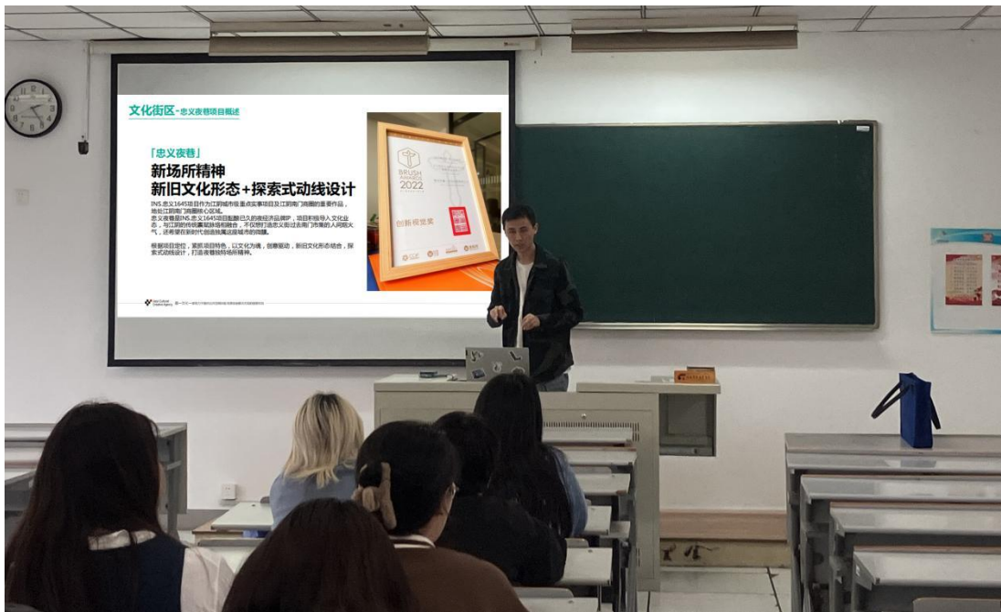
图 2 企业设计总监进专业课堂