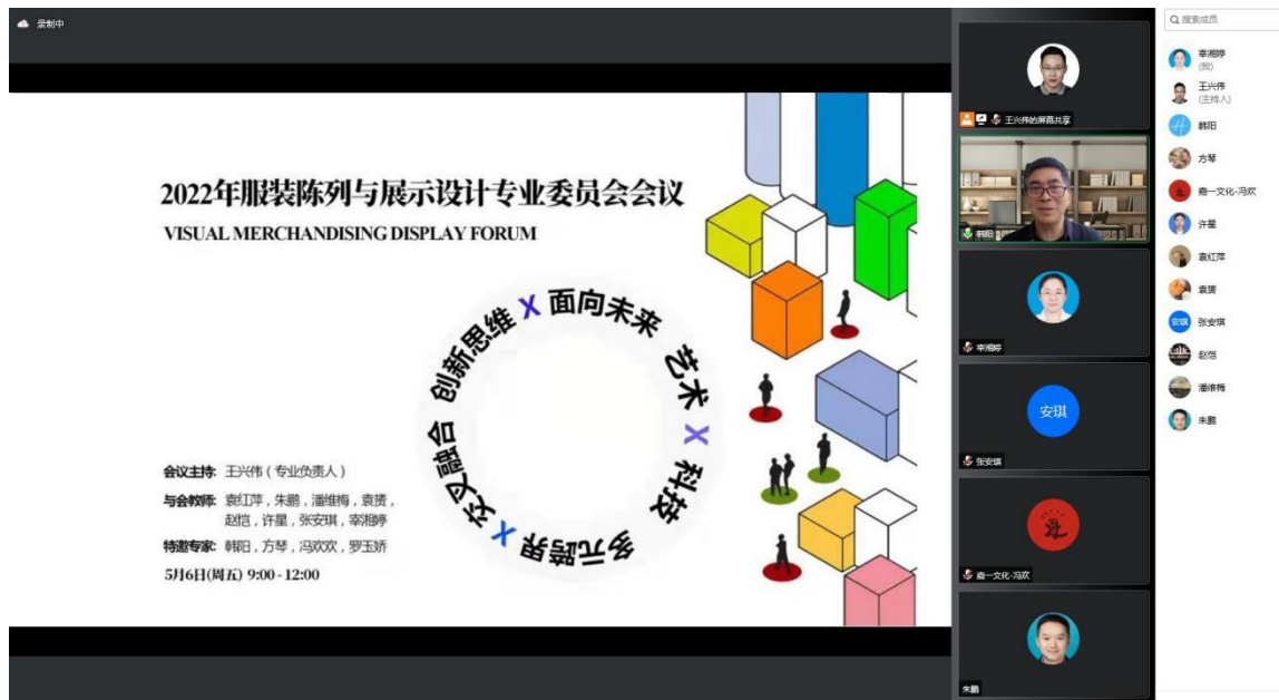
图 3 企业设计总监参与专业委员会会议