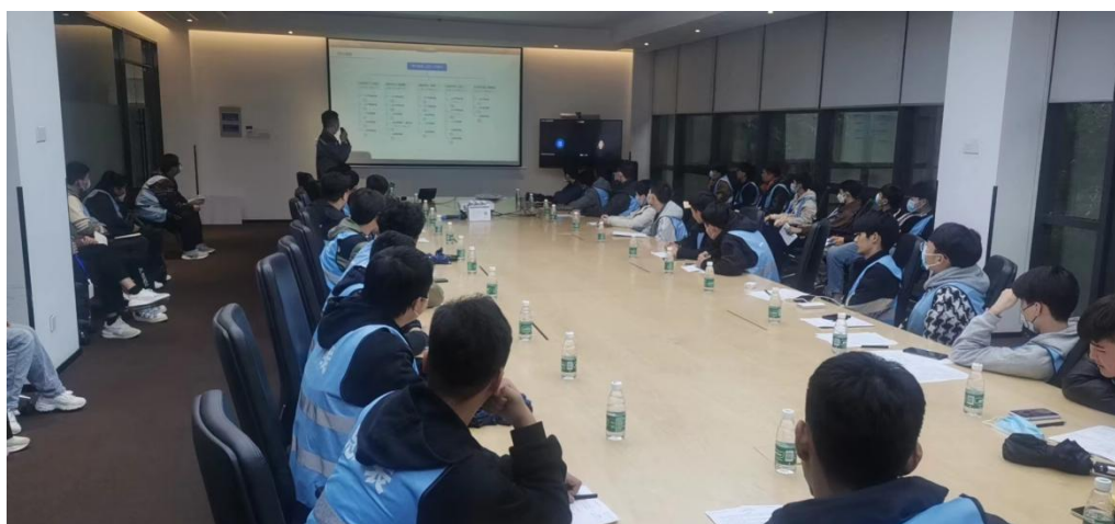
图 4-4 长安马自达汽车派遣技术人员为实习学生开展培训

配合学校构建校企“双主体”育人平台，明确企业和学校在人才培养工作中的主体责任，落实学生和学徒的双重身份，为学生的教育管理提供制度保障。形成校企合作办学、合作育人、合作就业的长效机制，努力构建职业教育企、校一体化新模式。