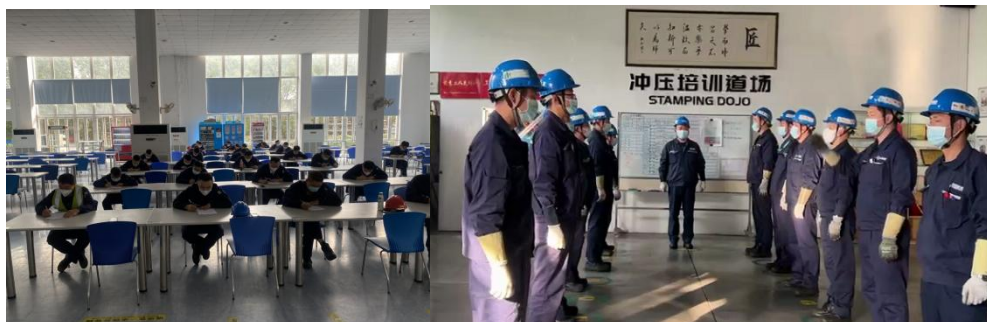
图 3-1 长安马自达汽车订单班实训基地建设