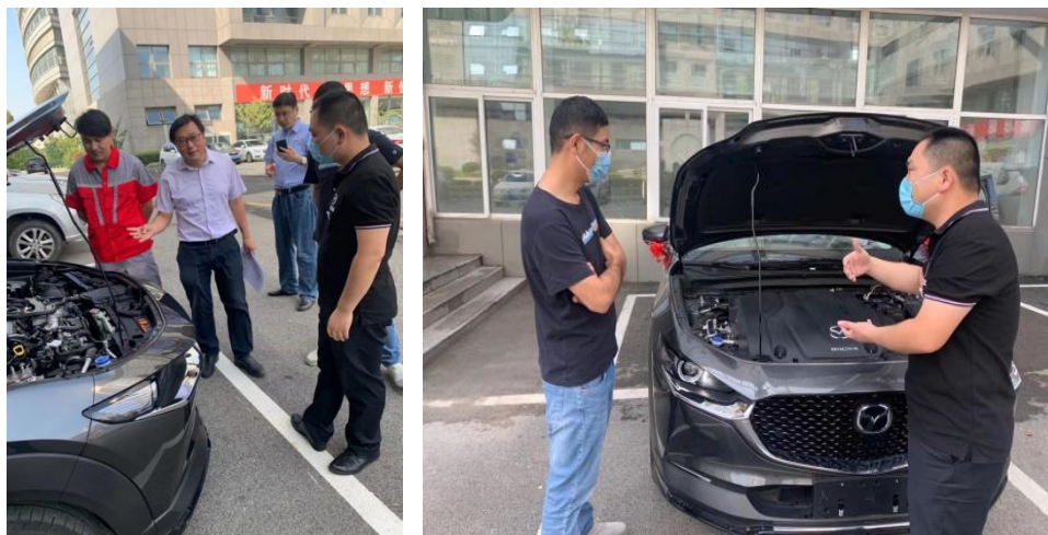
图 4-3 长安马自达汽车捐赠江苏安全技术职业学院实训车辆

充分发挥企业和学校的各自优势，全面深化校企合作，大力推行校企合作、工学结合的人才培养模式，共建实训基地，本年度长安马自达汽车向学校捐赠长安马自达 CX-30 整车 2 台，并计划下一步与学校共同进行实训教室企业文化氛围的布置。