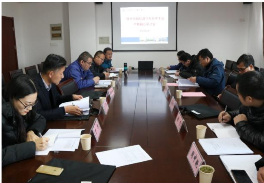
图 4-1 校企合作制定人才培养方案