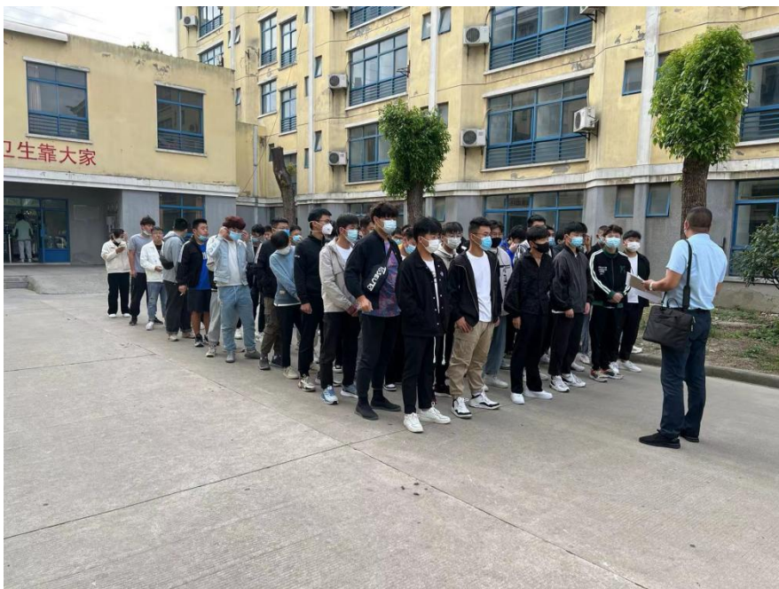
图 4-4 学校派遣教师赴企业进行学生管理

学生实习期，学校还专门派遣教师到企业进行跟岗管理，学生实习工作稳定率高，毕业后留企就业学生比例较高，较好的支持了企业的生产建设。