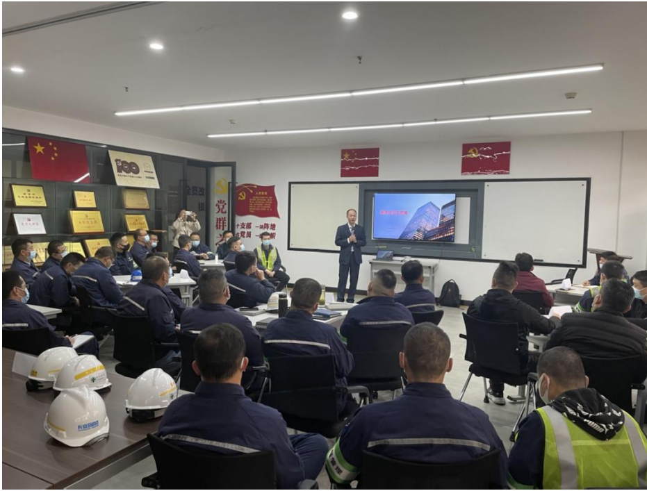
图 2-2 长安马自达汽车企业岗位技能培训