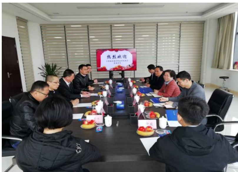
学院领导赴南京安元科技有限公司调研交流

南京安元科技有限公司是安全产业的龙头企业，在行业内具有较强的影响力，近年来公司业务蓬勃发展，连续 4 年保持安全软件市场占有率第一，快速发展的业务规模需要与之相适应的人才梯队支撑，江苏安全技术职业学院是华东地区唯一的一所安全职业技术学院，在安全人才培养方面具有鲜明特点，双方强强联合，有利于双方共同发挥各自优势，实现更高层次的发展。