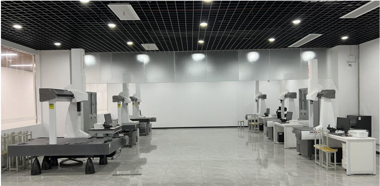
图5 精密检测实训中心实景