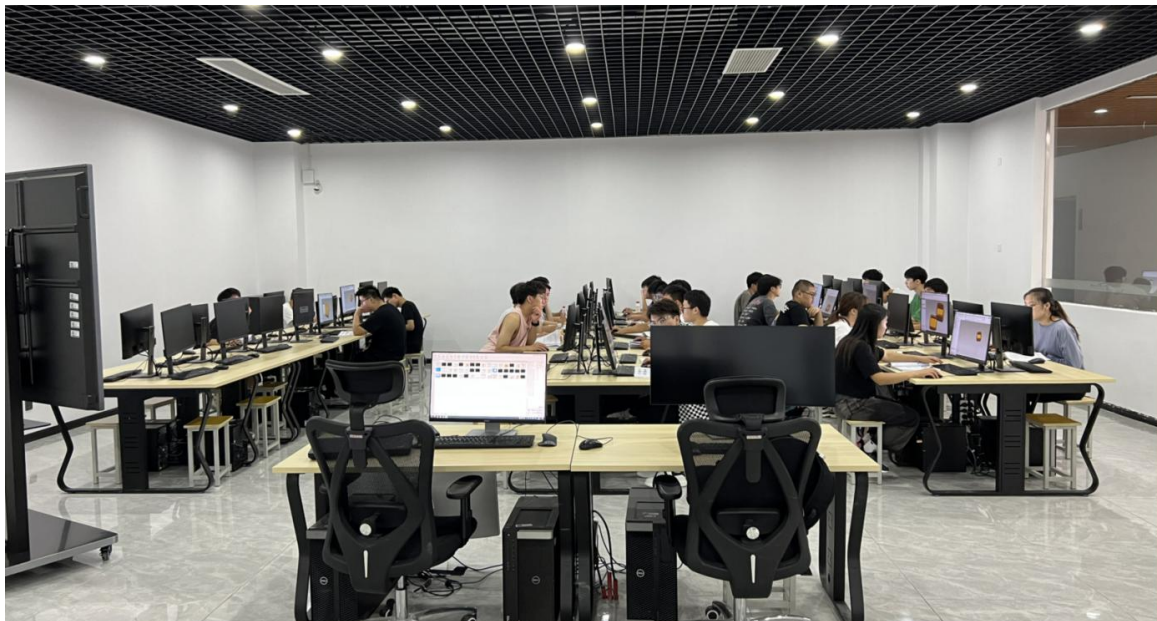
图 2 精密检测虚拟仿真实训中心

探索共建共享“技术领先、形式新颖、可操作性好、方便实用”的检测虚拟仿真实训资源。提升企业的客户培训和学校教学效果。对接 1+X 证书制度、学分银行等相关改革试点任务，探究课证融通机制，实训基地积极有机结合 1+X 证书制度推行试点路径，同时围绕机械检测领域的用工需求和企业员工的特点，开展课程、教材、案例编制，以虚拟仿真平台建设为契机，不断完善和更新现有课程和案例，实现人才培养供给侧和产业需求侧完美对接。现已完成虚拟仿真教学中心机房的建设、企业虚拟仿真软件的捐赠和安装、校本讲义的编写。下一步将积极探索将校本讲义改版，开发项目化的工作手册式、校企共用、公开出版的教材。