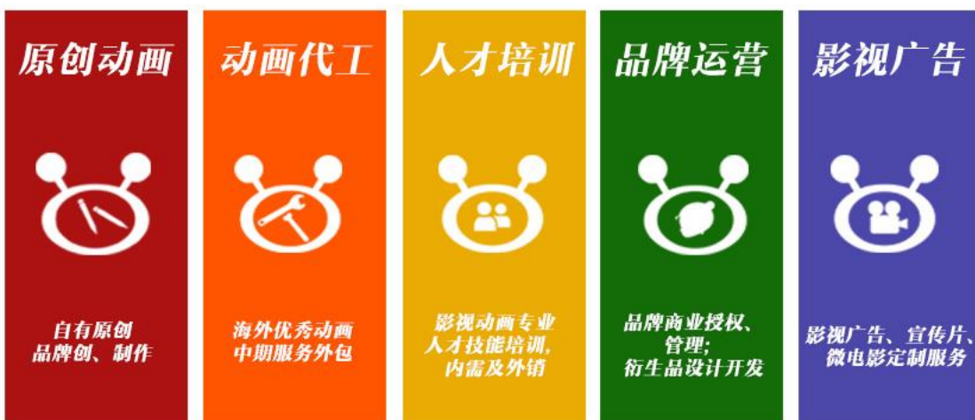
图 1 “飞侗动漫”涉及制作范围

飞侗有这样一句话“没有最好只有更好，没有差不多只有差多少”，充分诠释了对品质与服务的不懈追求。未来还需通过自身不断努力及提高，打造出“飞侗动漫”品牌。