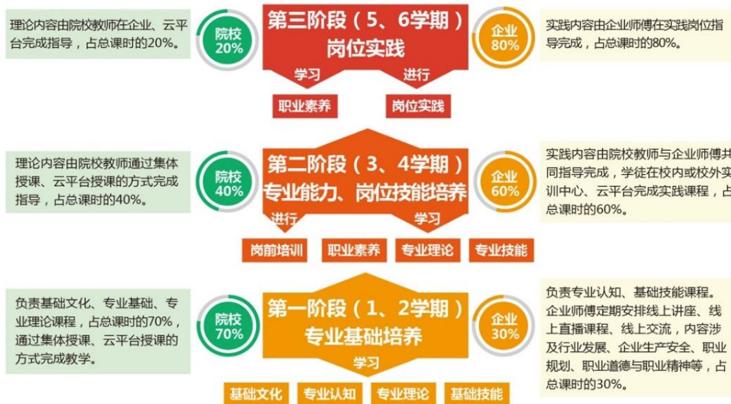
图 5 常州信息职业技术学院动漫制作技术专业课程体系