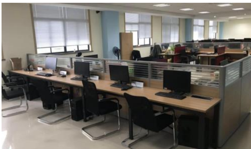
图4 校企联合实训基地