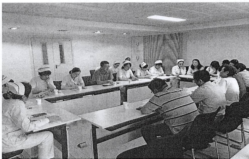
图1 南京市中西医结合医院护理部专家指导工作

医院定期邀请护理学者、行业专家来学院进行专业建设指导，开展专业研讨等活动，开阔了师生眼界，并成立了专业建设指导委员会和专业教学指导委员会。