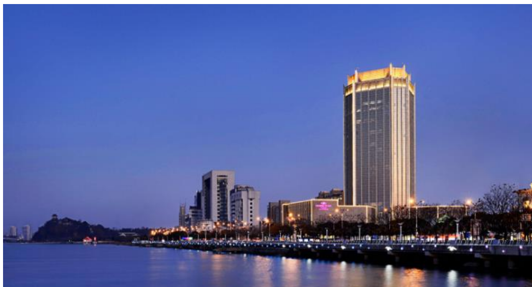
图 1：镇江兆和皇冠假日酒店外观图

镇江强凌酒店有限公司兆和皇冠假日酒店（以下简称“镇江兆和皇冠假日酒店”）是一家由洲际酒店集团管理的豪华商务酒店，2011 年成立，拥有 306 间可俯瞰美丽景致的宽敞客房，其中 144 间可观赏到波澜壮阔的长江美景。酒店还配备了 2000 平方米的会议场所，拥有 7 间多功能会议室包括容纳 900 人的无柱式大宴会厅，所有会议室均配备了先进的视听系统、多媒体投影及高速互联网连接是商务办公和休闲度假的首选。