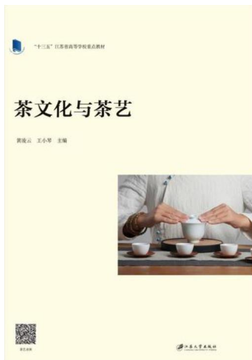
图 4：“十四五”江苏省规划教材《茶文化与茶艺》