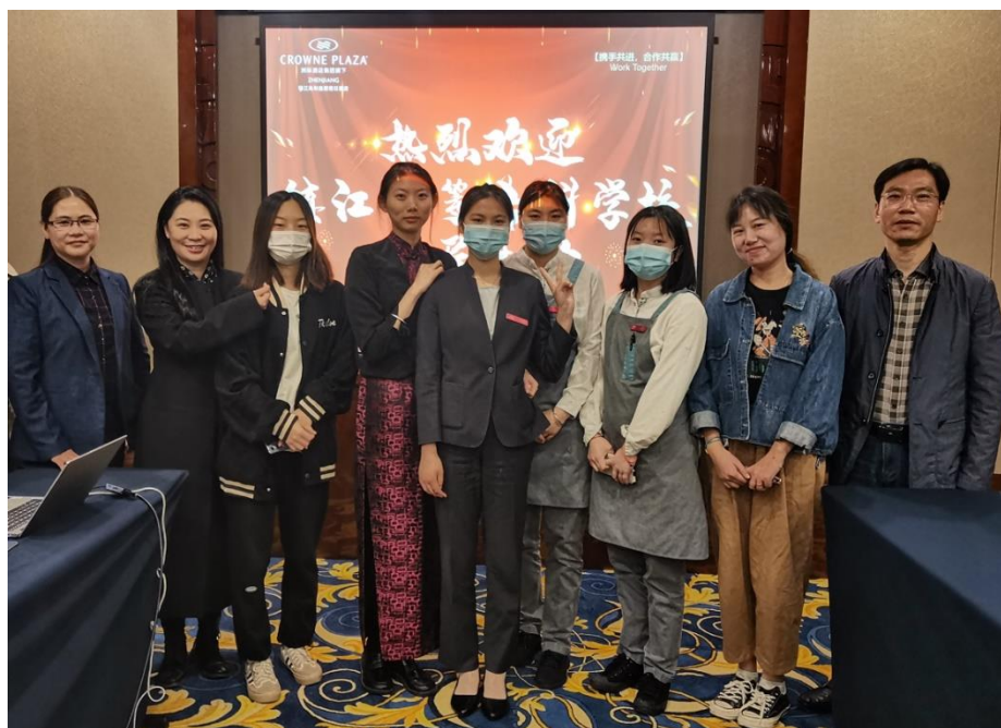
图 8：看望镇江兆和皇冠假日酒店实习生

与镇江兆和皇冠假日酒店及时沟通共享各类信息，征求、采纳行业专家和企业一线人员的意见、建议，例如学生下企业实习前召开实习动员与安全教育会议，将顶岗实习学生纳入学校师生疫情防控范围，企业为学生办理体检、购买人身保险，尽心尽力的保障学生安全，去企业看望实习生，做好学生与企业之间的桥梁。