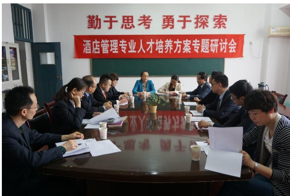
图 2：校企共同召开人才培养方案专题研讨会

为了促进我校旅游专业建设，提升专业办学水平，使教学内容与行业发展实际水平更接近，镇江兆和皇冠假日酒店充分发挥企业资源、技术和人才的优势，推荐资深行业专家作为我校专业指导委员会成员，参与我校旅游酒店专业人才培养方案的编制工作，并签订相关合作协议。与我院定期开展酒店文化进校园等系列活动，聘请专家进行专业知识和技能指导，将企业文化融入到专业课程教学中，校企双方就人才培养定位、课程体系优化、学生顶岗实习、学生技能比赛、教师下企业锻炼等进行了深入的探讨，企业专家对酒店专业人才培养方案提出了诸多建设性意见和建议，达成了校企深度合作、共同服务区域经济发展的共识。