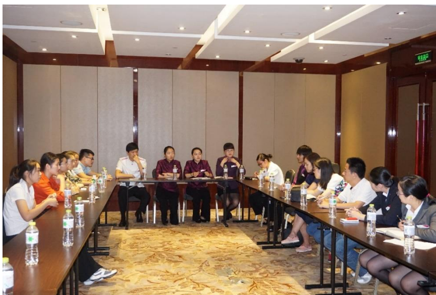
图 5：镇江兆和皇冠假日酒店顶岗实习生座谈会

为配合我校旅游类专业的“校企互嵌 工学结合 旺进淡出”人才培养模式的实施，洲际集团有限公司为学生的“识岗”-“跟岗”-“顶岗”全过程介入，提供实习实训平台和实习岗位，全方位参与指导学生专业知识和专业技能的培养。