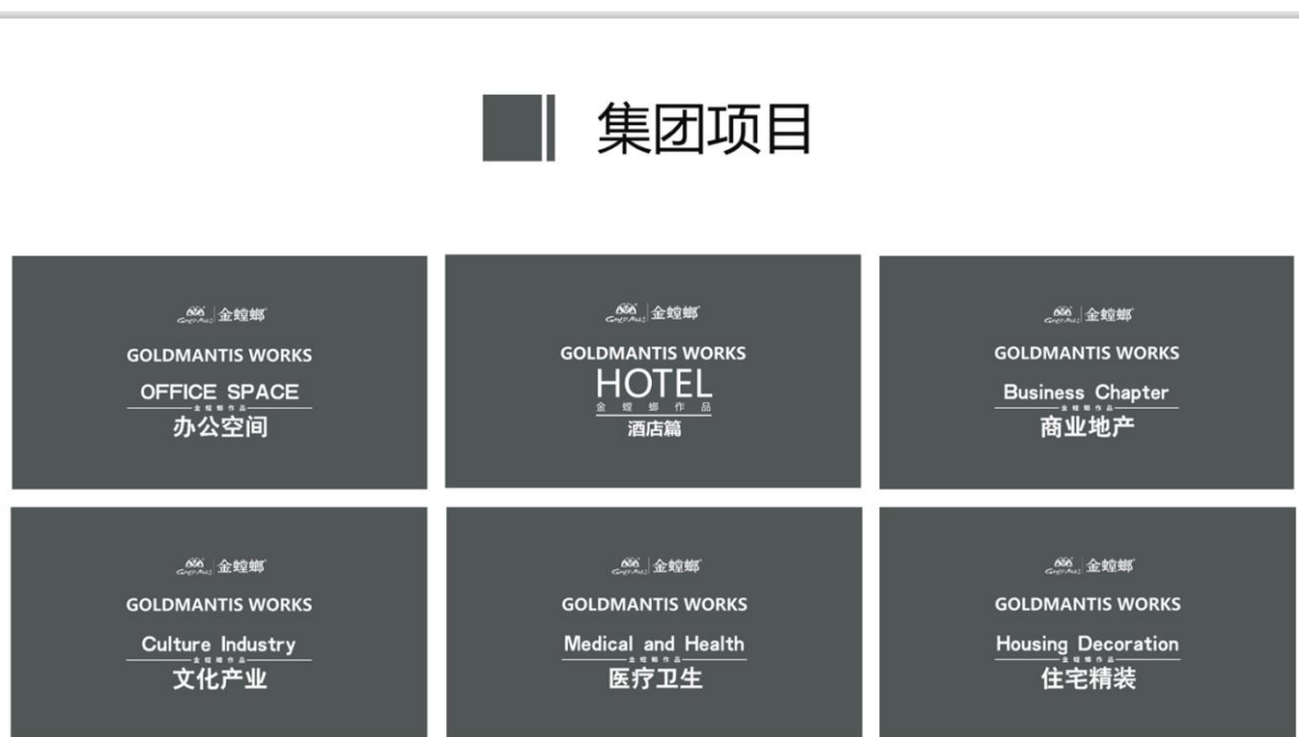
图 1 集团项目