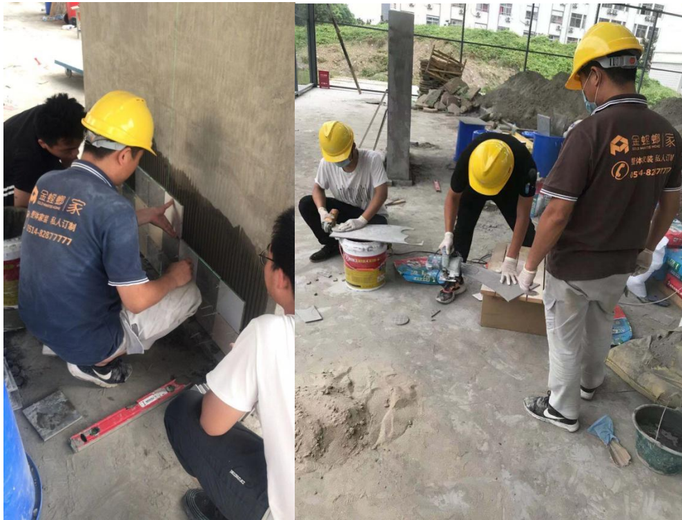
图 10 金螳螂为参赛学生提供技术支持和专业培训