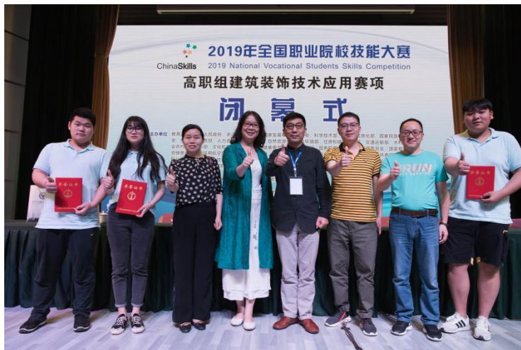
图5 学生参加全国职业院校技能大赛建筑装饰技术应用赛项