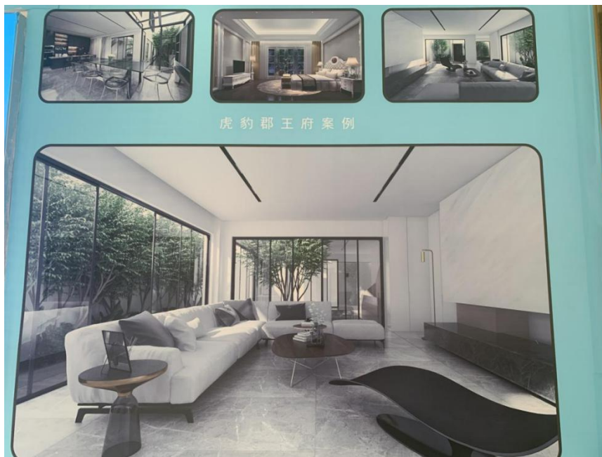
图2 虎豹郡王府案例