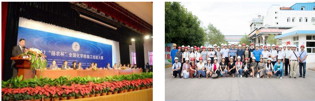
图6 扬农集团协办技能大赛和会议

2009年、2011年，连续两届全国化学检验工技能大赛在扬工院举办，扬农集团作为大赛唯一冠名赞助单位协助校方出色地完成了承办任务，办赛成效得到了赛组委会充分认可。扬农集团和扬工院分别获得最佳支持奖和突出贡献奖。