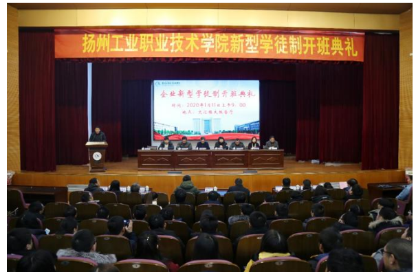
图 12 扬州市企业新型学徒制试点开班仪式