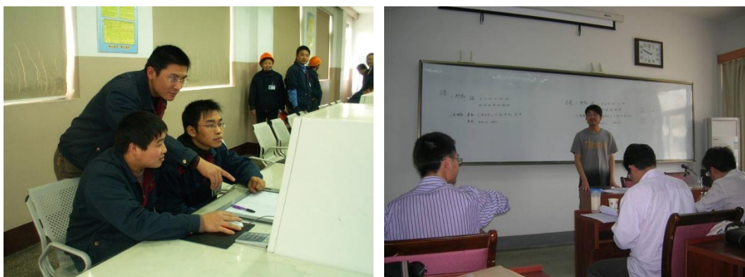
图4 公司某分厂厂长在现场指导学生顶岗实习和论文答辩

除了参与扬工院专业建设的顶层设计外，扬农集团每年还安排各部门技术骨干 10 多人作为校方的兼职教师，重点负责学生实践性教学环节的指导与考核，如指导学生工厂实习、顶岗实习、毕业论文等。