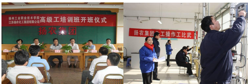
图 9 合作开展扬农集团职工培训和技能比武

为进一步提高企业一线职工，特别是青年职工的化工专业理论知识和化工生产基本操作技能，扬农集团公司每年都积极举办职工专业技能培训、技能比武和职业技能鉴定，以此来加强生产一线高素质技能人才培养。在这一过程中，如何有效利用学院与企业共同优质资源(师资、教学及实验实训资源)也是扬农公司的积极举措。累计已举办了多期扬农职工培训班，培训人数达 230 多人，承接了多次职工比武培训与比赛，承接了近 300 名职工的职业技能鉴定等。