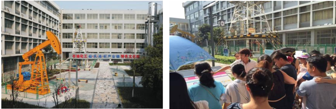
图5 企校共建的石油化工专业文化园

2015年，扬农集团投入资金100余万元在扬工院校园内建立“石油化工特色文化园”，将“绿色、安全、高效”的理念与行为落实到人才培养的全过程，全面提升了学生的职业素养。