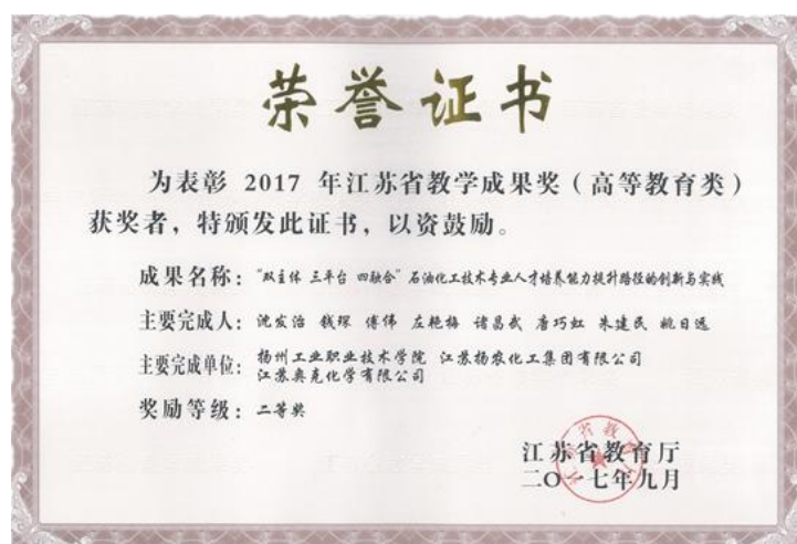
图 10 校企协同育人工作获江苏省教学成果奖

自组建以来，“扬农化工学院”共为扬农集团举办了 9 期职工培训班，培训人员达 371 人次；组建了 5 届扬农订单班，为企业定向培养了 106 名优秀毕业生；企业每年为 200 名左右的本专业学生提供实训和顶岗实习。2017 年，由校企双方经过多年实践探索并总结的“‘双主体 三平台 四融合’石油化工技术专业人才培养能力提升路径的创新与实践”获江苏省教学成果奖二等奖。