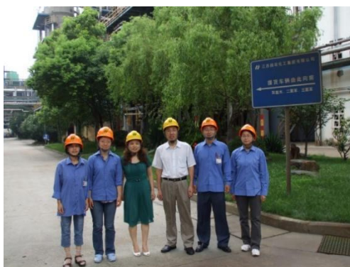
图 8 专任教师在扬农公司参加访问工程师实践