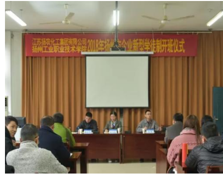
图 11 扬州市企业新型学徒制试点开班仪式

2019年10月继续与扬农集团承担了扬州市企业新型学徒制工作，培养新型学徒45人，2018年及2019年两年共同培养新型学徒95人，极大提高了新型学徒岗位工作所需的专业技术能力、岗位创新精神及技术技能。2020年新型学徒制验收合格，共为企业培养新型学徒45人，全部取得化工总控工中级工证书。