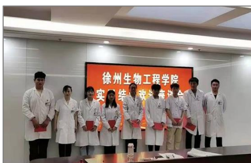
图10 医院为优秀实习生颁奖

为加深学生对专业的理解，拓宽视野，临床课程中安排学生去医院参观学习，了解行业现状，切身感受医务人员的工作状态、工作内容、职责和要求，增强职业认同感，坚定从事临床服务工作的信心和决心。作为同处新沂市的“邻居”，新沂市中医医院首先向我校敞开了大门，经过面试、操作考核等环节，接受了农村医学专业、护理专业、康复治疗技术累计 682 名实习生，并高度重视实习生的培养。安排经验丰富的带教老师，组织优秀实习生评比、实习生知识竞赛等形式多样的活动促进实习生进步。