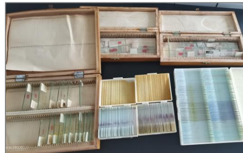
图7 医院捐赠的病理标本