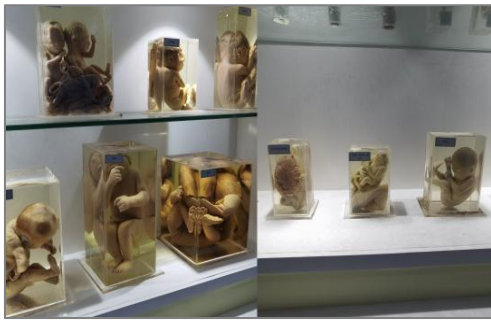
图6 医院捐赠的大体标本

为更好培养现代学徒制学生，更好的提升实践教学水平，解决新沂分院实训中心缺乏人体标本的问题，新沂市中医医院向新沂分院实训中心先后赠送了第三批病理标本，包含大体标本和病理切片，这份难得的资源为学生对于人体病理的认知提供了充分的物力保障。