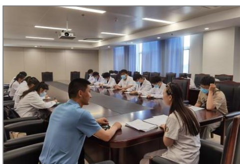
图8 院校专业建设研讨会