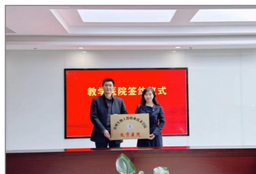
图 3 教学医院签约仪式