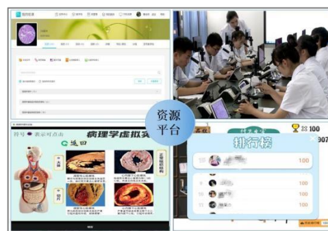
图9 院校共建教学资源库