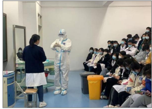
图5 校内疫情实用技术培训