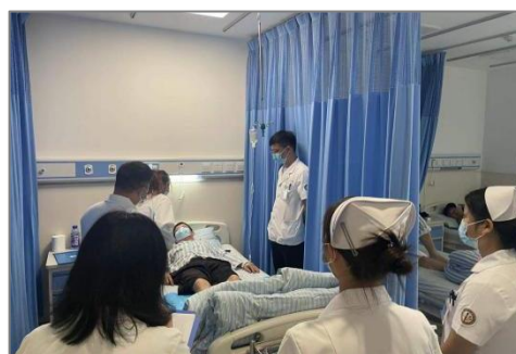
图11 医院内实习教学