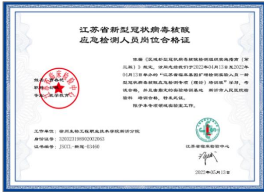
图4 教师获得核酸检测岗位合格证书