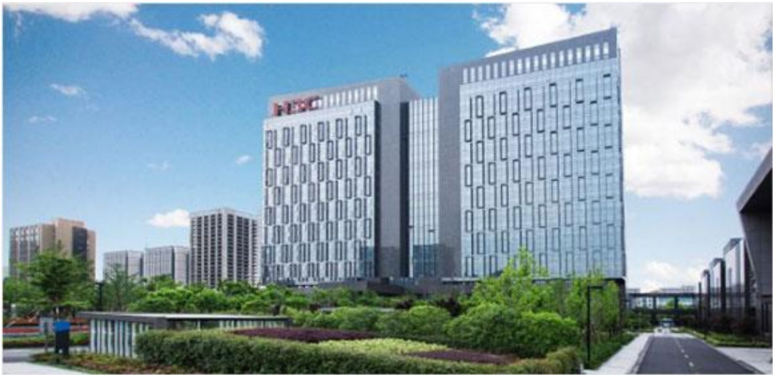
图 1 新华三技术有限公司杭州总部

“新华三”将整合优势，进一步开拓中国市场和全球业务，成为数字化解决方案的领导者。新华三也将受益于紫光和清华的多元资源、资金实力与科研优势。我们将以三十年深耕教育培训领域的品牌积淀，结合清华大学、紫光集团在人才、教育、资金、社会资源等方面的优势以及打造全产业链的能力，迎来巨大的机遇和更加广阔的发展空间。