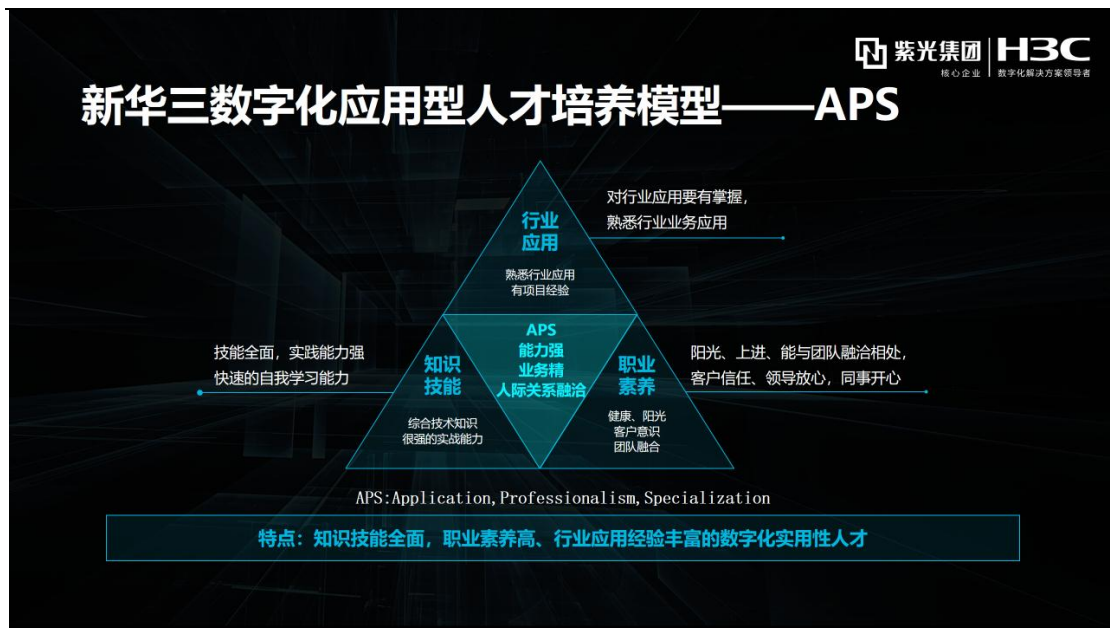
图 2 人才核心能力培养模型