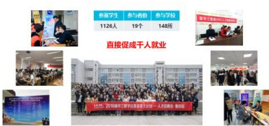
图 8 部分省份招聘会现场