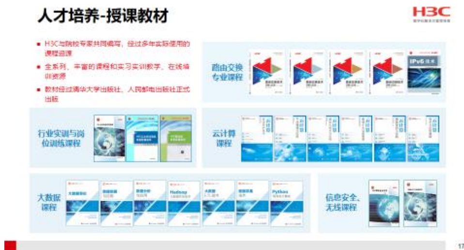
图 3 H3C 课程体系