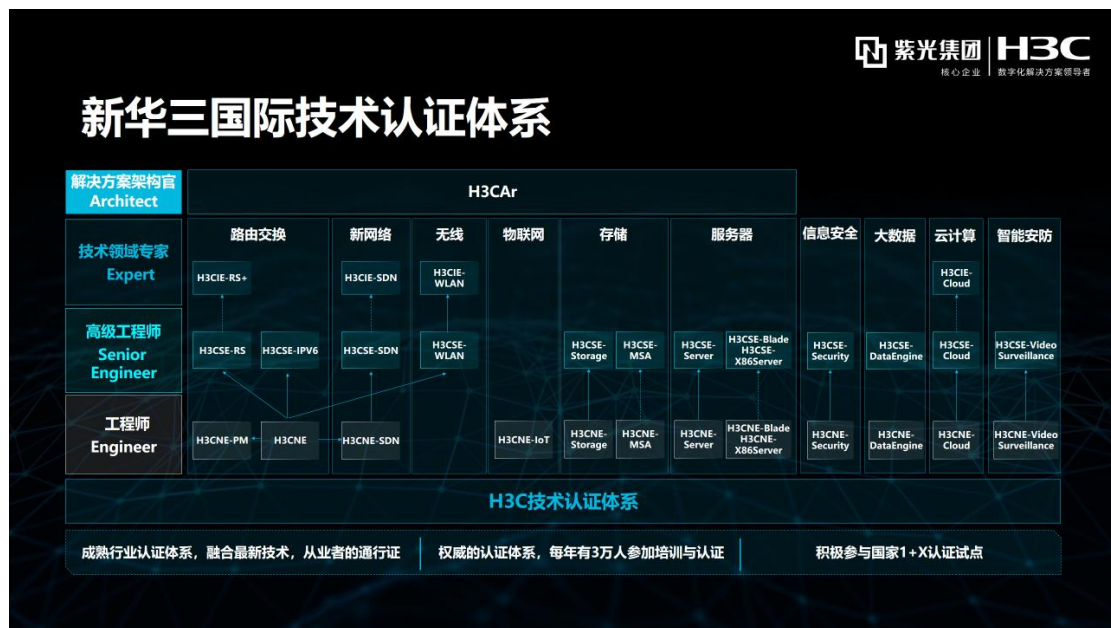
图 4 H3C 认证体系

H3C 认证是国内第一家建立国际规范的网络技术认证体系，也是中国第一个走向国际市场的 IT 厂商认证，认证证书在行业内具有很高的技术含量，现已成为当前权威的 IT 认证品牌之一，能有效证明证书拥有者所具备的网络技术知识和实践技能，帮助其在竞争激烈的职业生涯中保持强有力的竞争实力。对于所有参加 H3C 网络学院课程学习的学生，均可以申请考试优惠券，以优惠价格参加 H3C 认证考试，考试通过，即可获得国际权威的 IT 认证证书，拓宽职业发展空间。