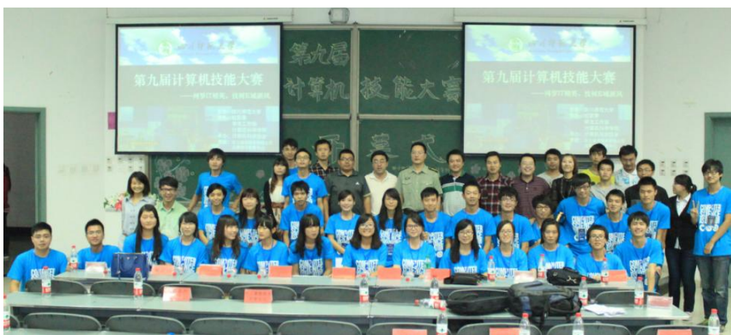
图11 网络院校内技能大赛

除新华三杯大赛支持政策外，H3C对网络学院举办的校园计算机网络技能大赛也同样给予大力支持。