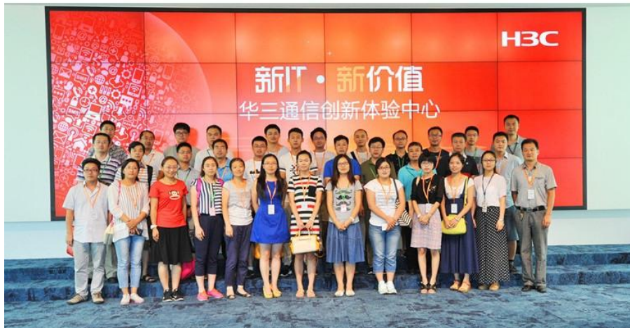
图 5 讲师培训合影