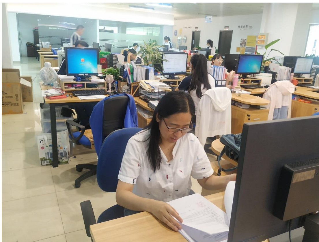
图3 访问工程师进企业学习