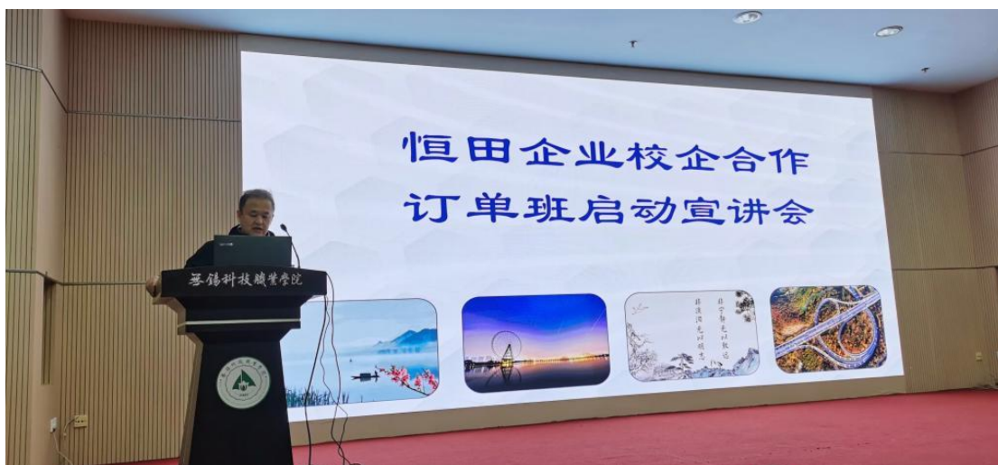
图 4 校企共建恒田企业订单班启动宣讲会