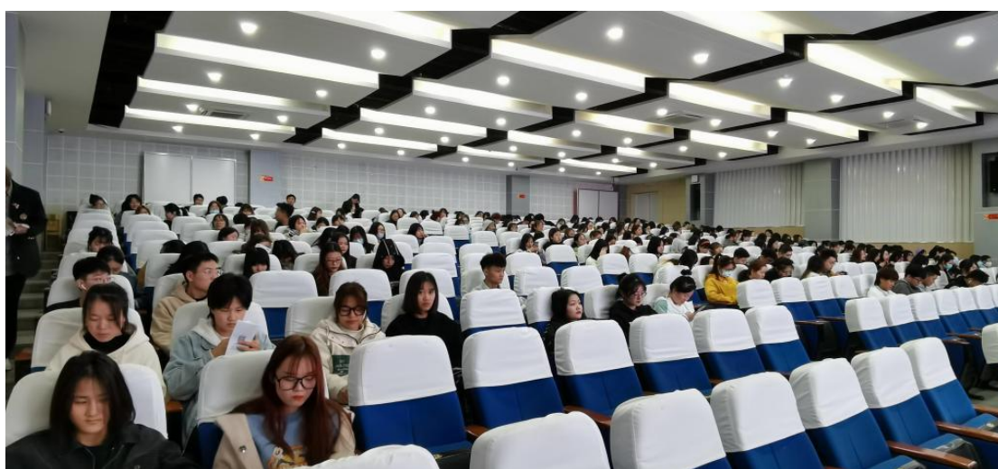
图 5 学生参与校企共建订单班