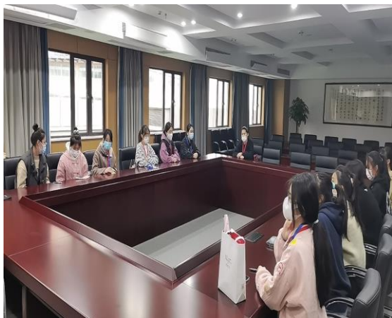
图 14 师范生进入幼儿园开展实践