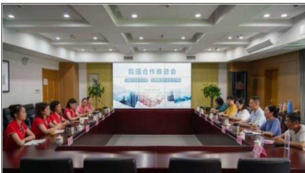
图 4 推进院园共同体建设洽谈会

为进一步加强我校与实幼的联系，充分发挥师范学院百年师范教育的优势，做好教学、科研、培训一体化合作工作，进一步提高教育教学质量，培养更多的优秀师范毕业生，为我校毕业生开拓更多的就业岗位和实习机会，我校与实幼建立了长期的院—园合作关系。