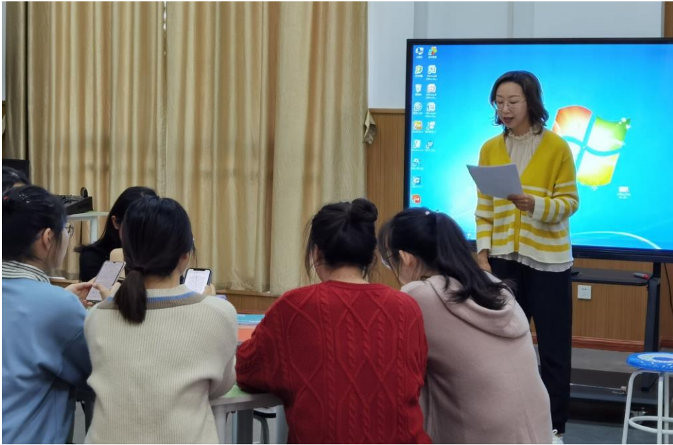
图9 实幼优优老师指导学生讲故事