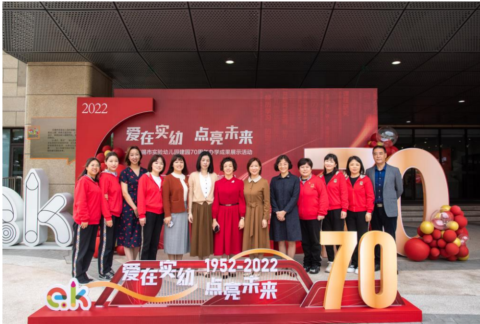
图1 无锡市实验幼儿园管理团队