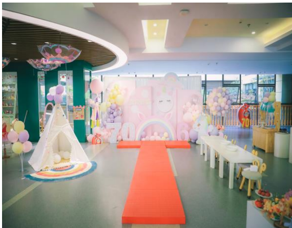
图2 无锡市实验幼儿园门厅