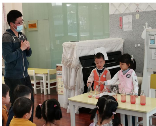
图 15 师范学生在实幼参与实践教学