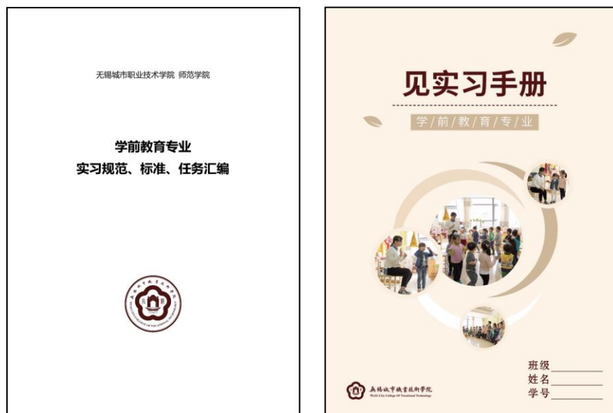
图 13 学前教育专业实习规范、标准、任务汇编以及见习手册

导中点拨理论应用，形成“教学做”合一的良性循环。无锡市实验幼儿园还把《幼儿故事讲述与表演》课程的教学评价放到了幼儿园，组织学前教育专业的学生面向幼儿开展讲故事比赛，院园双方共同评审，协同育人。