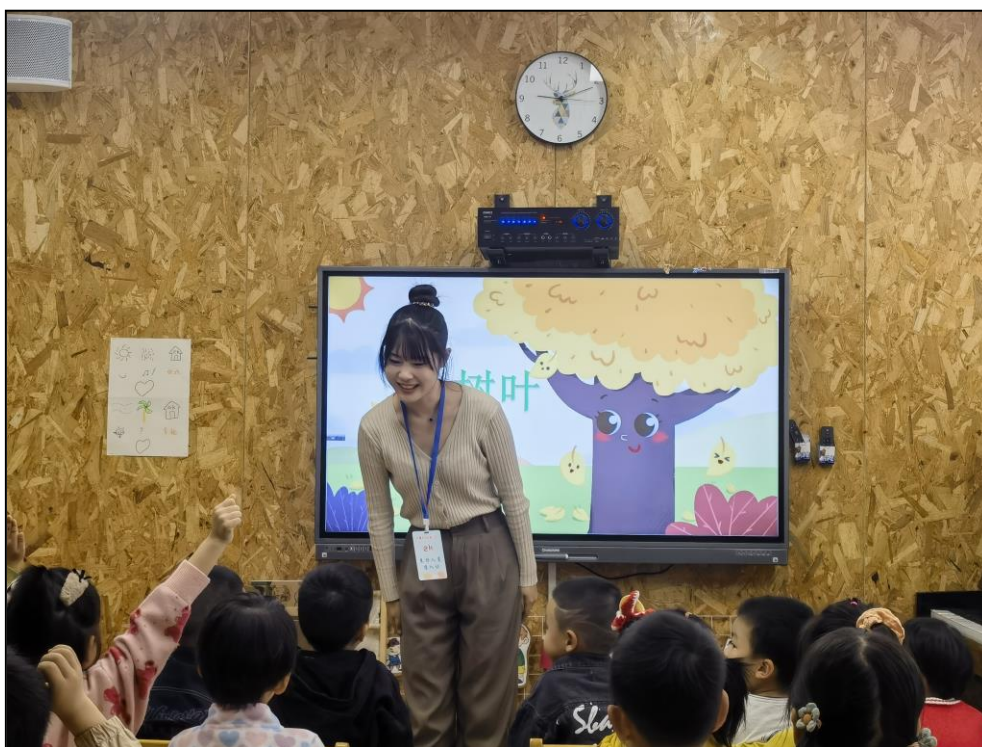
图6 实习生教学展示

实幼与师范学院将基于共同的愿景，在教育教学、课程开发、学术研究和教师培训等多领域开展深度合作，智慧共享，互利共赢，进一步推进学前教育专业建设，打造学前教育优质品牌。