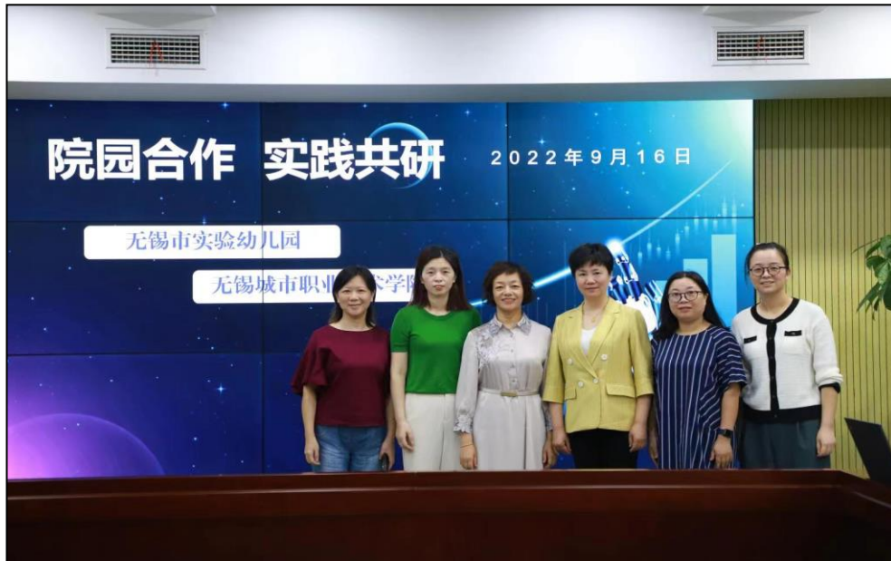
图7 师范学院走进无锡市实验幼儿园开展实践