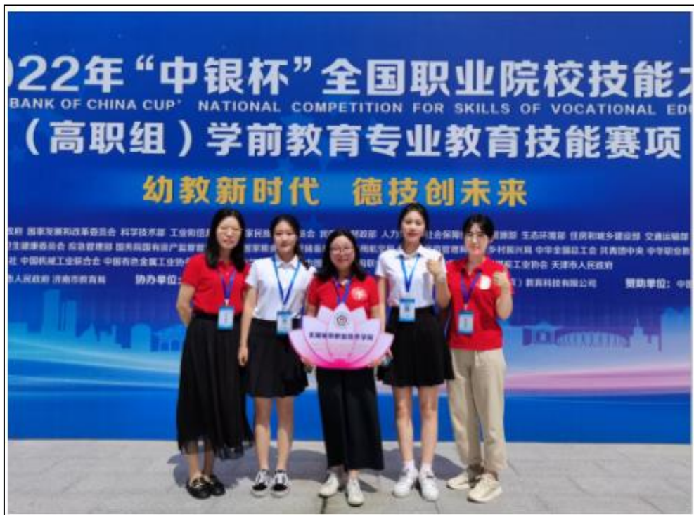
图 17 我校学子喜获 2022 年全国职业院校技能大赛学前教育专业团体二等奖