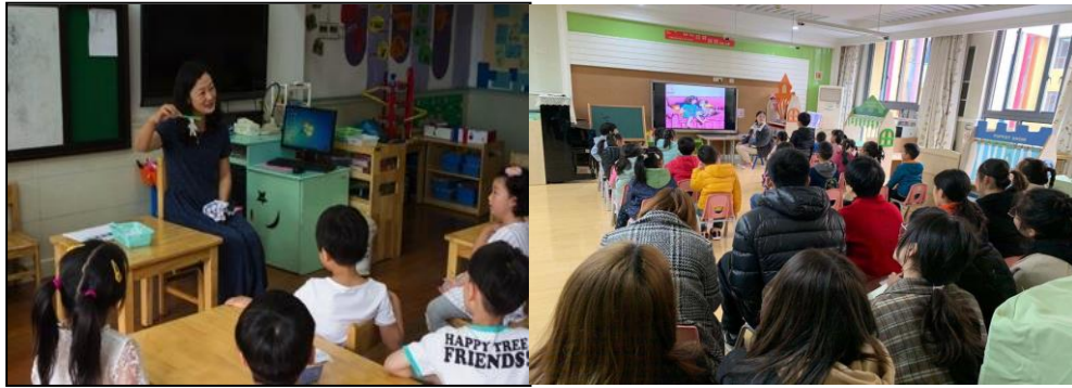
图 16 师范学院教师在幼儿园组织科学活动和园集体研讨