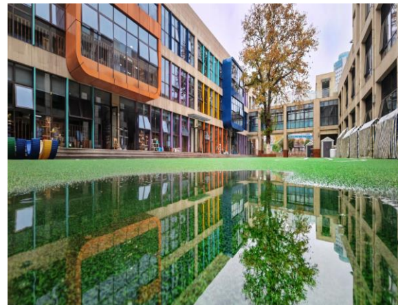
图3 无锡市实验幼儿园景色