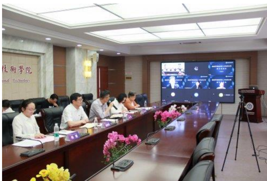
图 4 2022 级旅游专业群人才培养方案专家在线论证会

为促进职业教育和产业人才需求精准对接，提升旅游专业群高水平内涵建设，旅游学院召开了 2022 级旅游专业群人才培养方案在线专家论证会。包括三角洲公司在内的行业企业专家在线参会。为贯彻落实新职业教育法精神，培养更多高素质技术技能人才，企业专家对专业人才培养方案进行研究、论证，确认专业人才培养方案的合理性，对会展 3+2 专本贯通课程体系提出可行性建议。根据行业新技术、新工艺要求，增加课程数字化教学内容，同时针对企业对会展人才实践技能的高要求，明确夯实会展实践教学，加大课程实训、跟岗实习、顶岗实习等实践课程的比重。以立德树人为根本任务，在实践中培育和传承工匠精神，引导学生养成严谨专注、敬业专业、精益求精和追求卓越的品质，提升会展学生职业素养。