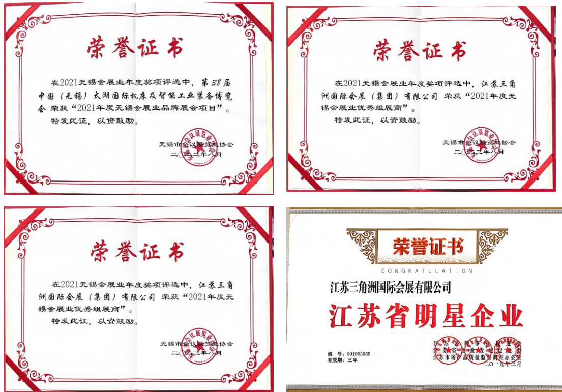
图 6 服务地方发展 2022 年度江苏三角洲会展公司获评荣誉