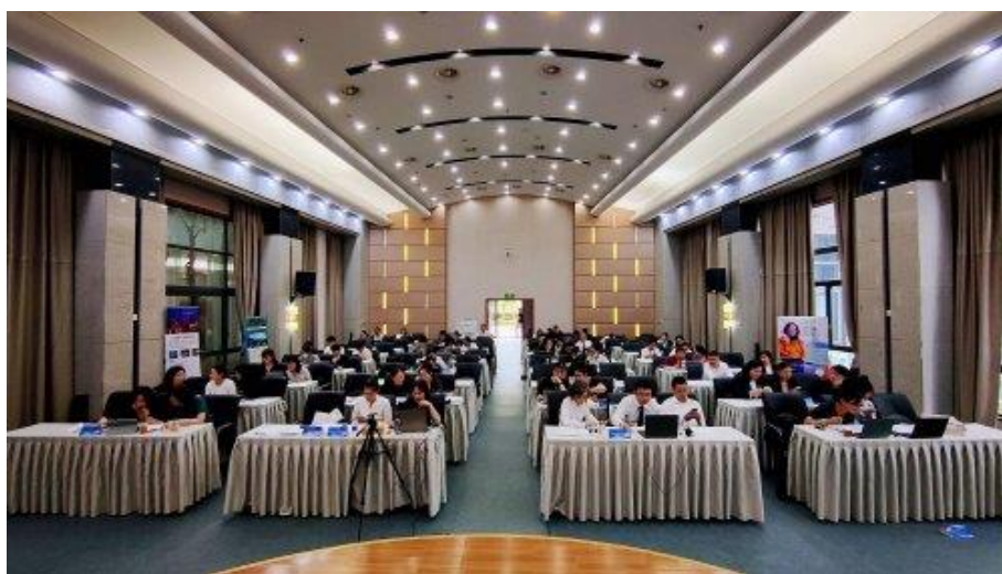
图5 2022年专业学生在线实习双选会

2022年，19级有4位学生既完成4个月的跟岗实习之后，继续在三角洲会展公司开展为2个月的顶岗实习，学校和企业均派导师全过程进行管理。学生实际履行岗位职责，参与三角洲会展公司国际机械展的项目筹备，学习到了会展项目的管理技术、服务规范、标准流程、宣传经验，培养了团队合作精神、协调能力和抗压能力，实现了专业能力、社会能力、方法能力以及综合职业能力的培养。