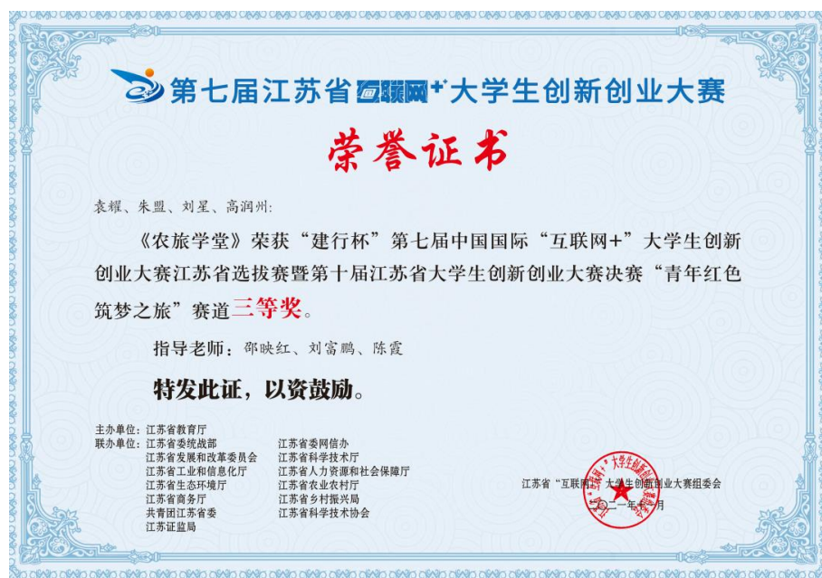
图3 实习学生获得江苏省大学生创新创业大赛三等奖