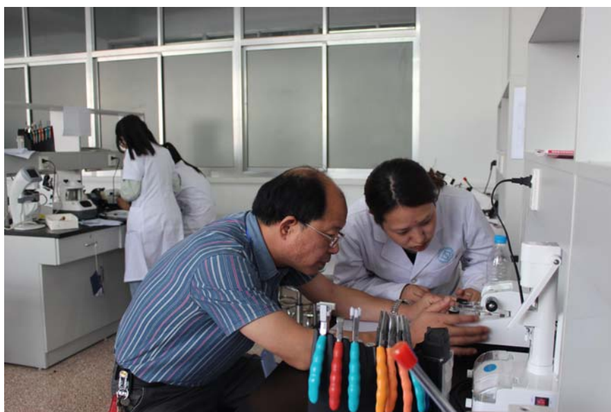
图3 学生在验光配镜职业技能鉴定中心考证

眼视光医院将承担医疗服务的医院与承担人才培养的系部合二为一，医院在优化整合教育资源和行业资源方面，发挥出了两者“命运共同体”的合作与联合优势，在教学、科研、产品研发、师资培养、社会服务等方面的多功能效用，为全面深化校企合作，为校院、医教一体化眼视光人才培养机制进行了有效的探索与实践。