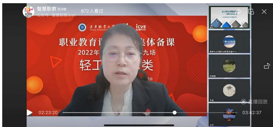
图 16 教师参加全国职业院校轻工纺织大类课程思政集体备课会

骨干教师通过深入行业企业实践、合作开展科研，具备先进的职业教育理念，并积累了更多的实践和教学经验，主讲专业优质核心课程、独立指导核心课程实