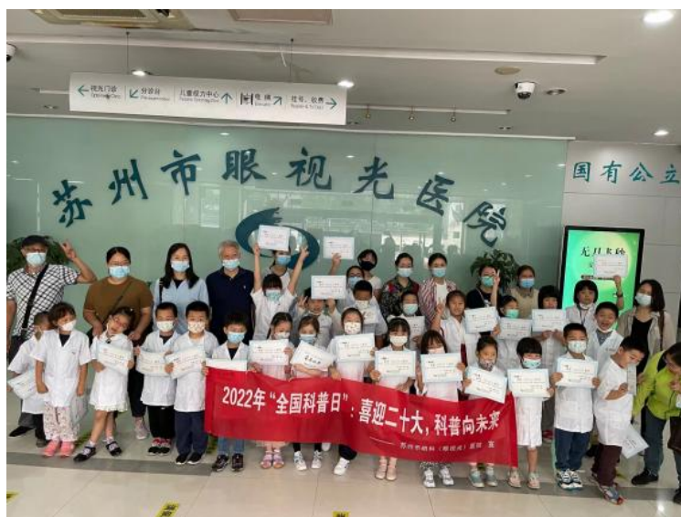
图 12 附属眼视光医院开展“开学第一课《小小眼科医生》”体验活动

依托苏州市中小学生职业体验中心（眼视光职业体验中心）开展了“开学第一课《小小眼科医生》”系列体验活动，小朋友们通过现场参观眼科医院的工作环境、亲身体会眼科医生的工作内容等项目，学习了眼科的相关知识，认识到保护眼睛的重要性，养成良好爱眼护眼习惯；家长们通过倾听专业讲座，学习近视防治相关知识，了解近视防控的重要性，帮助青少年预防高度近视的发生。