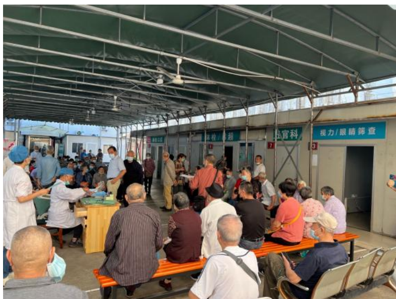
图 13 附属眼视光医院长桥街道退休老人义诊讲座