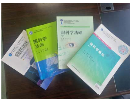
图 15 专业带头人主编教材

科分会主任委员”，“江苏省视觉障碍矫正和康复工程技术研发中心”工程技术研发中心负责人，研发的低视力助视器和弱视训练脑力影像系统，获得了3项国家发明专利，产品已申报国家科技创新产品，近期将投入临床使用。主编的国家卫生与计划生育委员会“十二五”、“十三五”规划教材《眼科学基础》和《眼科学基础学习指导与习题集》由人民卫生出版社出版，在全国高职院校眼视光技术专业使用，该教材2014年被列为江苏省重点教材，目前为眼视光专业第一套“十二五”、“十三五”职业教育国家规划教材。专业带头人受邀参加全国职业院校轻工纺织大类课程思政集体备课会，结合我院“眼视光课程思政”开展的经验和体会，从眼视光技术专业介绍、课程思政开展情况、具体实施措施、存在不足及展望四个方面进行展示交流。