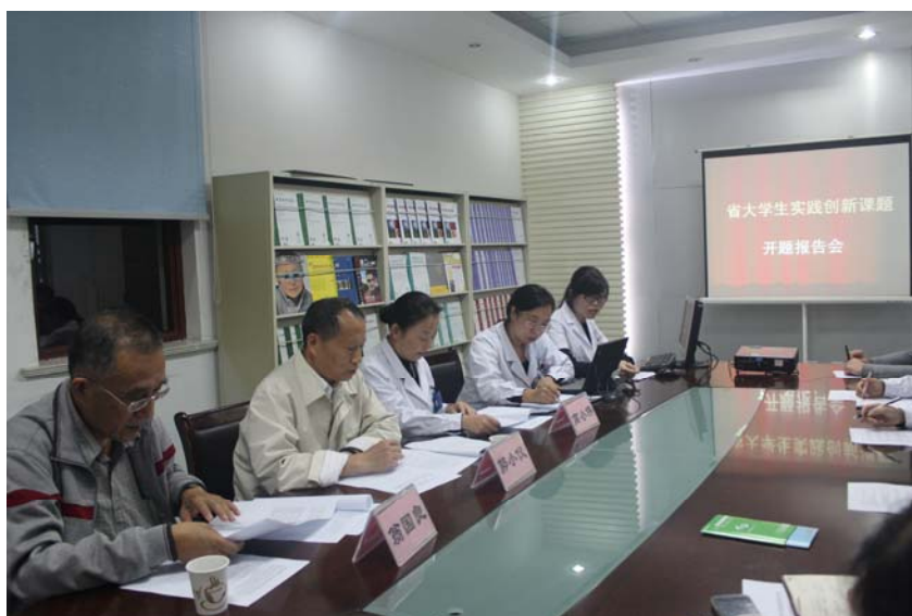
图4 大学生创新实践课题开题

眼视光医院将承担医疗服务的医院与承担人才培养的系部合二为一，医院在优化整合教育资源和行业资源方面，发挥出了两者“命运共同体”的合作与联合优势，在教学、科研、产品研发、师资培养、社会服务等方面的多功能效用，为全面深化校企合作，为校院、医教一体化眼视光人才培养机制进行了有效的探索与实践。