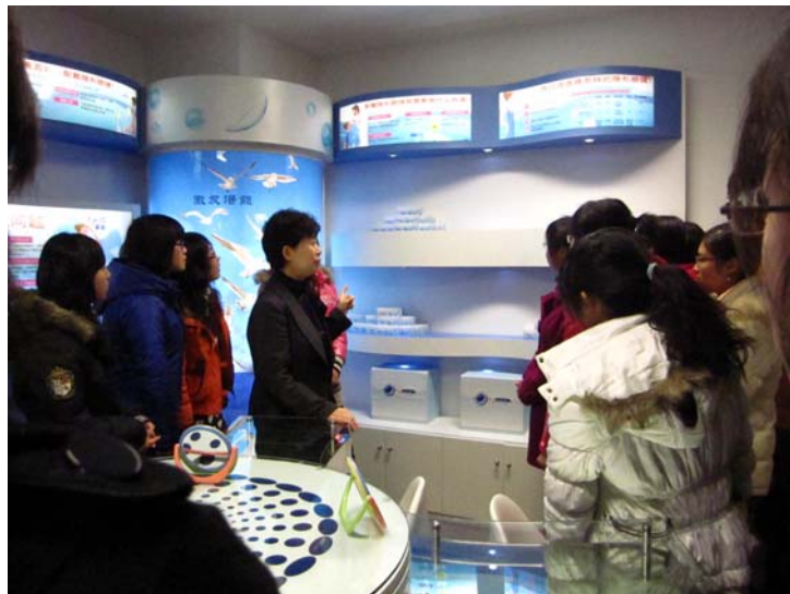
图 2 学生参加“强生视光学苑培训”

附属眼视光医院作为服务性实训基地，同时也为眼视光技术专业构筑起了“双师型”教师的培养基地和产学研一体化的合作平台。通过“校企结对、双岗互聘”，有效地搭建起专职教师与企业骨干沟通联动的平台，在双方合作过程中，企业将行业新知识、新理论及新技术直接引进课堂，企业还为学生提供了《雏鹰启航大学生培养计划》、《强生视光学苑》等一系列培训项目，补充了关于眼镜产品及其销售的培训内容，使学生就业创业的知识体系更加完整。