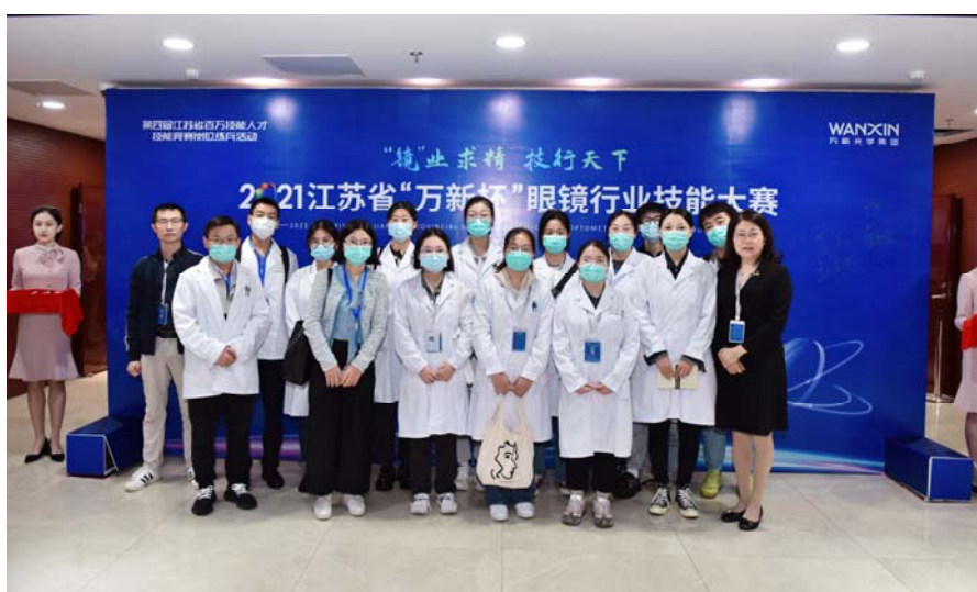
图 5 2021 年江苏省“万新杯”眼镜行业技能大赛参赛团队

能力，技能培养及专业素质更接近当今时代发展前沿。学生在校期间眼镜验光员（中、高级）和眼镜定配工（中、高级）职业技能证书获取率达 100%。专业学生在历届江苏省及全国验光配镜职业技能竞赛中均取得了优异的成绩，获得了个人与团体的眼镜验光与眼镜定配的一、二、三等奖，毕业生在全国第二届验光配镜职业技能竞赛中取得了定配职工组第四名的优异成绩、获得总工会颁发的“全国技术能手”称号。在 2021 年江苏省“万新杯”眼镜行业技能大赛中我系同学获得眼镜验光员（学生组）第一名。