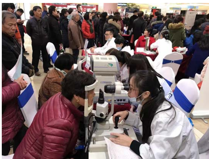
图 9 大学生参加义诊活动