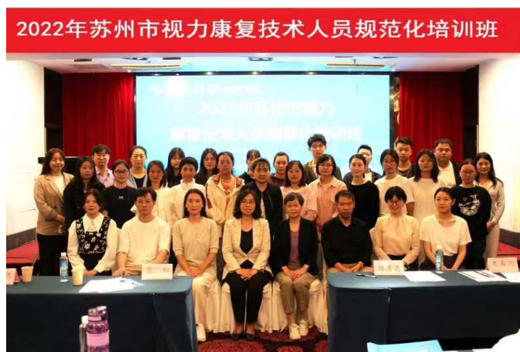
图 11 苏州市视力康复技术人员规范化培训班

2022年9月，附属眼视光医院作为苏州市首家视力残疾康复规培基地，成功承办了苏州市首届“苏州市视力康复技术人员规范化培训班”。为低视力康复技术人员提供了一个共同学习的平台，促进了学员对视力残疾人群现状的认识，提高了康复相关专业人员的理论和实操技能，帮助学员以更好的技术水平和专业认知服务于视力残疾人群。