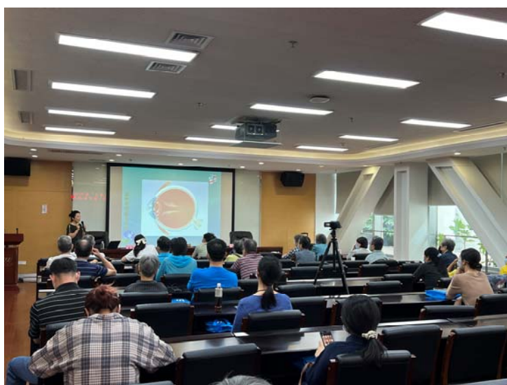
图 14 附属眼视光医院医生“太湖大讲堂”科普讲座