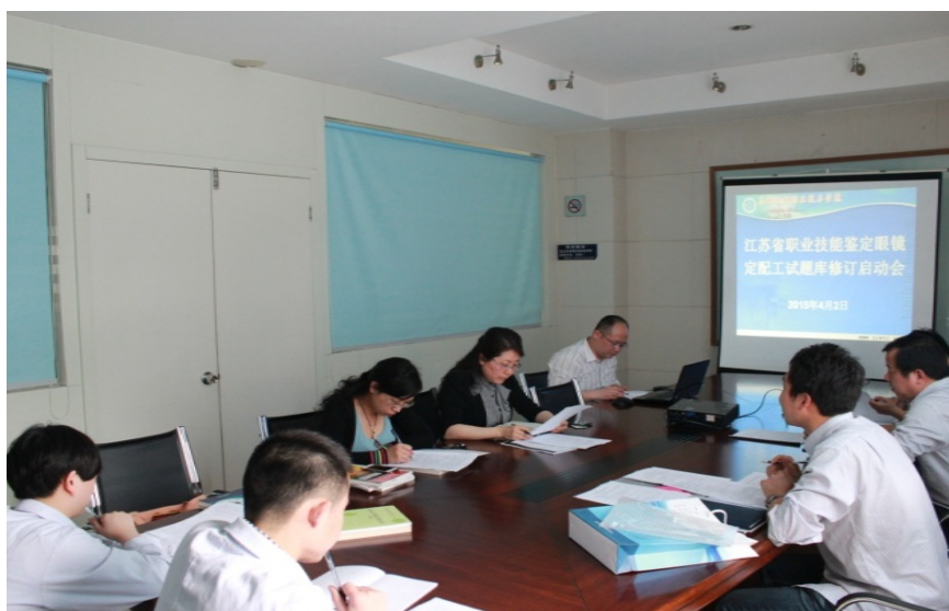
图 7 修订江苏省眼镜验光与定配技师与高级技师鉴定题库

专业教师作为眼镜行业职业技能鉴定考评员，受聘于国家劳动部门定期参加职业技能鉴定考评工作，年均考评 100 余人次，在眼镜行业的鉴定取证工作方面经验丰富，在两届全国性验光与眼镜定配职业技能竞赛中，苏州卫生职业技术学院眼视光技术专业带头人连续两届均担任了裁判员，且为学生组裁判长。2013 年起，眼视光技术专业带头人与骨干教师开始承担江苏省验光配镜技能鉴定技师与高级技师题库的修订工作，2015 年眼视光技术专业教师又在专业带头人的带领下承担了江苏省配镜定配技能鉴定初级到高级（3~5 级）定配工题库的修订工作。通过为眼镜行业技能鉴定、职业准入资格制定标准，充分发挥了学院眼视光专业对眼镜行业的影响力。