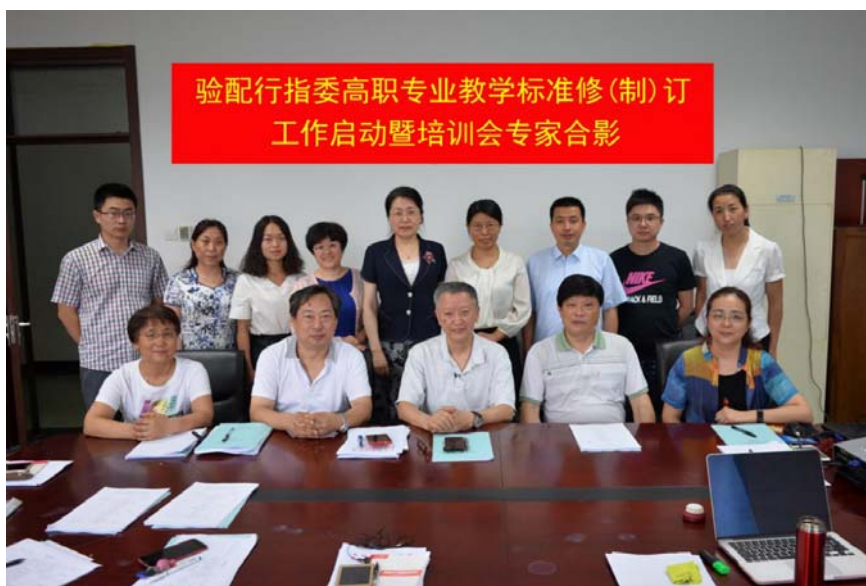
图 6 主持教育部验光配镜教学标准

专业教师作为眼镜行业职业技能鉴定考评员，受聘于国家劳动部门定期参加职业技能鉴定考评工作，年均考评 100 余人次，在眼镜行业的鉴定取证工作方面经验丰富，在两届全国性验光与眼镜定配职业技能竞赛中，苏州卫生职业技术学院眼视光技术专业带头人连续两届均担任了裁判员，且为学生组裁判长。2013 年起，眼视光技术专业带头人与骨干教师开始承担江苏省验光配镜技能鉴定技师与高级技师题库的修订工作，2015 年眼视光技术专业教师又在专业带头人的带领下承担了江苏省配镜定配技能鉴定初级到高级（3~5 级）定配工题库的修订工作。通过为眼镜行业技能鉴定、职业准入资格制定标准，充分发挥了学院眼视光专业对眼镜行业的影响力。