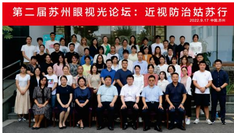
图 10 第二届苏州眼视光“近视防治姑苏行”论坛

2022年9月，附属眼视光医院作为苏州市首家视力残疾康复规培基地，成功承办了苏州市首届“苏州市视力康复技术人员规范化培训班”。为低视力康复技术人员提供了一个共同学习的平台，促进了学员对视力残疾人群现状的认识，提高了康复相关专业人员的理论和实操技能，帮助学员以更好的技术水平和专业认知服务于视力残疾人群。