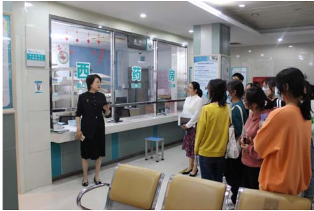
图 1 专业带头人在附属医院开展入学专业教育

附属眼视光医院作为服务性实训基地，同时也为眼视光技术专业构筑起了“双师型”教师的培养基地和产学研一体化的合作平台。通过“校企结对、双岗互聘”，有效地搭建起专职教师与企业骨干沟通联动的平台，在双方合作过程中，企业将行业新知识、新理论及新技术直接引进课堂，企业还为学生提供了《雏鹰启航大学生培养计划》、《强生视光学苑》等一系列培训项目，补充了关于眼镜产品及其销售的培训内容，使学生就业创业的知识体系更加完整。