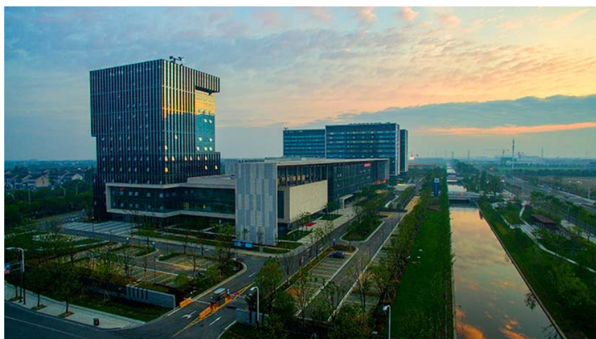
图 2 苏州科技城医院

麻醉科是集临床麻醉、重症监护、疼痛治疗“三位一体”的麻醉学部下属麻醉科，为国家器械临床试验机构认证专业、苏州市临床重点专科。目前开展的业务分为临床麻醉、麻醉门诊、疼痛诊疗三个方面，临床麻醉工作包括病房手术室、门诊手术室、手术室外的麻醉（如无痛胃镜、无痛肠镜、无痛分娩、无痛人流、ERCP、DSA 的血管造影、支架置入等）；麻醉门诊目前开展的诊疗项目包括：术前病人的评估与准备、术后并发症的咨询；疼痛诊疗为颈肩腰腿痛、头痛、癌痛、带状疱疹后遗神经痛及各种软组织痛患者，提供镇痛治疗，效果显著。“超声技术在围术期领域的应用”，为学科带头人王琛教授 2006 年赴美进修回国后率先在省内开展的新技术，包括超声引导下周围神经阻滞、动静脉置管、胸腹腔引流、肺部超声诊断、腹部重要脏器诊断与监测、经食道超声心动图（TEE）、经胸超声心动图（TTE）等，该技术拓展了临床麻醉的工作范畴，极大增强了围术期的安全性与可控性。