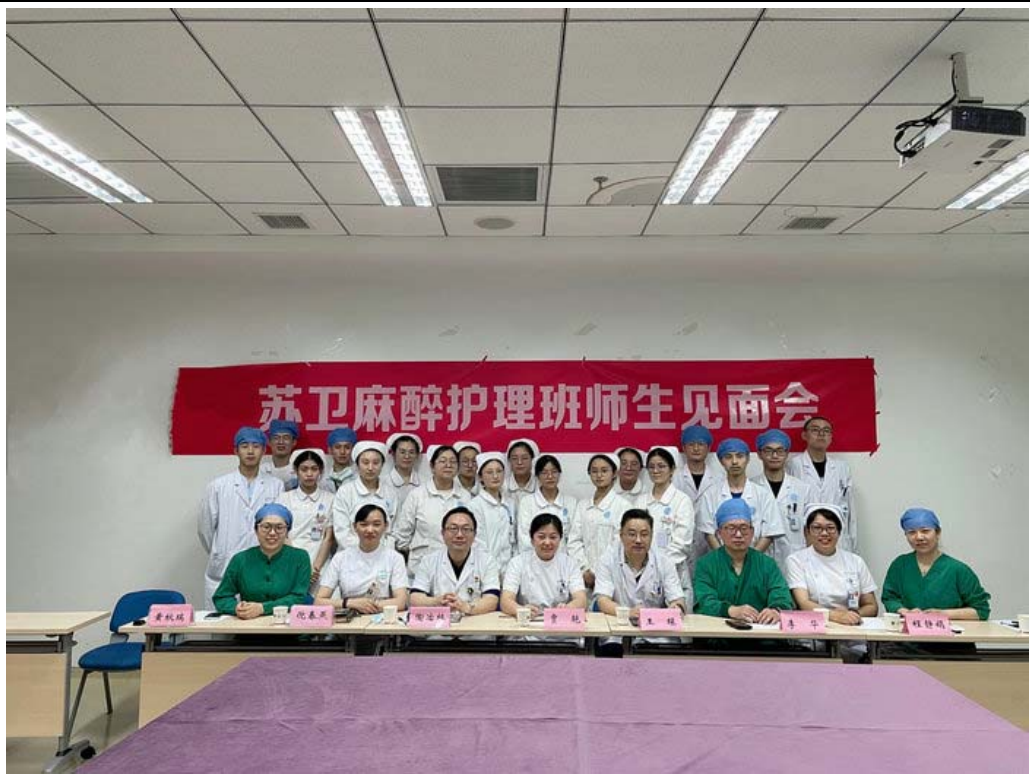
图4 苏卫麻醉护理班师生见面会