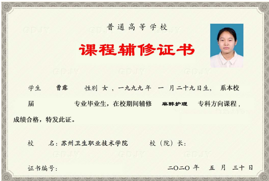
图5 麻醉护理辅修证书