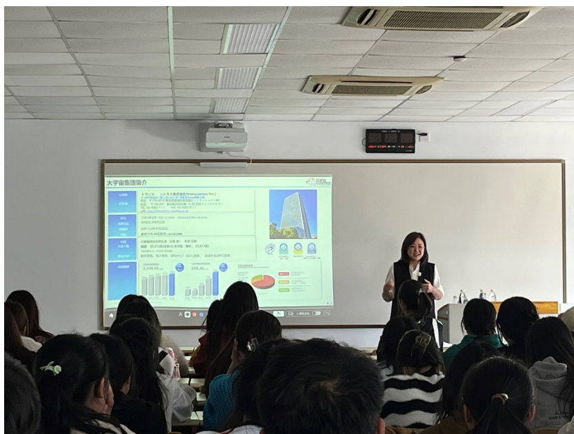
订单班专业知识教学

通过深度校企合作教学，推行校企对接及订单式人才培养，能够满足社会及企业的人才所需，对课程体系加以创新完善。确保在开展理论课程教学过程中，还可以兼顾企业的专业知识需求。对学生的日语会话交谈实用能力不断强化，也丰富了学生所掌握的商务知识，让学生可以掌握基本就业道德及日语礼仪。能够实现语言能力培养同时，也加强对学生企业工作能力、创造性能力及行业能力的培养所需，促进理论知识至专业化技能的转变。同时订单班的设立，有效的节省了大宇宙在后续招聘员工时的岗前培训时间，真正实现学校人才培养和企业用工需求的无缝对接。