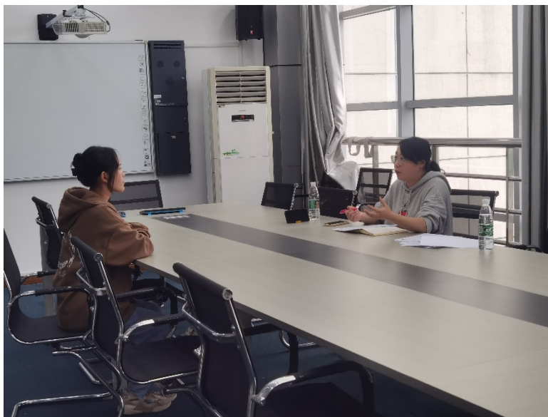
企业进行面试和指导

使员工自觉地接受再教育、再培训、再历练、再交流，为实习员工的成长发展保驾护航，助力实习员工实现职业梦想等。宣讲会后，与有意向应聘的学生进行了交流和初步面试。在面试部分，不仅是作为企业招聘的一环，同时对面试过程中学生出现的举止、仪态、礼仪、语言等方面的问题，都进行了一一指正并做出了正确的示范。这不仅让学生们对大宇宙的企业文化、人才需求、发展前景等有了深层了解，对毕业后的就业方向有了更明确的选择和规划，同时也加强了校企合作的联系和沟通，为校企双方进一步开展多层次、多形式、多领域的合作提供了新的途径。