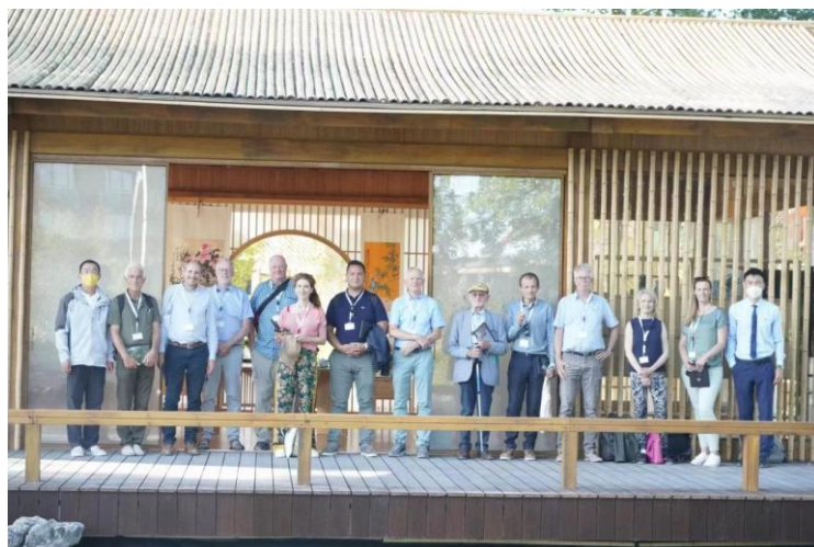
图2 国际园艺生产者协会评审组成员参观“中国竹园”并给予高度赞赏