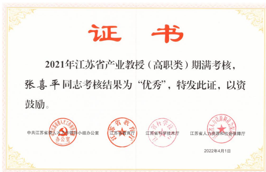
图 11 张喜平在江苏省产业教授（高职类）期满考核“优秀”