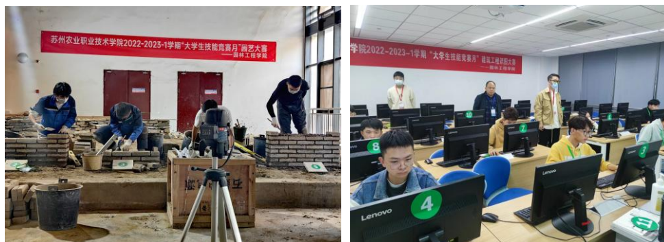
图8 非遗传承人指导“园艺”“建筑工程识图”赛项技能训练