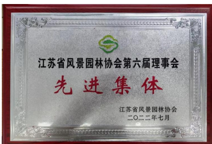
图4 江苏省风景园林协会第六届理事会“先进集体”