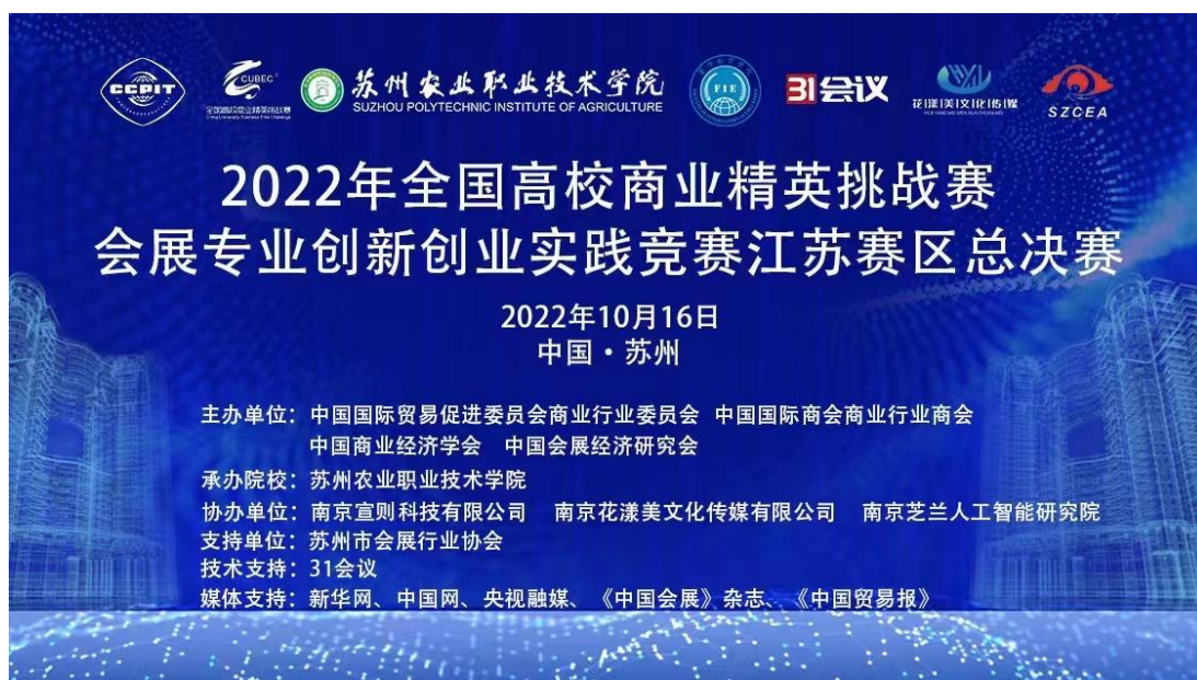
图6 承办全国高校商业精英挑战赛会展专业创新创业实践竞赛江苏赛区省赛

“会展设计师（中级）”社会培训任务；发挥会展策划与管理品牌专业的标杆与引领作用，作为教育部“会展管理1+X证书”2021年度优秀试点院校并聘请了一名老教师为“教育部1+X会展管理职业技能等级证书项目专家库专家”，全过程参与证书标准、教材、教案、考核方案、题库、测试平台、师资队伍培训项目、培训手册、国开学分银行学习成果的认证及学分转化课程置换等工作。会展策划与管理专业在专业建设方面既在本校起到良好示范作用，也在省内会展策划与管理专业建设中起到积极引领作用。