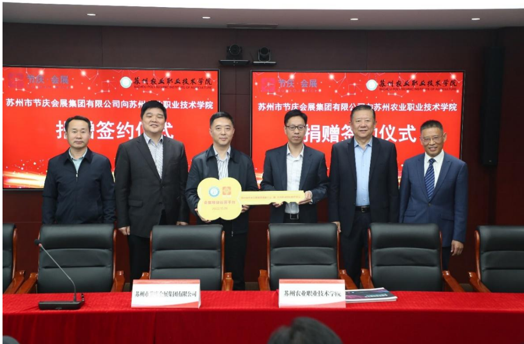
图2 节庆会展捐赠协议签约仪式