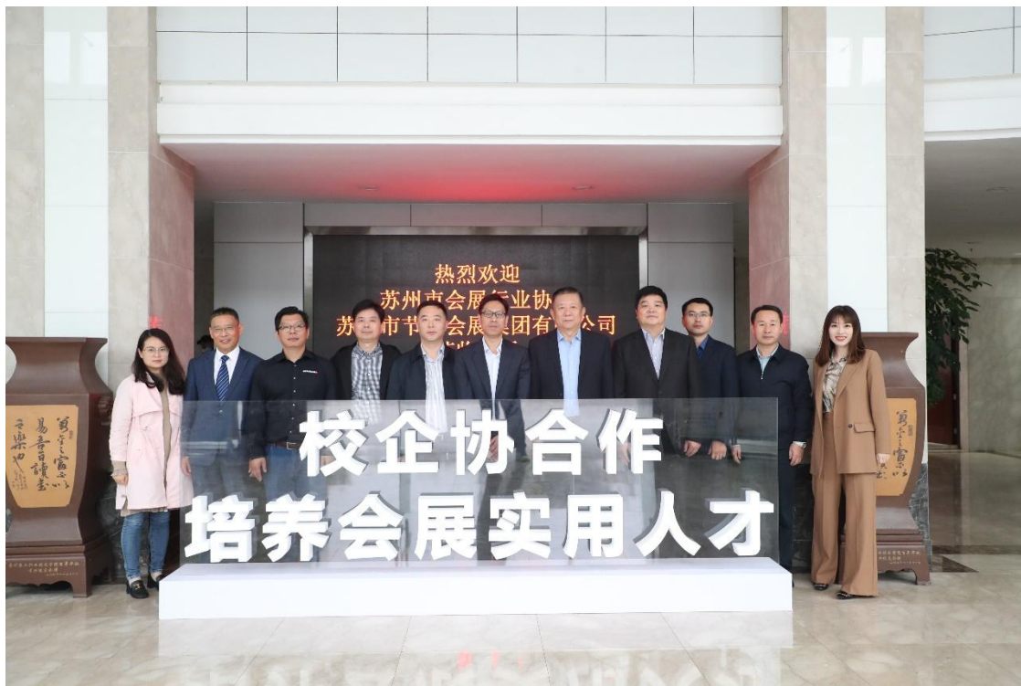
图1 校企协三方协同育人