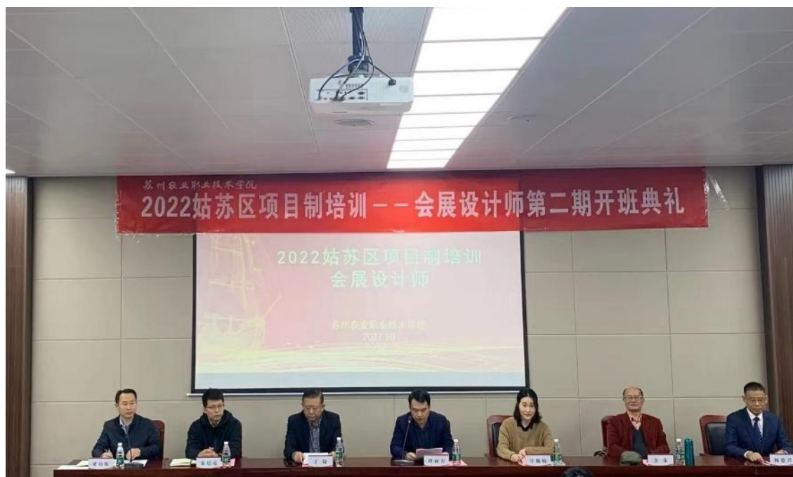
图8 姑苏区项目制培训——会展设计师