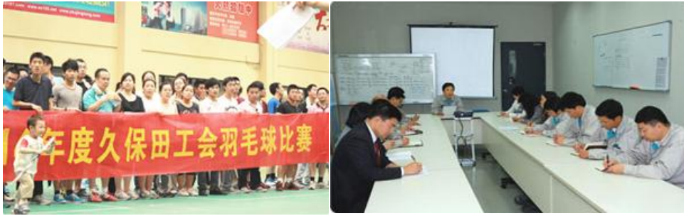
图2 公司员工文体活动

事业业绩和培养人才如同车的两个轮子，必须齐头并进，要为员工创造一个有竞争、充满活力，勇于展示才华的工作环境，提高企业的核心竞争力。