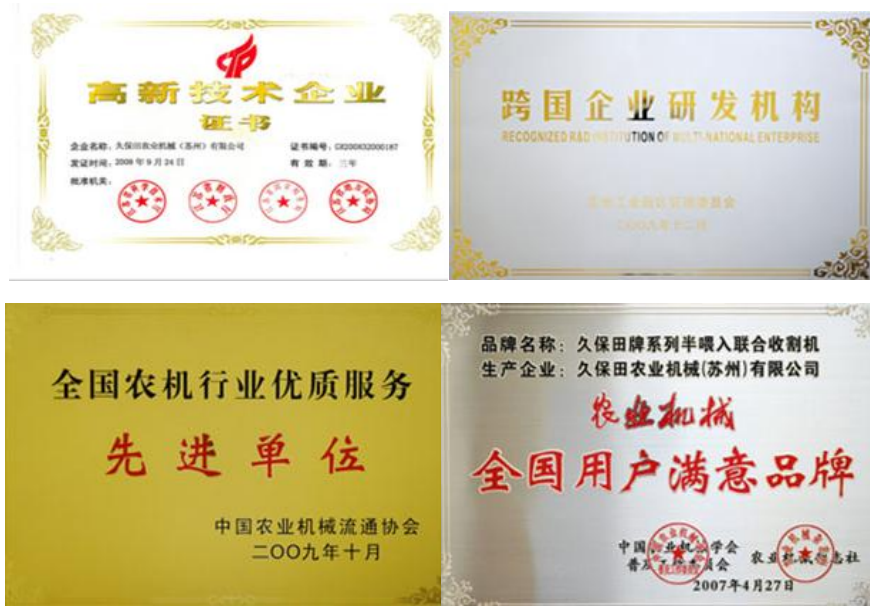
图 4 公司部分荣誉展示