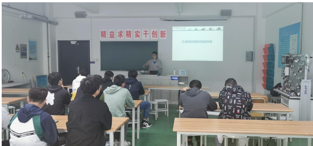
图 8 企业工程师课堂教学

大师面对面等活动，形成初步的职业意识，初步树立专业思想，养成职业意识。第二阶段“专业教育阶段”，根据职业岗位要求确定专业核心课，强化专业知识教育。第三阶段“就业教育阶段”，学生通过到久保田公司培训、实操、顶岗实习等活动，进一步了解久保田公司的岗位需求和 workflows，增强就业意愿。