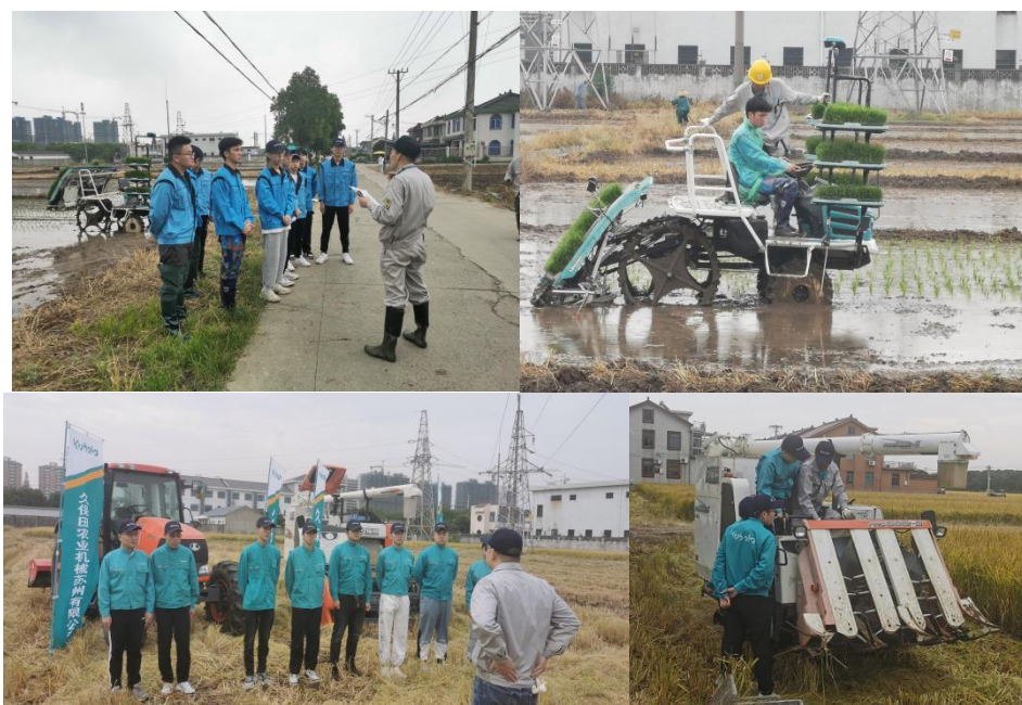
图 9 实习基地现场教学