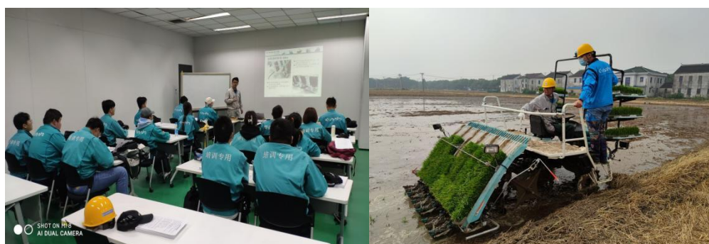
图 7 校企实训基地教学

2020 年以来学校与久保田农机苏州（苏州）有限公司共建了“久保田培训中心”公司实训基地和“常熟市龚巷”校外实训基地。企业导师与学校教师同堂教学，让学生深入生产一线，真正的实现了“做中学、做中教”的教学模式。