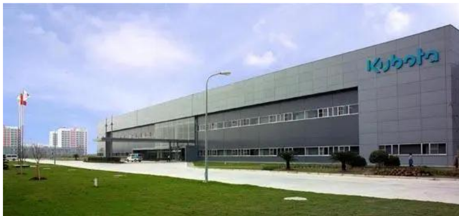
图1 久保田农业机械(苏州)有限公司

久保田农业机械(苏州)有限公司是久保田(中国)投资有限公司的子公司,成立于1998年,是一家集开发、制造、销售和服务于一体的综合性农机制造商,目前主要从事收割机、插秧机、拖拉机以及其它新型农业机械的研发、生产、销售和售后服务。公司充分利用久保田在世界范围内的技术、管理、资金等方面优势和先进的营销服务经验,不断开拓,在各级农机管理推广部门、经销商、用户和厂家的共同努力下,久保田收割机得到了社会各界的广泛认可,受到了用户的信赖与青睐。久保田已成为国内水稻机械行业的领导品牌之一。在巩固久保田品牌的基础上,公司还根据市场需求、用户需求适时地研究、开发了多种收割机、插秧机、拖拉机等产品,曾被授予江苏省高新企业以及跨国企业研发机构等资格。公司正努力将苏州久保田建设成为日本久保田在亚洲的研发和加工制造中心。