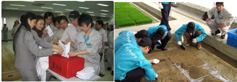
图3 公司员工社会服务