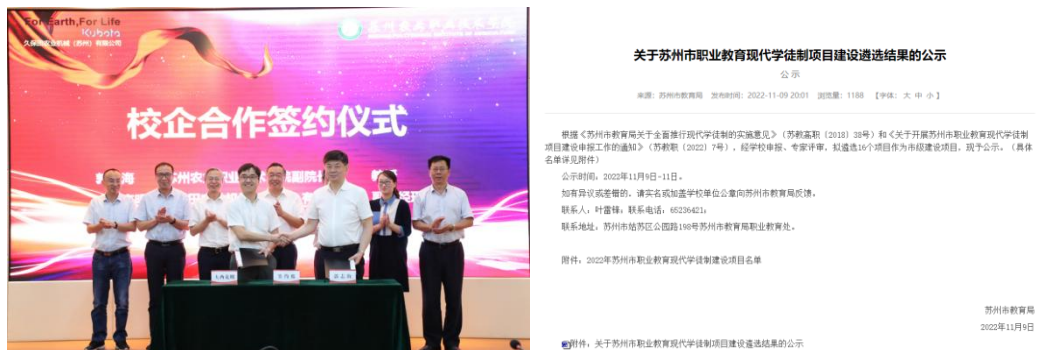
图 5 校企合作办学

2020 年苏州农业职业技术学院与久保田农机（苏州）有限公司共同建立了订单班，已建成久保田班两个。在订单班人才培养过程中，校企双方根据产业发展需求和专业人才培养目标，不断优化专业人才培养方案，构建了“政、产、学、研、用”五位一体的协同育人模式。经过校企的共同努力，久保田学徒班于 2022 年 11 月入选苏州市职业教育现代学徒制建设项目。