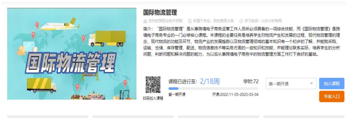
图 3：校企合作共建在线开放课程《国际物流管理》