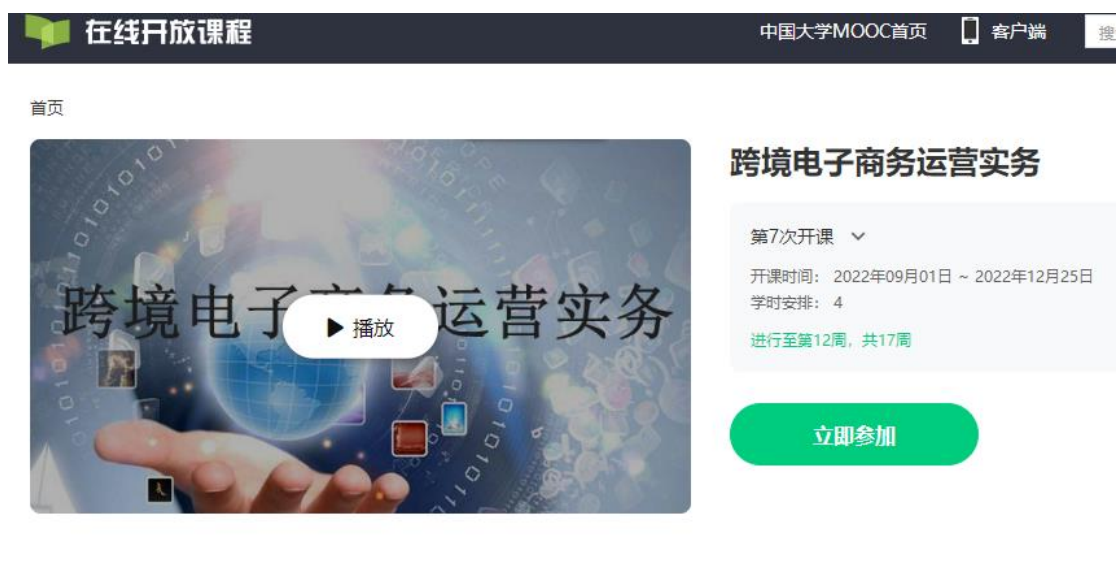
图 2：校企合作共建在线开放课程《跨境电子商务运营实务》

注册、选品定价、视觉营销、海外推广、物流结算到数据分析的跨境运营全流程，以速卖通为典型平台、以婚纱礼服为典型产品、以 B2C 出口运营为典型模式系统开展跨境电商运营实操训练，同时分享跨境电商行业最新鲜的全球资讯、最前沿研究报告和最一线的跨境大咖访谈，解决跨境电子商务运营中“卖什么、卖给谁、在哪卖、怎么卖”的核心问题。目前已第五次开课，选课人数近 2 万人。