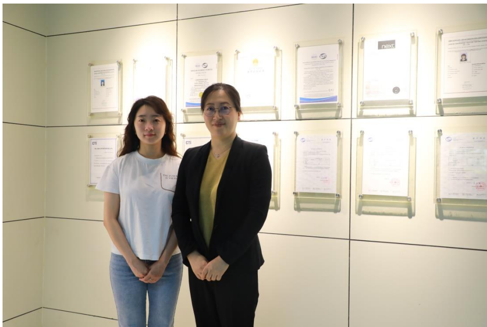
图 8：博士科研团队在公司参观国家纺织品检测中心