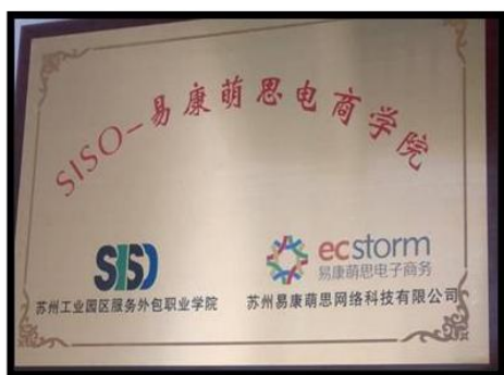
图 3 SISO-易康盟思电商学院

自入驻学校以来，易康萌思与外包学院一直保持密切合作关系，2018年易康萌思与外包学院共同成立“SISO-易康萌思电商学院”。双方在友好协商、同频同行、