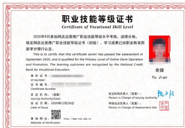
图 4 1+X 网店运营推广职业技能等级证书

近几年来，易康萌思与学校联合人才培养数量已达 256 人，完成 1+X 网店运营推广职业技能认证培训 73 人，1+X 跨境电商 B2B 数据运营认证培训 65 人，接收职业院校开展每年三个月以上实习实训总人数 159 人，录用毕业生 44 人，提供兼职教师和学徒导师 15 名，接纳教师实践学习累计 12 名。