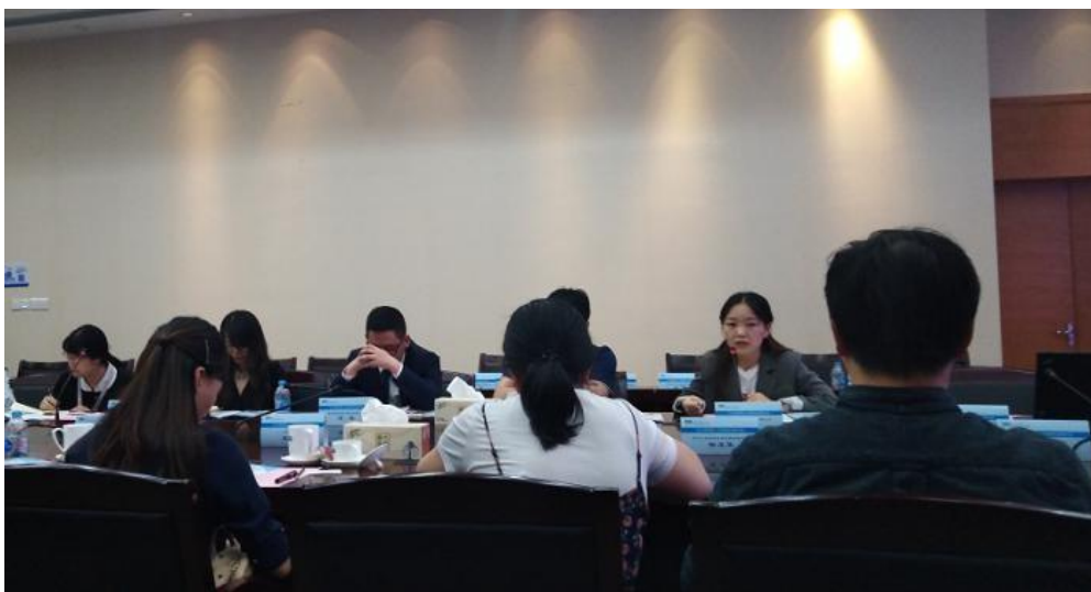
图 6 链家参与专业研讨会