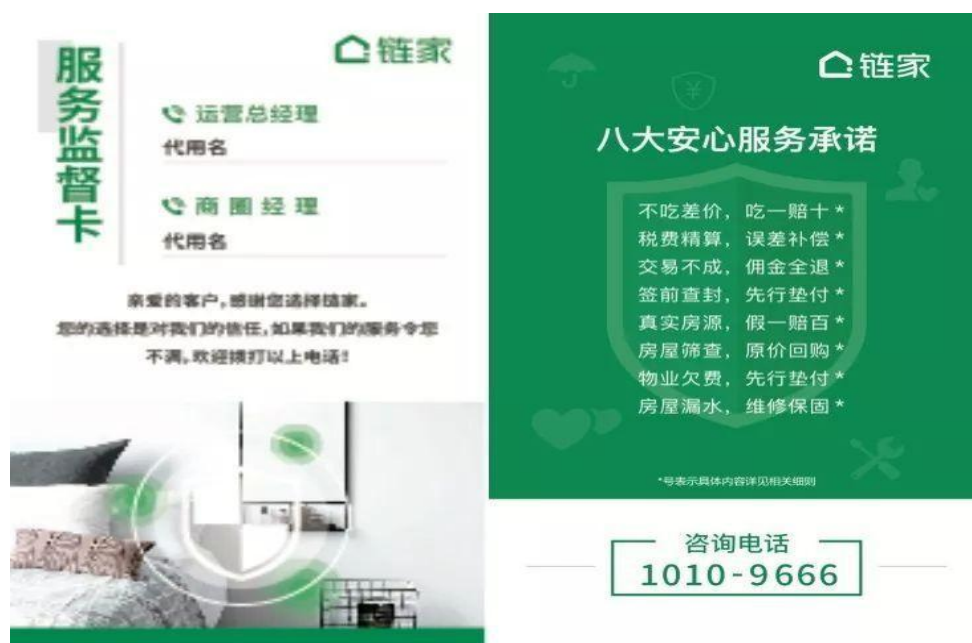
图 2 链家服务监督卡

服务标准制定到内部品质监控，都有严格的标准。从而让 15 万经纪人 都能提供标准化的专业服务，让经纪人职业化。链家正积极拓展多业务。 新 房业务已覆盖 25 个城市，提供专业的新房咨询顾问服务。在海南等地， 开创全新的旅居综合服务模式。海外业务已进驻美国、澳大利亚、新西 兰等 10 个国家。并探索房产生态业务，建设家居综合服务平台。未来 五年，链家会以互联网技术和数据化产品，进行线上线下的打通， 重 构和优化交易流程，不断提升交易体验。