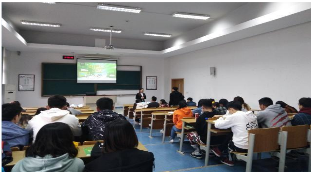
图 4 链家来校开展讲座