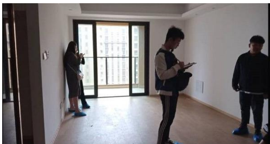
图8 学生房产评估现场