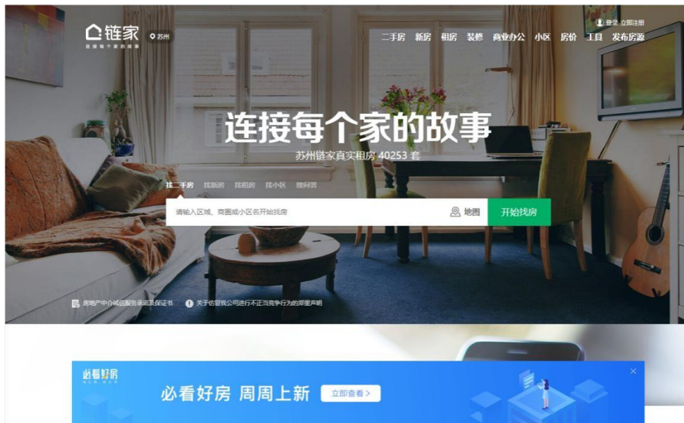
图 1 链家官网

链家，成立于 2001 年，是以数据驱动的全价值链房产服务平台。提供二手房、新房、租房、旅居房产、海外房产等房产交易服务，并拥有业内独有的房屋数据、人群数据、交易数据，以数据技术驱动服务品质及行业效率的提升。经过多年发展，链家目前已进驻北京、上海、广州、深圳、天津、成都、青岛、重庆、大连等 28 个城市和地区，全国直营门店数量超 8000 家，旗下经纪人近 15 万人。成立至今，链家一直是行业引领者和颠覆者。业内率先承诺真实房源，全国真房源率已超过 97%；并开展安心服务承诺，建立亿元保障金，保证消费者交易安全。链家是真正具备大数据处理能力的房产服务平台。历时 8 年，收集 160 多个城市 1 亿 1000 万套房屋信息，并建立业内独有的“楼盘字典”，为真房源奠定基础。通过对房屋数据、人群数据和交易数据的挖掘和处理，提供从找房到签约的各类线上产品，帮助提高交易效率，优化交易体验。