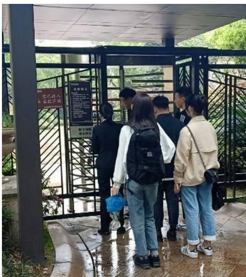
图7 链家参与学生实训