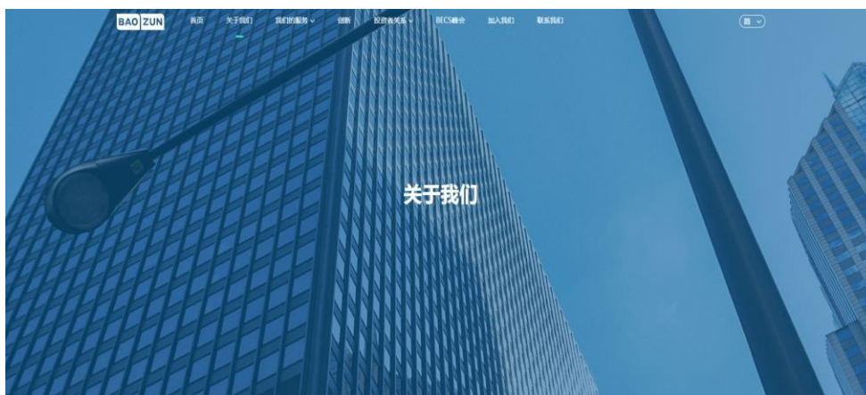
图 1 宝尊集团官网

承办海运、空运、陆运进出口货物的国际运输代理业务，包括：揽货、订舱、仓储、中转、集装箱拼装拆箱、结算运杂费、报检、报验、保险、运输咨询业务；报关代理；国内货运代理；人力搬运装卸服务；起重吊装服务；仓储服务；供应链管理咨询、物流及贸易信息咨询；物业管理；自有房屋租赁服务；物流信息技术及物流软件的研发、设计、咨询、销售；包装服务；电子产品、食品、药品、医疗器械、化学试剂、化妆品、计生用品、消毒用品、日用百货、卫生材料、非危险化工产品、包装材料、橡胶制品、塑料制品的销售；自营和代理各类商品和技术的进出口。