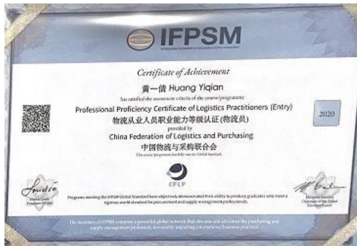
图 5 立交桥项目学生所获 SCM 相关国际认证

学校与江苏恒伟供应链管理有限公司的合作目前着力三个层次，一是学校为企业的发展也提供了优秀的学生，二是借助企业学院下项目培养双师型 SCM 讲师，三是接受企业委托学校开展SCM 相关职业技术资格和技能培训。