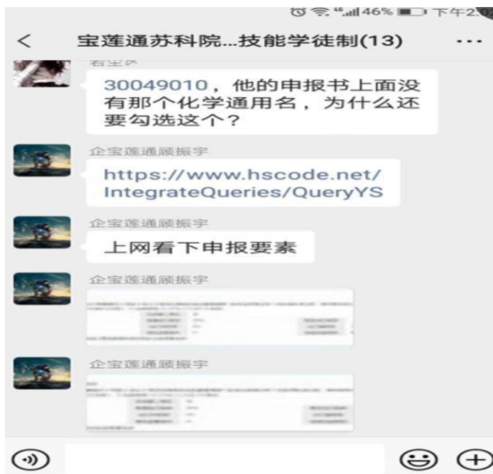
图 2 教学资源人才与数字资源投入

企业在校企合作中投入的资源主要是人力投入和教学资源投入，具体表现在由集团事业部业务副总亲自领衔通过线上线下多种渠道对采购与供应链管理专业学生进行苏科院-宝连通导师学徒制项目“24 小时”同时提供海量的数字教学资源。