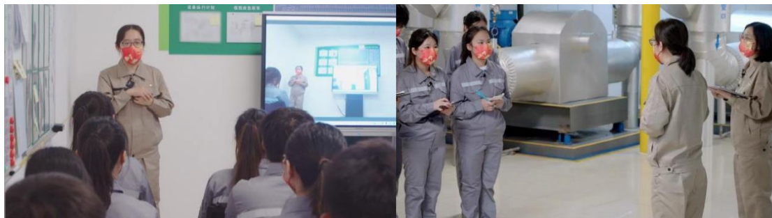
图 3 岗位综合实训联合授课

师资投入：每学期企业根据学校人才培养方案中的课程需求，安排具有丰富实践经验及授课经验的导师参与授课。授课形式多样，包括独立授课、联合授课，其中，每学期都有一门课是由企业导师独立授课，一门实训实践类课程由多名企业师傅与专业教师联合授课。图 3 为岗位综合实训的授课过程。