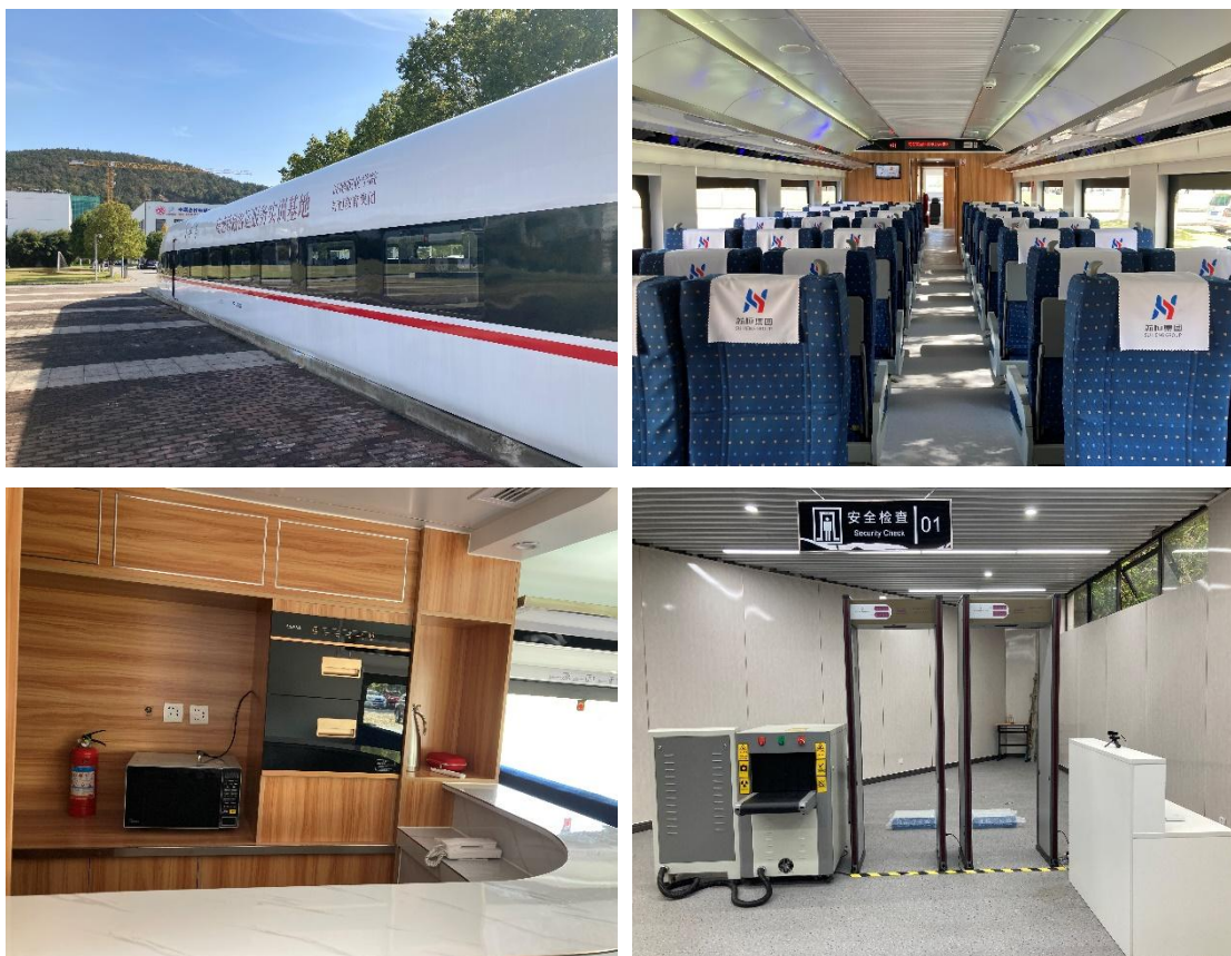
图2 高铁服务实训基地

高铁服务实训基地主要承担《高铁客运服务流程训练》、《高铁设备操作与管理》、《高铁安全管理》等课程的实训任务，通过仿真的教学环境，训练学生熟悉高铁客舱内部的各种布局 and 结构、设备设施的操作方法、乘务服务流程、应急处置方法等；培养学生的服务操作技能、服务意识以及沟通能力；帮助学生从学校到就业的过渡，适应岗位需求。