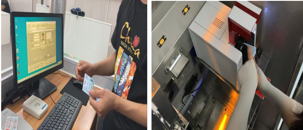
图3 实训基地设备使用培训

根据校企合作协议，苏恒集团选派实践经验丰富的企业员工承担《高速铁路客运组织》、《高铁客运服务礼仪》等授课任务；并安排相关人员来校开展培训，帮助我校师资掌握实训基地的设备使用。