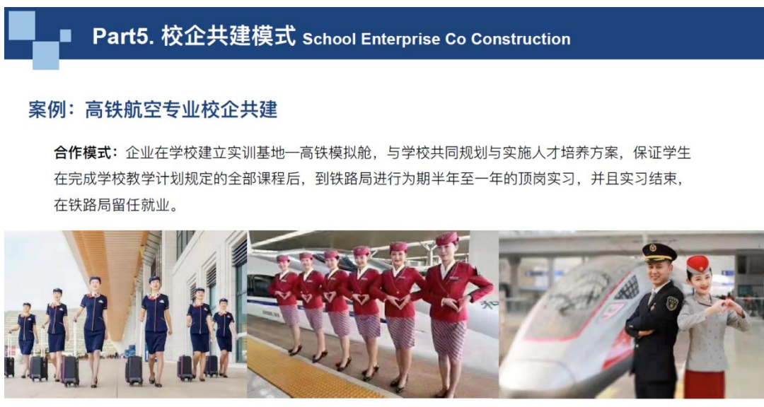
图5 苏恒集团企业宣传内容

在与我校的合作过程中，苏恒集团也在不断摸索与完善校企共建的模式，为企业以后发展提供宝贵的经验，与我校的合作，已经成为企业的成功案例。