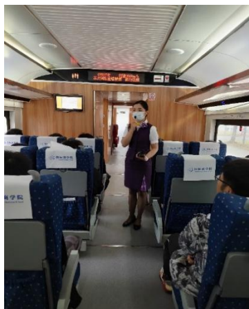
图4 企业导师授课中

企业选派教学能力强的在岗员工，进入学校，帮助完成专业核心课程的教学任务，实践经验丰富、专业技能娴熟的兼职教师，将新技术、新经验融入教学中去，保障教学内容的前沿性与实用性，提高学生的实际动手能力，补充了书本知识，弥补我校师资在实操教学上的不足。