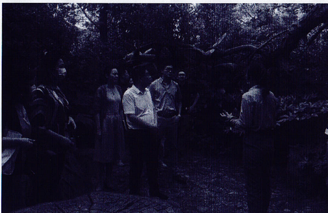
图6 实地考察恐龙主题研学旅行产品