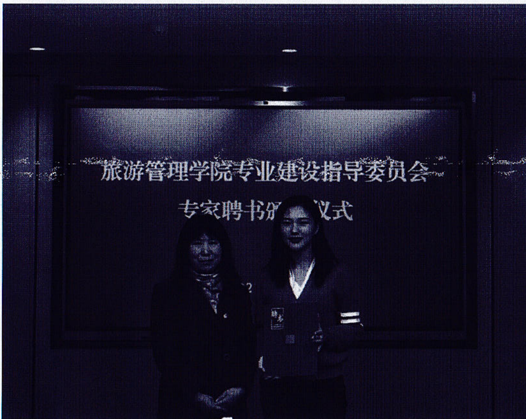
图2 专业建设指导委员会专家聘书颁发