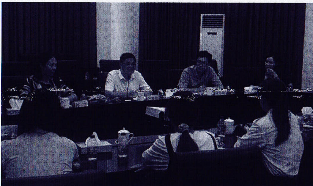
图5 教师、企业、实习生座谈交流