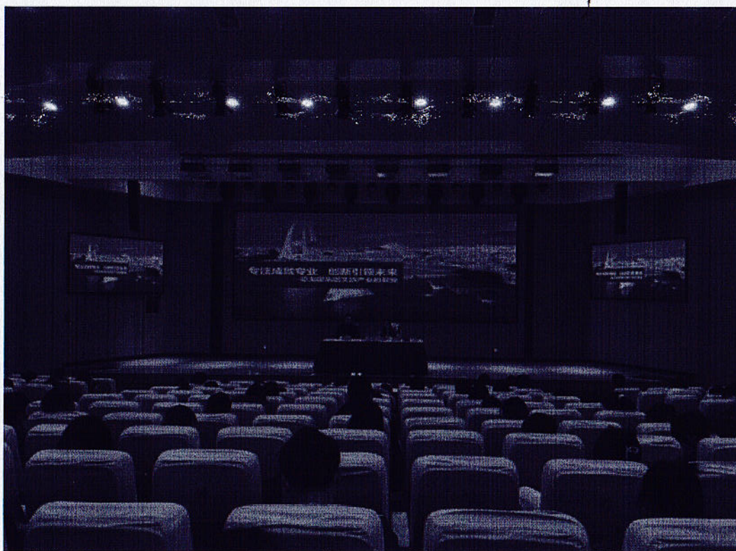
图1 校企合作系列讲座活动现场