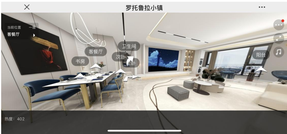
图 1 南京金涛装饰工程有限公司部分设计作品