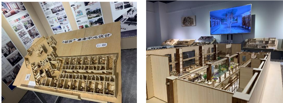
图 4 校企合作项目设计作品展示场景

南京金涛装饰工程有限公司派遣资深室内设计师参与专业综合实训授课，将实际工地现场所遇到的专业技术及关注点与学生分享，学生在学校就可以与工地现场“零距离”接触，获得学生极大的好评。(图 5)