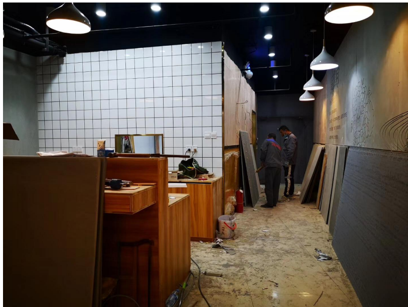
图 5 施工现场实际展示

南京金涛装饰工程有限公司派遣资深室内设计师参与专业综合实训授课，将实际工地现场所遇到的专业技术及关注点与学生分享，学生在学校就可以与工地现场“零距离”接触，获得学生极大的好评。(图 5)