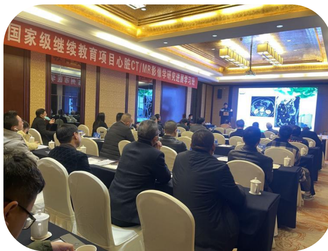
图6 影像临床班学生参与“心脏 CT/MR 影像学研究进展学习班”学习

泰州市人民医院影像科承办国家级继续教育项目“心脏 CT/MR 影像学研究进展学习班”暨“第十四次泰州市医学影像学年会”，邀请省内外专家，涵括全身多系统影像诊断与进展、人工智能等讲座紧跟时代潮流。江苏医药职业学院泰州影像技术临床班全程参与学习。大家开拓了视野，学到了学科先进知识，在活动组织、参与过程中进一步加强了班级凝聚力。