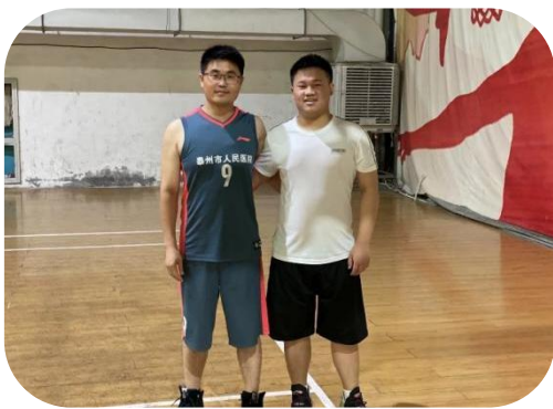
图2 丰富学生文体活动

现有硕士研究生导师 86 名,博士生导师 6 名,定期组织兼职教师培训、参加教学比赛,促进教师教学能力提升,2021-2022 学年师资培训经费支出达 43.93 万元。教学设备支出 168 万元,有力的支撑了教育教学工作开展。此外,医院还拥有图书馆、健身房、羽毛球馆、乒乓球馆等文化体育场所,供师生使用。