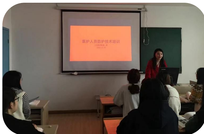
图5 医护人员防护技术培训

泰州市人民医院影像科承办国家级继续教育项目“心脏 CT/MR 影像学研究进展学习班”暨“第十四次泰州市医学影像学年会”，邀请省内外专家，涵括全身多系统影像诊断与进展、人工智能等讲座紧跟时代潮流。江苏医药职业学院泰州影像技术临床班全程参与学习。大家开拓了视野，学到了学科先进知识，在活动组织、参与过程中进一步加强了班级凝聚力。