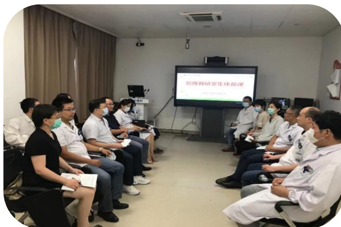
图8 影像技术专业泰州驻点班教研室集体备课