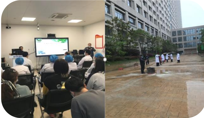
图7 影像技术驻点班参与消防安全培训演练