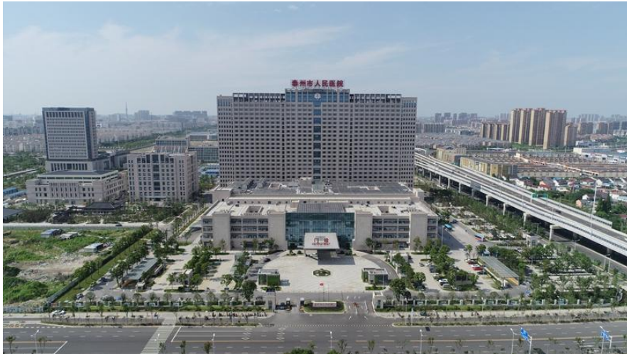
图1 泰州市人民医院新院区全貌

医院分为南、北院区和新院区三个院区,设有临床一、二、三级科室 58 个, 71 个病区,江苏省临床重点专科 16 个、江苏省妇幼健康重点学科 1 个,泰州市临床重点专科 20 个、医学重点学科 7 个。省医学重点学科培育点 3 个,省医学创新团队 2 个,泰州市医学重点学科培育点 1 个。同时建有泰州市肿瘤研究所、心血管研究所、肝病研究所。