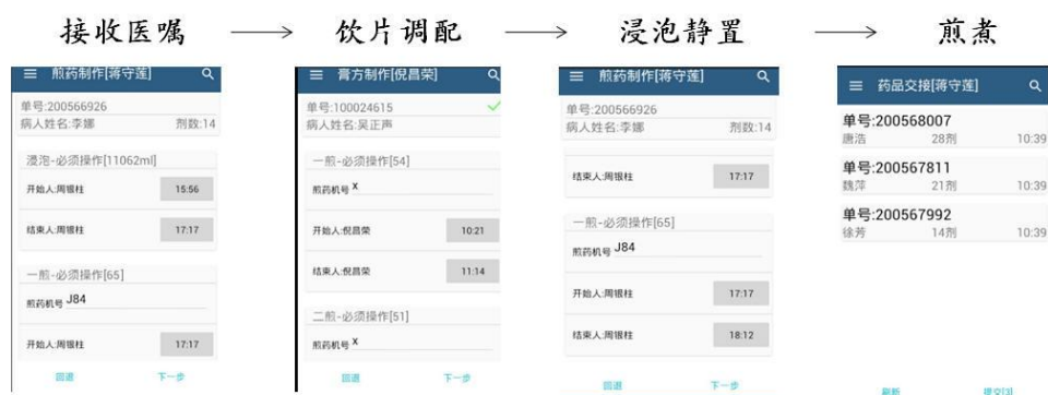
图 26 根据省中医院“云药房”系统及临床实践开发课程案例教学资源