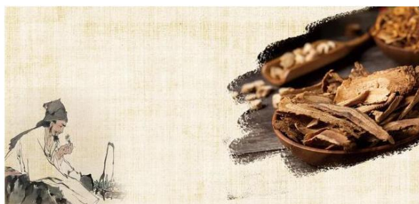
图 2 网易新闻报道中药特色传承班