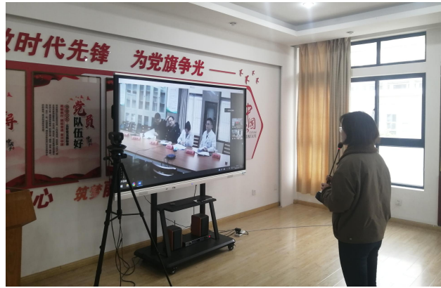
图8 校院联合对第二届中药传承班学员进行在线面试