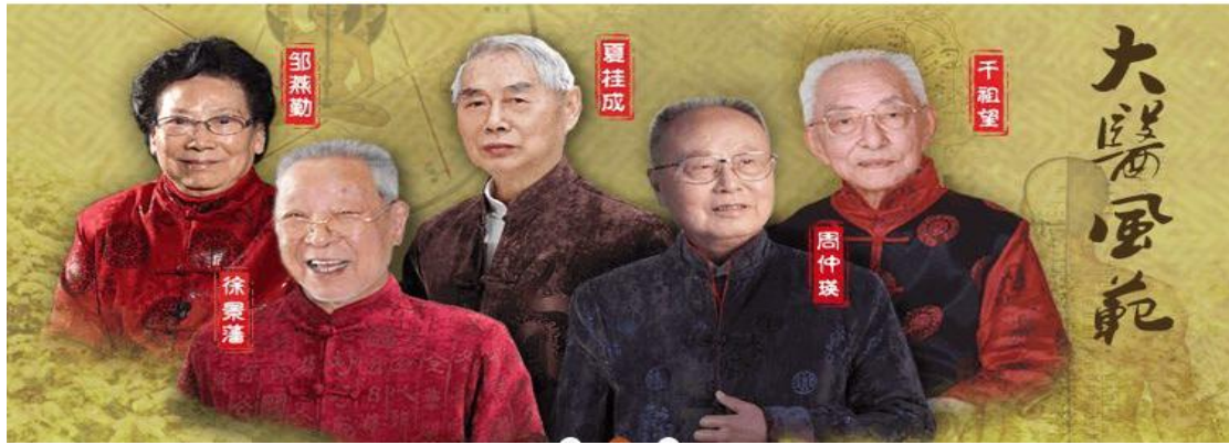
图 18 省中医院著名专家

拥有丰富的药学全流程学习环境与教学资源：建设了国家中药优势特色教育培训基地、国家级中药炮制技术传承基地、中华中医药学会中药临床药师培训基地等教学基地。以上基地均开放给传承班及其他江苏医药职业学院的实习生使用。