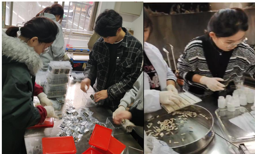
图10 第二届中药传承班学员在带教老师远程指导下开展手工阿胶、胶囊制作训练