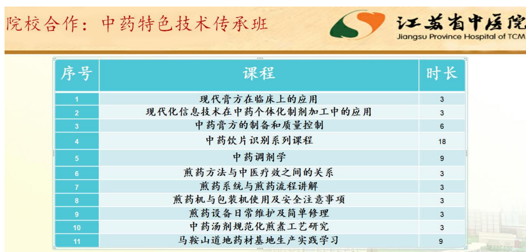
图 14 传承班学生在省中医院教学课表