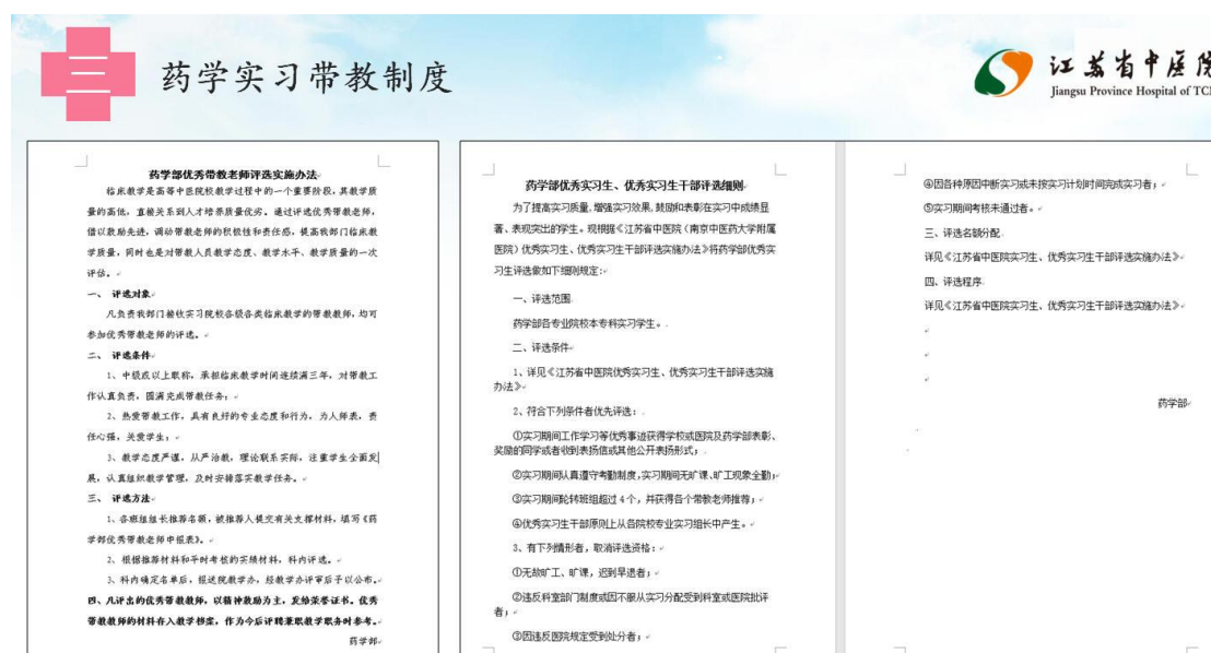
图 20 省中医院药学实习带教制度

规定，带教老师资格条件包括热爱带教工作，具有良好的专业态度和行为，为人师表，责任心强，关爱学生；具有良好的教学和科研能力，能够“因材施教”，启发指导学生，并能够严格管理学生；中药学专业带教老师：具有本科及以上学历，已聘任中级及以上专业技术职务；院龄超过 15 年并已聘任初级师及以上专业技术职务；带教老师工作中若出现重大差错或被投诉经查属实者，取消带教资格一年。