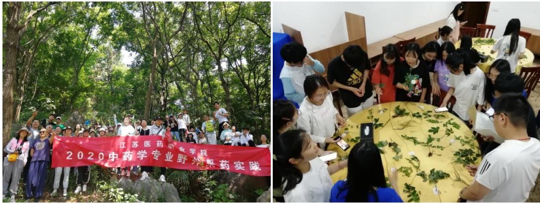
图 7 省中医院与学校共同组织中药专业学生开展野外实践