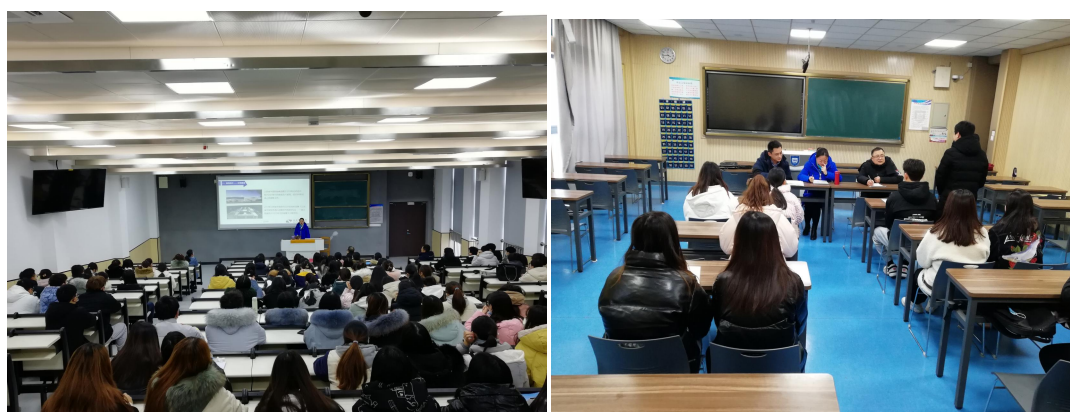
图 17 省中医院专家到校开展讲座及研讨活动

与此同时，行业专家也到学校开展了形式多样的中药专业培训及交流活动，为本院教学骨干搭建了展示的平台和学习的空间，为学校相关专业的师生提供了了解行业技能和临床实际的机会。