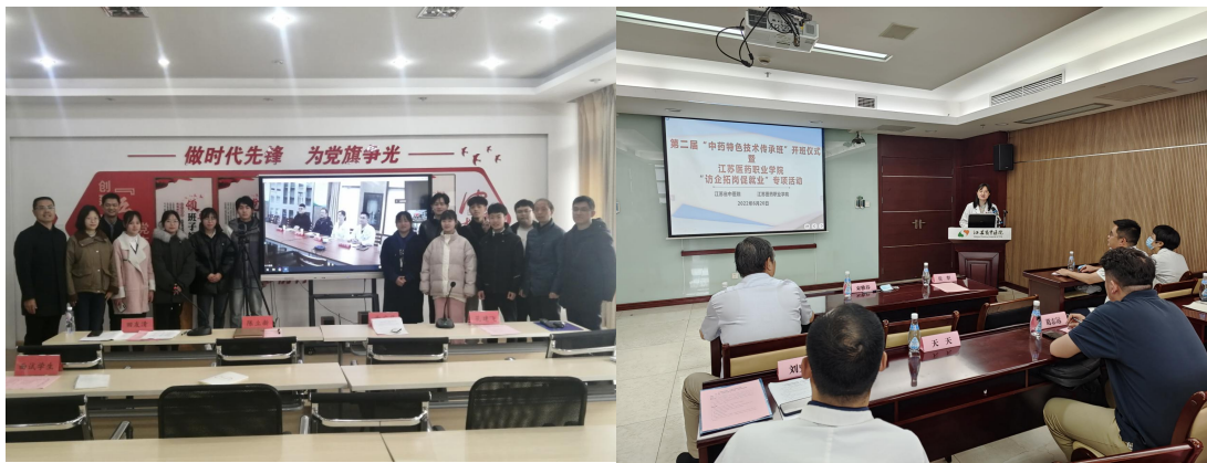
图9 第二届中药传承班开班仪式