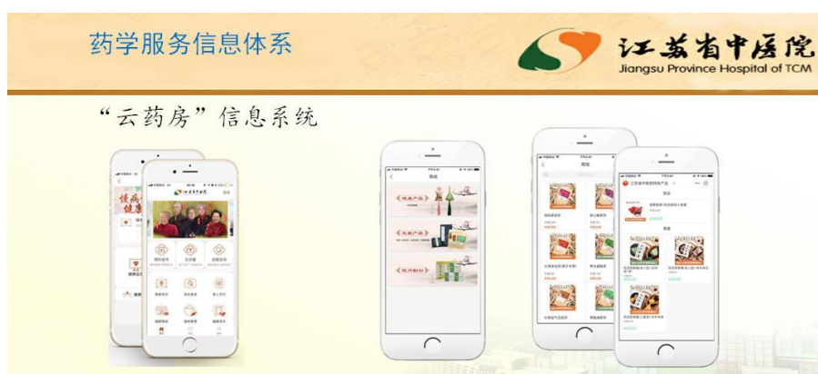
图 25 省中医院“云药房”信息化教学与医疗服务系统

可通过采取实地或网络实时授课系统等,将省中医院临床经验丰富的药师纳入学校的授课系统中,使教学内容更贴近临床。比如省中开发的“云药房”服务完成了互联网+医疗+药品→患者的完整闭合链,探索了“互联网+中医药”的医疗服务模式,可以帮助提高中药学相关专业的课堂教学信息化水平,根据传承班接触到的医院临床实践开发在校学生课堂教学案例等资源,并进一步发挥云药房作用形成传承班适用的特色教材等。