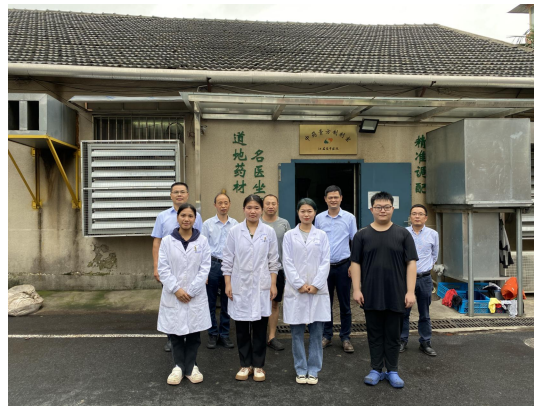
图 23 省中医院实习巡点工作