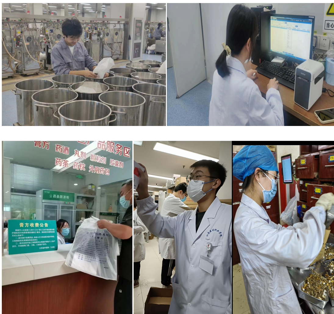
图 21 传承班学生在省中医院不同岗位实习情况

《药学部实习生带教管理办法》中还包含严格实习生考勤等方面内容：学生实习期间，原则上不予请假，如有特殊情况需履行请假手续。