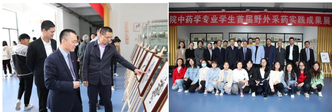
图 24 中药学专业学生野外采药实践成果展

通过举行中药学专业学生野外采药实践成果展，进一步促进学生实践技能、推动人才培养、打造中药专业实践品牌，让学生在实践中夯实理论基础，磨炼实践技能，传承工匠精神、使学生更加热爱专业，努力成长为行业企业需要的高素质人才。