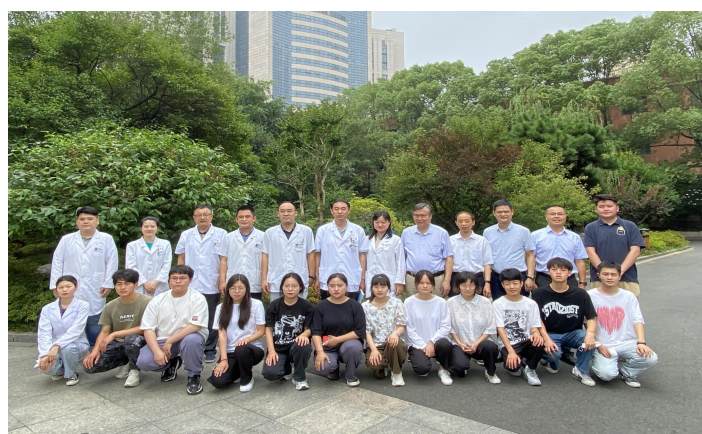
图 12 第二届中药传承班学生与带教老师在省中医院合影