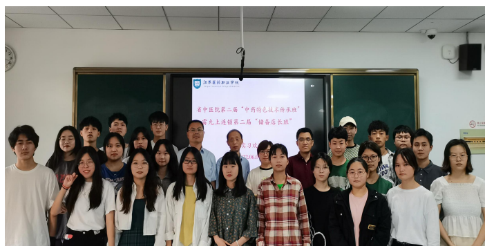
图 11 第二届中药传承班学生实习欢送会