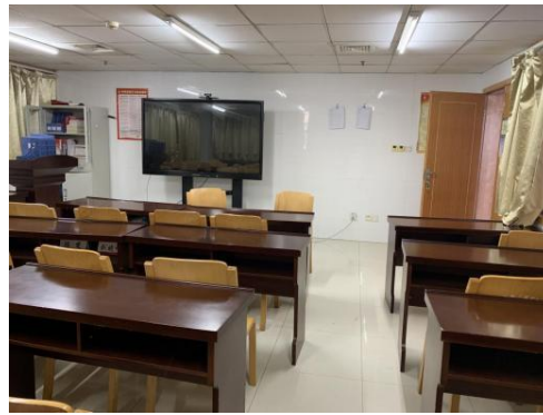
图 4 教学设施——多媒体教室 2