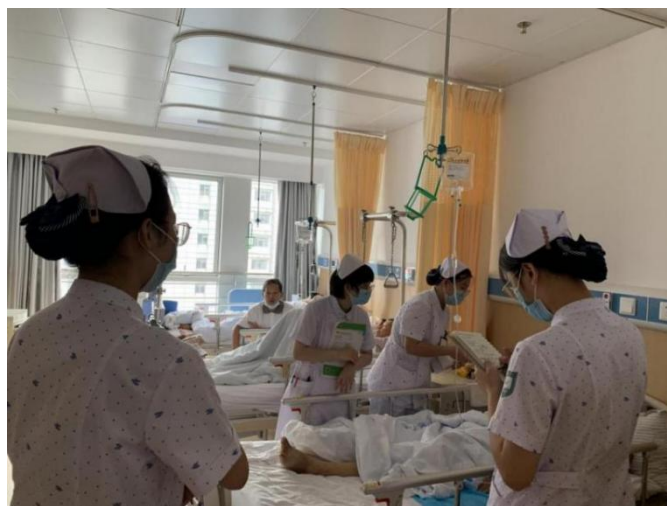
图 14 助产专业 2020 级 2 班学生结合已学知识了解患者病情

积极运用 PBL 教学模式，从临床常见问题出发，启发于病例，拓展在课堂，以问题为导向，将话筒转交给学生，提高学生发现问题，解决问题的能力，促进主动学习。深入挖掘专业课程中蕴含的思想政治教育资源元素，有机融入家国情怀、法治意识、社会责任、人文精神、仁爱之心等思政元素，润物无声地引导学