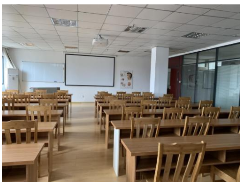
图 3 教学设施——多媒体教室 1