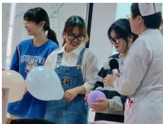
图 17 助产专业 2020 级 2 班学生参加心理讲座现场互动