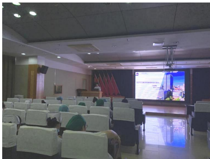
图 13 护理部主任护师汪生梅为见习带教老师讲解护理临床见习教学中如何应用基于 BOPPPS 教学模型的混合式教学

双相互动。基于 BOPPPS 教学模型设计的课前自主学习、课中参与式学习、课后巩固学习的混合式教学，实现了在线学习与课堂教学的有机结合，充分发挥了学生在学习活动中的主体地位，在提升学习成绩的同时，也激发了学生的自主学习意识，改善了学习策略，优化了学习行为，加强了学生的沟通协作能力，促进了学生自我导向学习能力的提升。