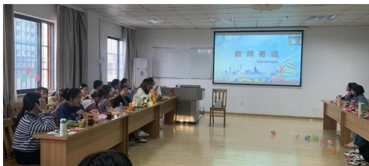
图 16 助产专业 2020 级 2 班学生与导师线上会议

建立一对多导师制，每个导师负责一个小组，5-6 名学生。导师们将在入学至毕业的整个教育过程，从学习、生活到德育的各个环节，对学生进行教育和指导，包括毕业，就业和考研等。制定结对活动记录表，每月开展一次活动。发挥心理工作室作用，促进学生心理健康，及时发现学生心理问题，并疏导纠偏。每月一次主题活动，丰富学生院内生活，开展消防专题、防网络诈骗等系列讲座。