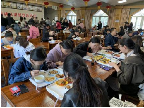
图5 教学设施——学生食堂