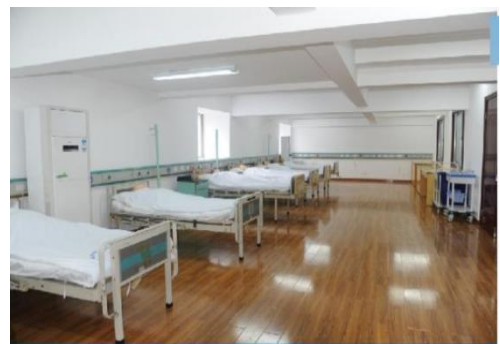
图10 教学设施——临床技能中心