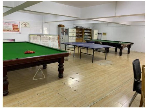
图6 教学设施——活动室