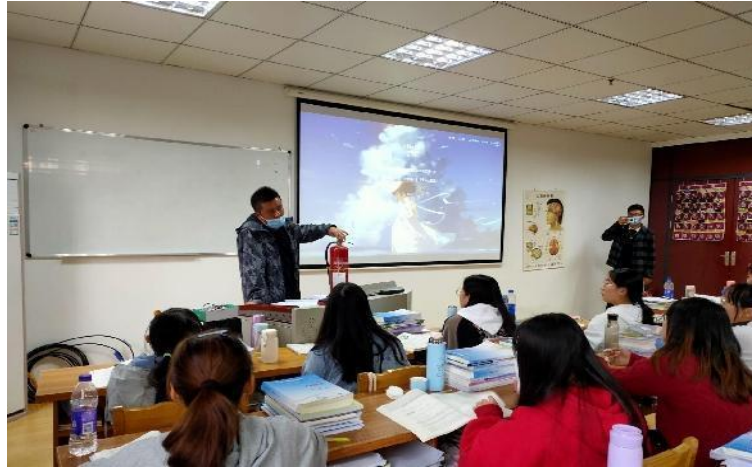
图 18 助产专业 2020 级 2 班学生参加消防安全培训