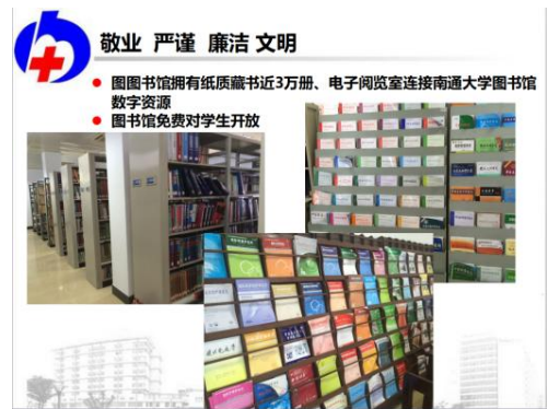
图8 教学设施——文体中心