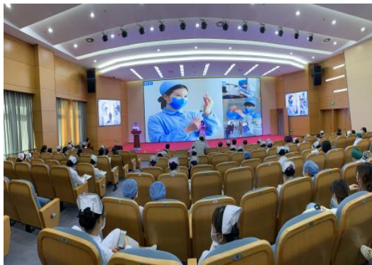
图7 教学设施——文体中心