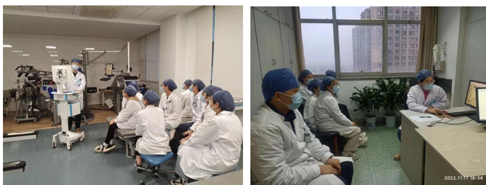
导师带领学生开展技能训练和病例讨论

通过“导师制”的教学管理以及“工学交替，产教融合”的人才培养模式，“驻点班”教学改革一方面将学生置于真实的临床工作场景，面临具体工作任务，针对特定的康复对象，学生能清晰地看到所学知识与技术怎样应用于临床，认识到掌握这些知识与技能的重要性，提高了他们的学习积极性，学生通过真实的视听触觉感受，接触到一个个真实的病例，使原本枯燥的医学知识，不再乏味，变的生动形象。另一方面，学生在实物实境中通过比较得出的规律性认识，能加深她们对知识点的理解与记忆，进而提高了教学效果，经过三年的教学实践显示，驻点班师生关系融洽，学生学习热情激增，学习氛围浓厚，对专业认可度高，基础理论扎实，实践能力强，已完成学业的驻点班学生深受用人单位欢迎，实现了 100%就业。