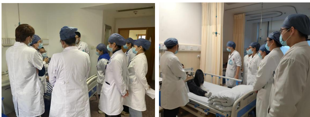
临床导师带组进行床边教学

2. 实行工学交替，产教融合人才培养模式，探索和推行导师制育人 开展“工学交替，产教融合”人才培养模式，每天下午增设临床实践观摩课程，以临床实践促进书本理论的理解和学习，每天晚上安排病例讨论及科室培训，以书本的理论指导和强化临床的应用能力。此外，积极探索导师制的育人方法，以小组为单位，每4~5名学生配置1名导师，导师需要分析和了解学生的学习情况，因材施教，带领小组学生随诊查房和床边教学，指导学生技能竞赛，关心学生生活和思想动态等。