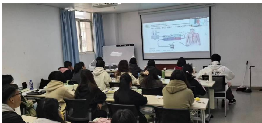
线上学术研讨交流