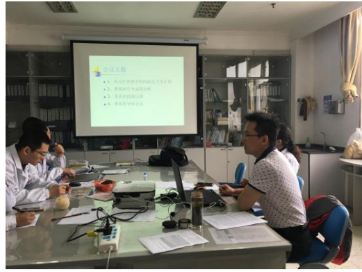
江宁医院驻点班的教学研讨