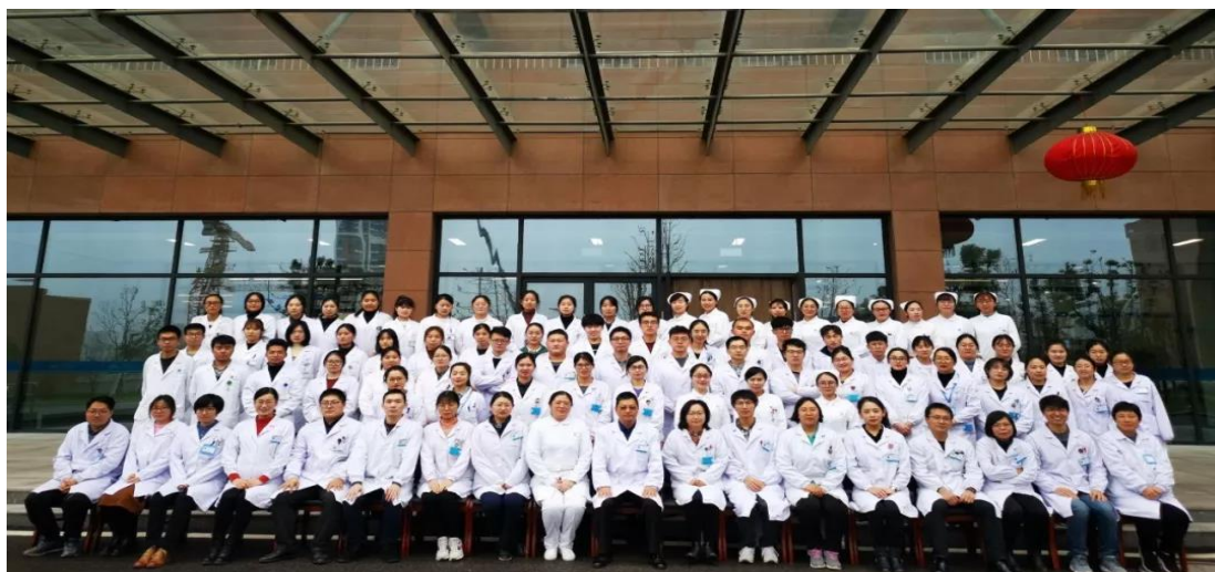
表 2：江宁医院教学团队一览表