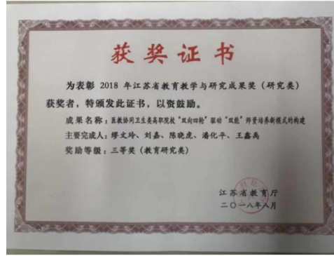
省教学成果三等奖。