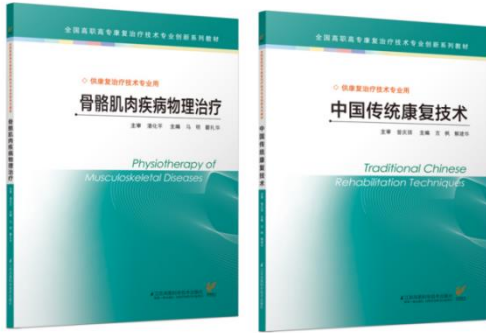
校企合作开发教材。