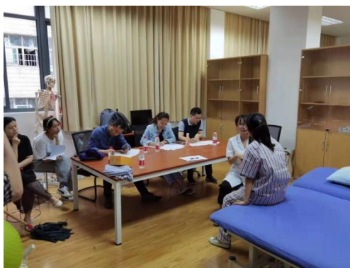
校企双方共同开展驻点班和学校学生的考核评价