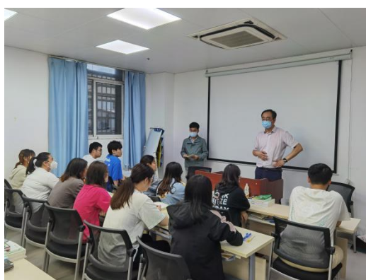
我校康复医学教研室与江宁医院科教科、行业专家和驻点班学生进行教学反馈交流活动