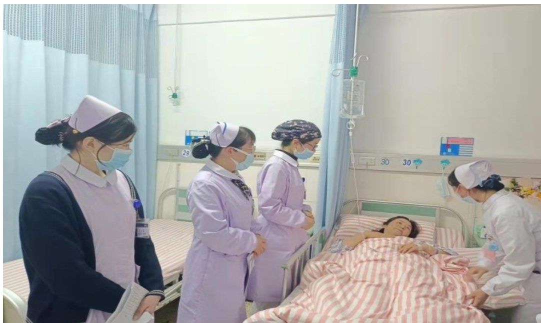
图5 定期开展教学查房