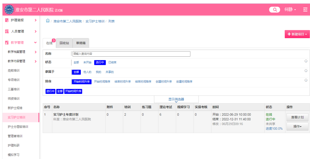
图 2 教学资源库