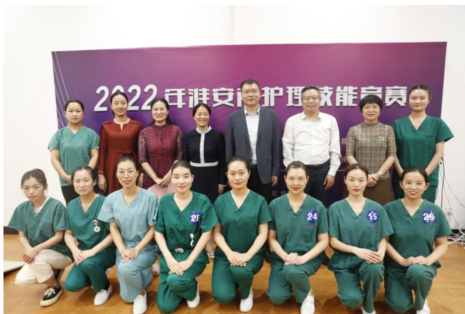
图7 淮安市护理技能大赛在江苏食品药品职业技术学院举办

9月28日至9月29日，由淮安市卫生健康委、市总工会、市人力资源和社会保障局联合主办，淮安市第二人民医院承办的2022年淮安市护理技能竞赛活动在江苏食品药品职业技术学院护理实训中心成功举行，学校作为协办单位，充分发挥护理学院教师专业优势、场地优势为来自各县区卫健委、市直各医院16支代表队做好竞赛的服务工作，助力竞赛圆满成功。