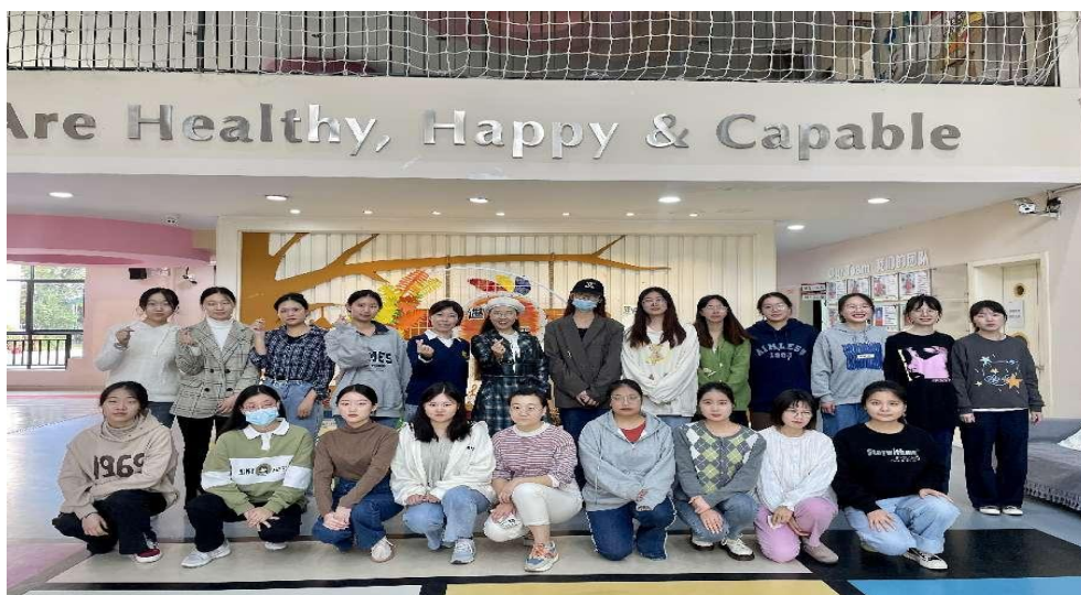
2021学前教育专业本科学生在红黄蓝公馆园开展专业见习

同时，该公司继续无偿接收我院婴幼儿托育服务与管理专业学生进行专业认识实训和专业综合实训，并给实训学生免费提供午餐。