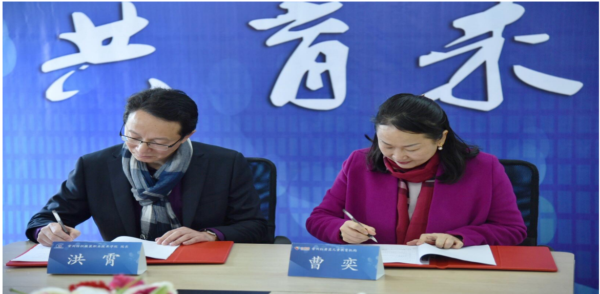
校企深度合作签签约