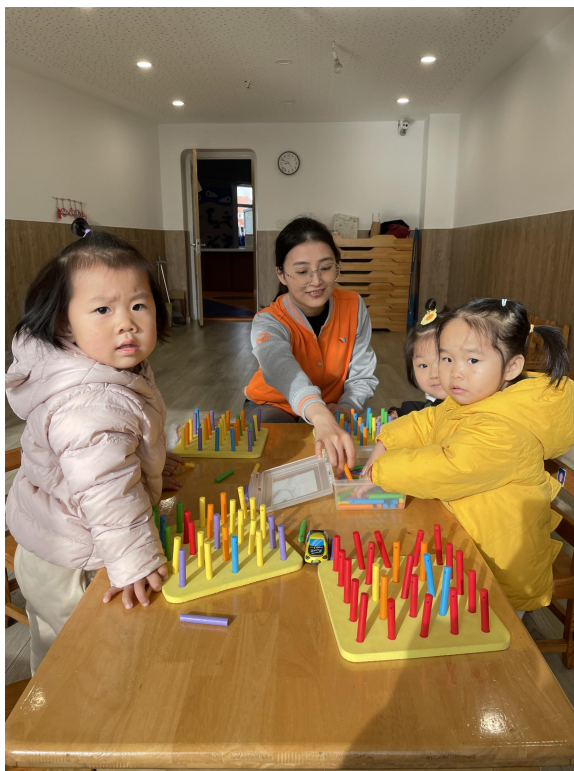
幼服专业教师参加企业实践