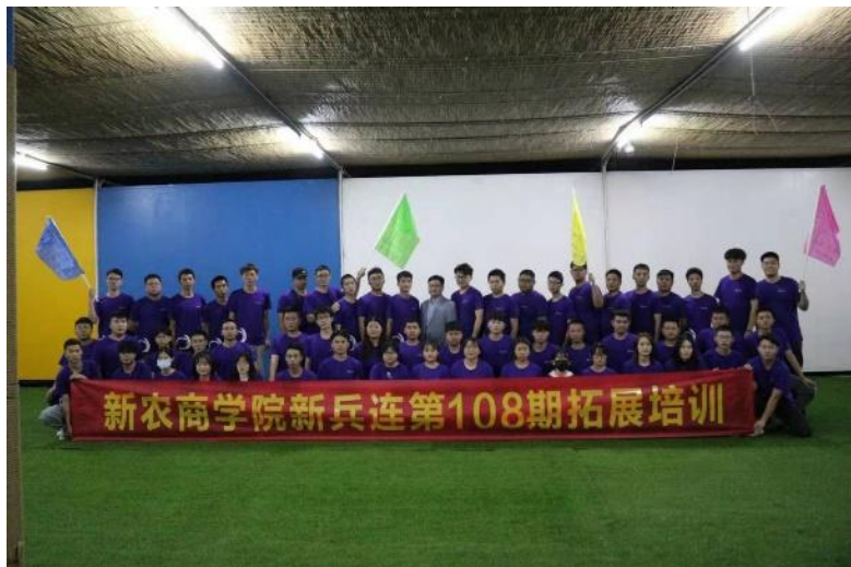
图 2-2 108 期新兵营结业合影

实习学习阶段，企业保证每一名顶岗实习生均有企业成熟技术人员作为带教老师，针对行业需求以及学生个人条件，在配怀、产房、保育、育肥 4 环节中选择合适的岗位让同学学习对应技术。