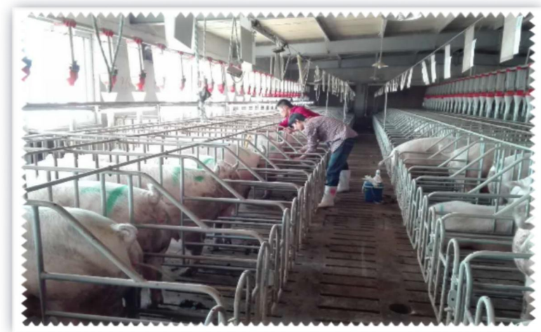
图 2-3 成熟带教老师 1 对 1 带教