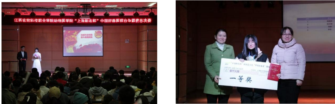
图 3-1 好兽医技能大赛现场及颁奖

公司积极参与学校举办的各种活动当中，丰富同学们的课余生活，为各种畜牧兽医学院的活动提供支持。如校运动会服装提供等，并赞助冠名 19 年中国好