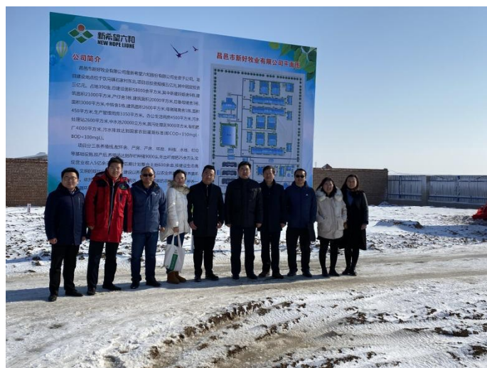
图 2 畜牧兽医学院教师赴新希望六和校外实习实训基地走访

进一步，为了让现代学徒制班学生更加了解新希望六和股份有限公司的情况，增进企业与学生之间的交流，新希望六和产业学院老师以及在新希望工作的校友代表以亲身经历指导同学们未来职业发展规划，鼓励同学们抓住机遇认真学习，争取早日成才，现代学徒制班的学生经过不断的沟通，了解了未来到企业学习工作的具体情况，对未来的实习就业充满了期待（图 3）。