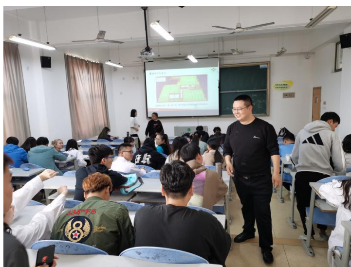
图 3 新希望六和产业学院给现代学徒制班学生授课

进一步，为了让现代学徒制班学生更加了解新希望六和股份有限公司的情况，增进企业与学生之间的交流，新希望六和产业学院老师以及在新希望工作的校友代表以亲身经历指导同学们未来职业发展规划，鼓励同学们抓住机遇认真学习，争取早日成才，现代学徒制班的学生经过不断的沟通，了解了未来到企业学习工作的具体情况，对未来的实习就业充满了期待（图 3）。