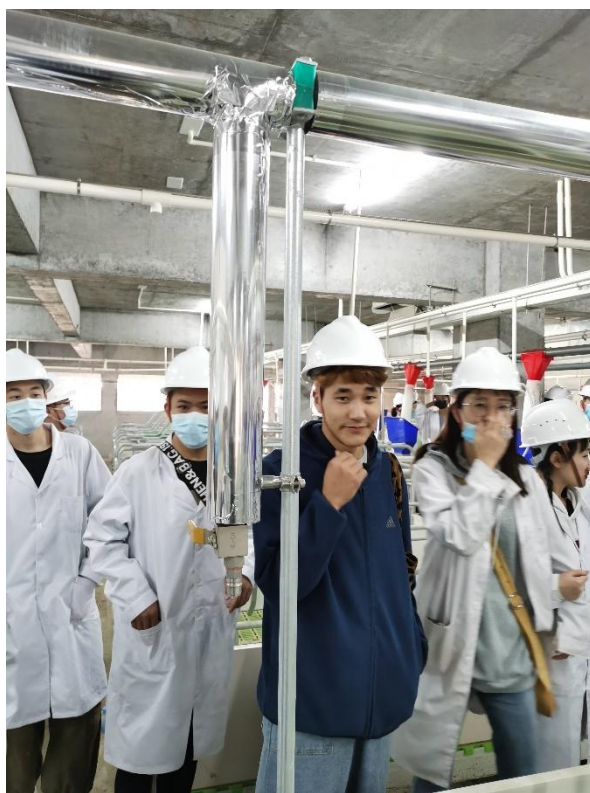
图5 新希望六和产业学院组织现代学徒制班参观企业内景