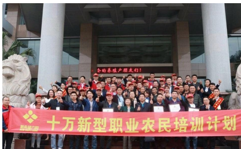
图 8 新农民培训

水产等方向，结合丰富的图文、视频、直播等教学模式，内容通俗易懂且实用。在农业农村部、中央统战部和全国工商联的指导支持下，通过线下开展培训方式，相继与江苏农林职业技术学院、山东畜牧兽医职业学院等合作，共建 10 万新型农民培训基地（图 8）。目前，已累计开展线上线下 1600 余场新农民培训，累计培训 57.6 万人次，为乡村振兴培养现代化人才。在此期间也形成了“5+N”的特色培训体系，即：一套标准流程、两版专业教材、三类精品课程、四个支持机构、五种师资来源及 N 个特色示范培训基地。