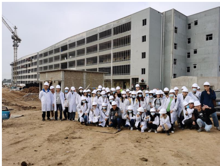
图4 新希望六和产业学院组织现代学徒制班参观活动

同时，新希望六和产业学院老师带领畜牧兽医学院现代学徒制班同学赴企业进行参观交流活动，进一步的明确了自己的奋斗的目标。就业指导活动的开展帮助现代学徒制班学生更好的进行职业规划和职业选择，提高学生的求职技巧，为学生顺利就业奠定基础（图4、图5）。