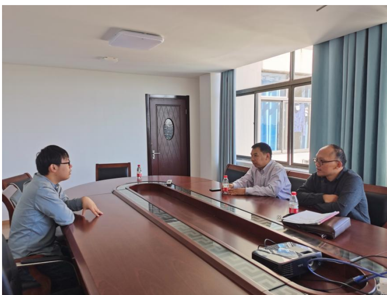
图1 新希望六和优秀员工被聘为江苏农林职业技术学院企业导师面试

2021年江苏农林职业技术学院畜牧兽医学院“新希望六和班”招生喜人。现代学徒制教学模式经过不断优化和改进，基本形成“第一年公共基础课程，培养基础素质；第二年培养专业技能；第三年在新希望六和公司进行跟班实践及顶岗实训，培养专业综合性能力和创业能力素质”的教学模式。为形成校企互聘共用的管理机制，保证校企合作班办学质量，构建了双导师制度。江苏农林职业技术学院专业教师业余时间可以到企业一线锻炼，接受行业最新技术，提高实际操作能力和服务，增强教师的执教能力。新希望六和企业每年均会选派有经验的优秀员工成为江苏农林职业技术学院畜牧兽医学院的企业导师，在学院定期进行交流活动，并作为现代学徒制班学生的企业师傅，负责学生一对一岗位技能培训，参与学生的教学、学生管理、学生考核评价等（图1）。