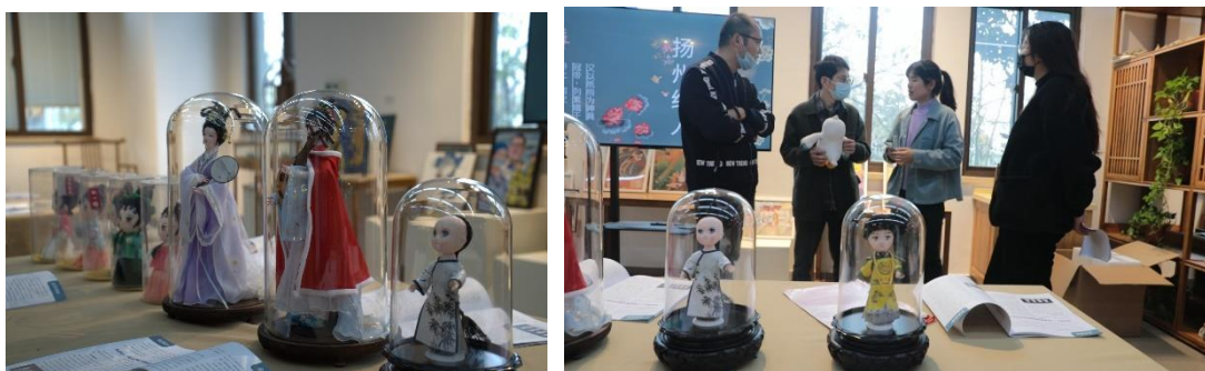
图 4-3 实训教师参与学院职业教育成果展示活动