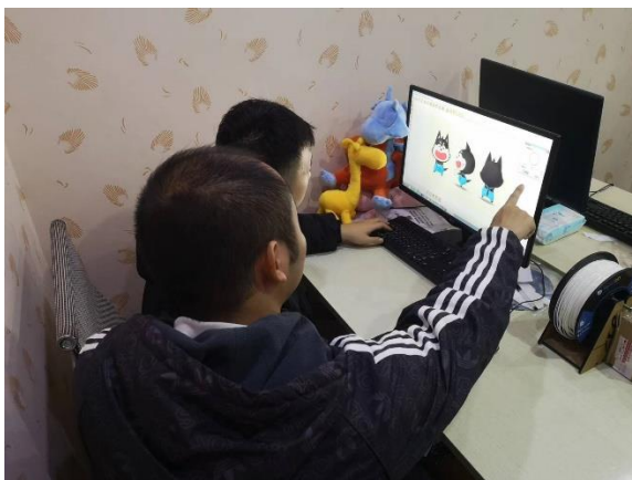
图 5-1 实训教师指导专业学生

企业安排技术人员积极参与学院专业人才培养和人才建设，提供技术指导；为在企业实习的学生安排企业实践指导老师，对学生的实践能力进行全程辅导。