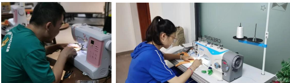
图 5-1 实训教师来校参与校本培训活动