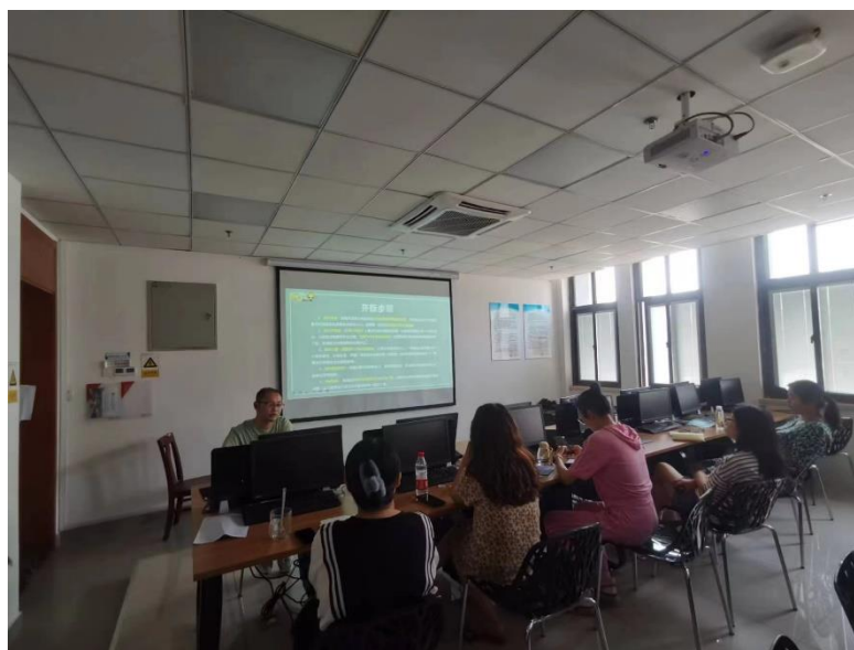
图 4-2 企业参与课程开发研讨

并与国家相关的职业资格标准要求相衔接，若干个项目课程组成课程模块，进而有机地构成与职业岗位密切对接的课程体系。