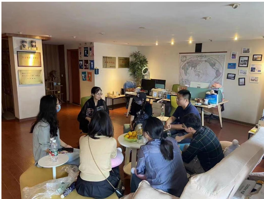
图 4-1 专业教师赴企业研讨

扬州微布坊根据校企合作协议书，管理部门专门选派 1 名管理人员负责校企协调、项目资源共享、企业文化宣贯等工作。同时，扬州微布坊为工艺美术学院数字媒体艺术设计专业课程中的文创产品设计与制作课程实践选派实训教师到校进行教学和实训指导，并对前往企业开展顶岗实习的学生委派指导教师，为前往企业进行实践锻炼的学院教师提供业务指导，逐步形成了校企共建共享的专兼职教学与管理团队。