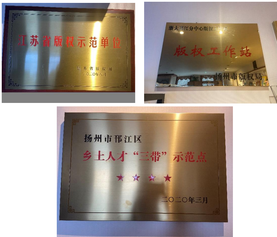
图 1-1 企业荣誉