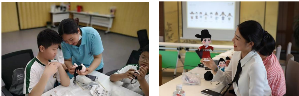
图 3-2 学生参与“产学研”交流活动

3. 扬州微布坊与工艺美术学院共享布艺文创产品设计等项目资源，扬州微布坊优质项目资源优先向工艺美术学院开放，服务学院教师技术技能积累和学生实习实训。2022 年 7 月 2 日，由微布坊与该院师生共同参与制作的布艺文创作品“扬州八怪”系列国学娃娃，已经在多次“产学研”活动中使用。