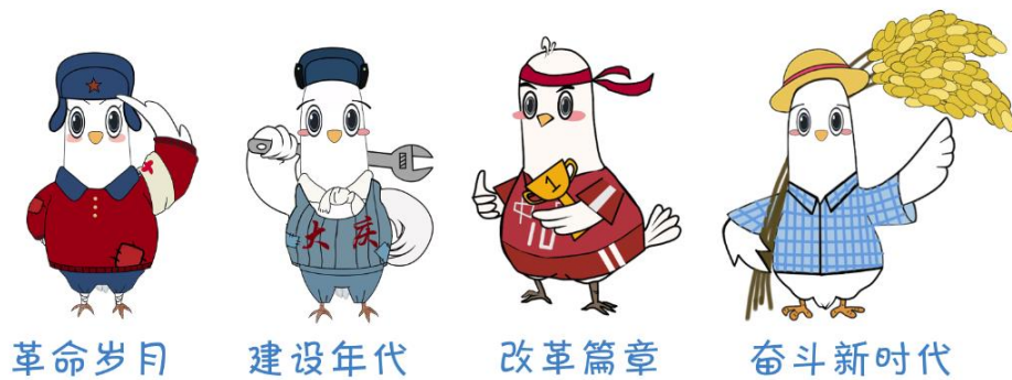
图 4-5 共同研发设计的 IP 形象